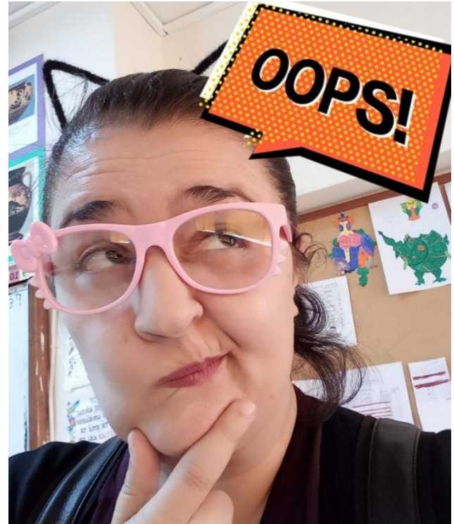
Χμμ...πως γίνεται αυτό; 1 κέφι 2 υπομονή 3 φαντασία

Στο σχολείο μαθήματα πολλά Εκεί μαθαίνω πράγματα καλά Δασκάλες και δασκάλους έχω Γιατί πολλά εγώ κατέχω. Έχω και μια θεατρική παρέα Όπου περνάμε όλοι ωραία. Αλλά του θεάτρου η κυρία Που είναι και πολύ αστεία Όλο γκάφες κάνει λέει Και της έρχεται να κλαίει