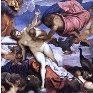
Ο Ερμής κρατά τον Ηρακλή που θηλάζει από το στήθος της Ήρας.

Η λέξη «Γαλαξίας» προέρχεται από τις λέξεις «γάλα» και «άξονας» και δόθηκε λόγω της ορατής από τη Γη γαλακτόχρωμης ζώνης του λευκού φωτός που εμφανίζεται στην ουράνια σφαίρα, όπως απεικονίζεται στη φωτογραφία. Οι Αρχαίοι έδωσαν τη δική τους ερμηνεία για την προέλευση αυτής της ζώνης. Σύμφωνα με τον μύθο, κάποτε ο Αμφιτρώνας και η Αλκμήνη απέκτησαν δυο παιδιά, τον Ηρακλή και τον Ιφικλή.