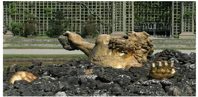
Ο Εγκέλαδος, συντριβάνι στις Βερσαλιές, Γαλλία. Κατασκευάστηκε από τον Γκάσπαρντ Μαρσού μεταξύ 1675 και 1677

έριξε πάνω του ολόκληρο το νησί της Σικελίας ή το όρος Αίτνα. Ο Εγκέλαδος κινούμενος και στενάζοντας μέσα στη Γη προκαλεί εκρήξεις ηφαιστειών και σεισμούς.