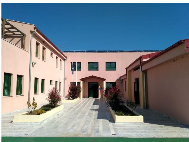
Η είσοδος του Ειδικού σχολείου που επισκεφτήκαμε στον Άγιο Αθανάσιο

Δεν έχω μάτια αλλά σε βλέπω δεν έχω στόμα αλλά σου μιλώ δεν έχω αυτιά αλλά σ' ακούω παρόλα αυτά σου τραγουδώ είν' το τραγούδι της αγάπης χωρίς αυτό δεν είμαι εγώ χωρίς αυτό δεν είσαι εδώ