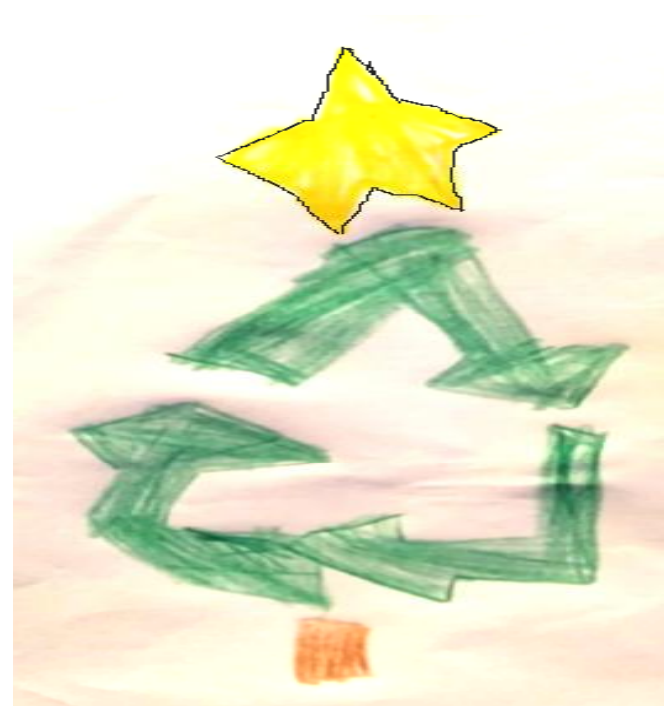
Συμεών Ορφανίδης Γ'2