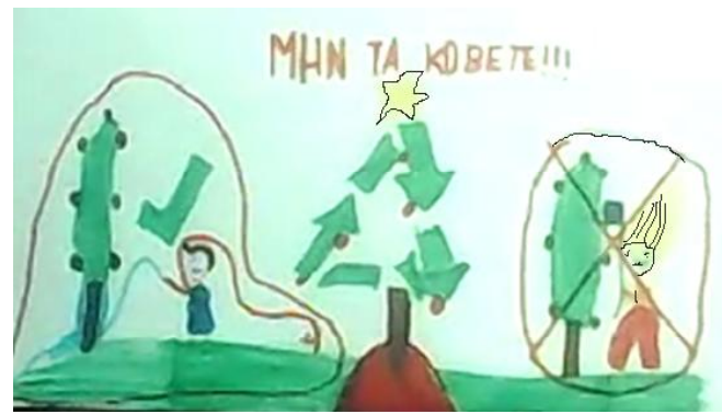
Θάνος Λειβαδιώτης Γ'2