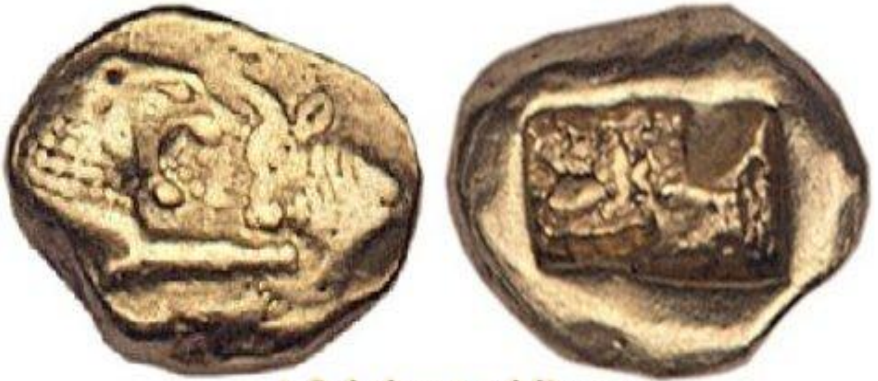
Λυδικό νόμισμα από ήλεκτρο