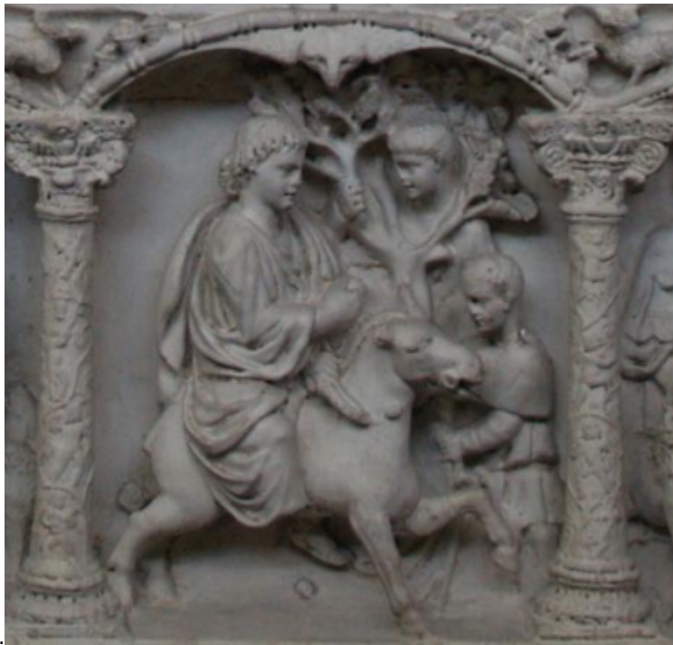
Βαϊοφόρος, Σαρκοφάγος Adelfhia, Κατακόμβες Ιωάννου, Συρακούσες, 325-350 μ.Χ.