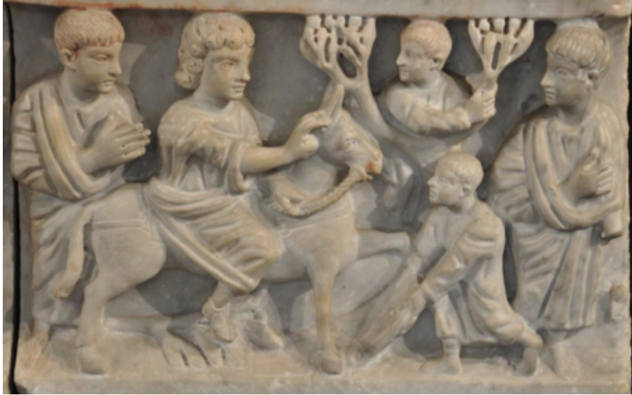
Βαϊοφόρος, Σαρκοφάγος Adelpria, Κατακόμβες Ιωάννου, Συρακούσες, 325-350 μ.Χ.