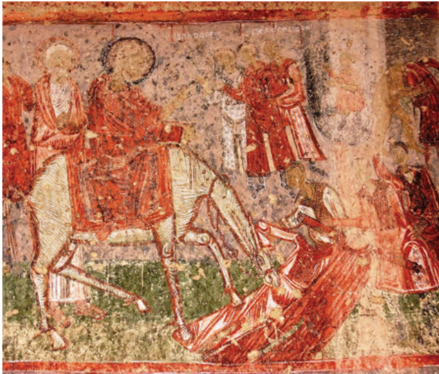
Βαϊοφόρος, τοιχογραφία, Εκκλησία Ταξιάρχη / Νικηφόρου Φωκά, Καππαδοκία. 964-965 μ.Χ.