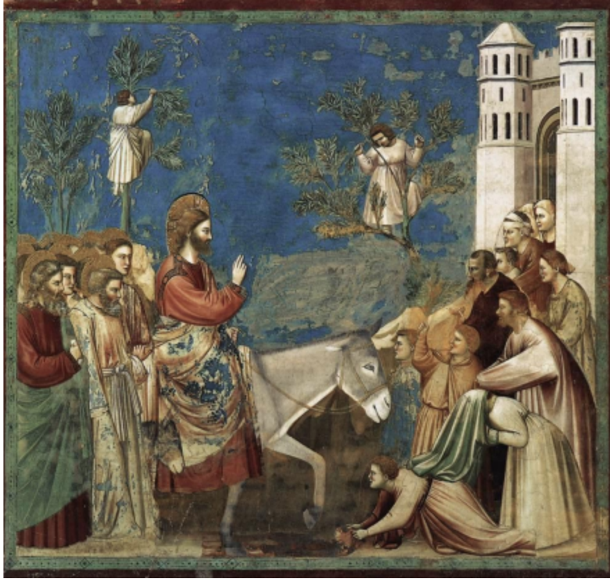
Giotta di Bondone, Η Είσοδος στα Ιεροσόλυμα, τοιχογραφία, Veneto Padua Scrovegni Cappella, 1303-5 μ.Χ.