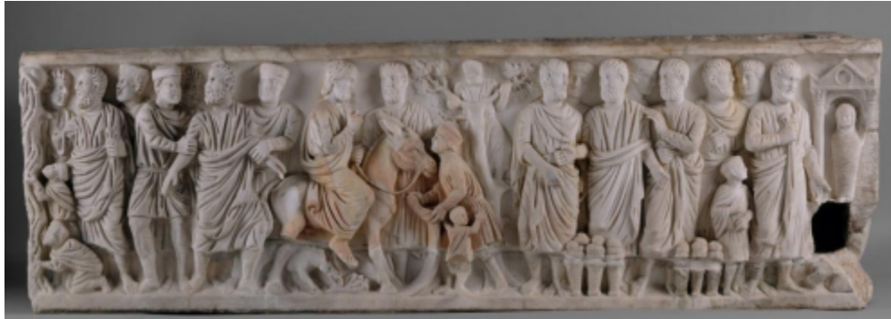
Βαϊοφόρος (λεπτ.). Σαρκοφάγος, Μητροπολιτικό Μουσείο Νέας Υόρκης, ~312 μ.Χ