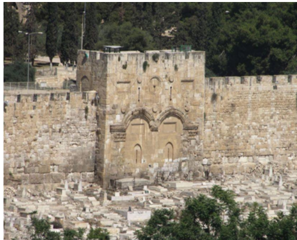
Η Χρυσή ή Ανατολική Πύλη, Ιεροσόλυμα

Η είσοδος στα Ιεροσόλυμα, γινόταν από διάφορες και ονομαστές πύλες. Οι ευαγγελιστές δεν παραδίδουν το όνομά της, ωστόσο η σχετική παράδοση θεωρούσε πάντα την ανατολική Χρυσή Πύλη, ως αυτήν δια της οποίας ο Ιησούς εισήλθε στην ιερά πόλη.