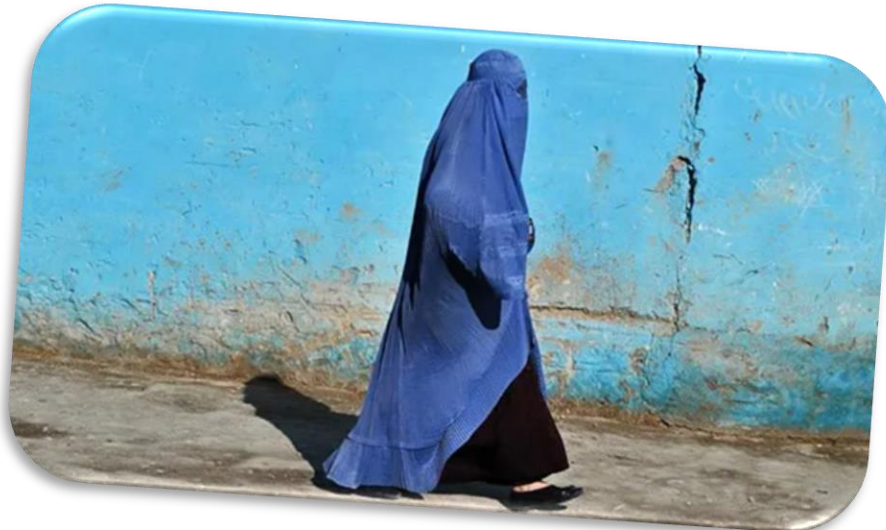
Εικόνα 9: Γυναίκα με burqa

Τα ρούχα στο Αφγανιστάν συμβολίζουν την κληρονομιά, την ταυτότητά τους και τα τρέχοντα γεγονότα. Για παράδειγμα, υπό την κυριαρχία των Ταλιμπάν, είναι υποχρεωτικό για τις γυναίκες να καλυφθούν με μπούρκα . Το burqa είναι ένας μανδύας που καλύπτει ολόκληρο το σώμα από το κεφάλι έως τα δάχτυλα. Καλύπτει επίσης το πρόσωπο, αφήνοντας μόνο ένα κομμάτι γύρω από τα μάτια για ορατότητα. Τα burqa είναι άβολα καθώς δεν υπάρχουν κομμένα μανίκια για τα χέρια, οπότε οι γυναίκες πρέπει να σηκώσουν το πέπλο για να μεταφέρουν οτιδήποτε με τα χέρια τους. Το Αφγανιστάν φημίζεται για τις μπλε μπούρκες που πολλοί ερευνητές πιστεύουν ότι συμβολίζει την προστασία. Όπως, στο Κοράνι, το μπλε είναι το χρώμα που φαινομενικά απωθεί το κακό.