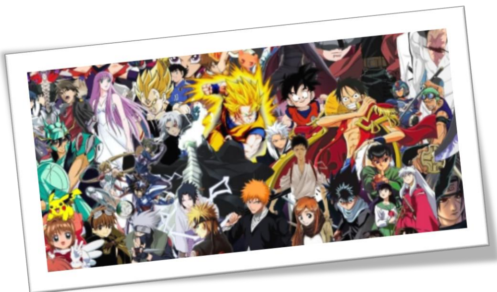
Εικόνα 4: Ήρωες Anime

Οι βασικές πηγές απ' όπου αντλούν τη θεματολογία τους τα anime είναι η ιαπωνική ιστορία, η ιαπωνική λογοτεχνία, αλλά και γενικά όλα τα κινηματογραφικά είδη. Η μουσική που συνοδεύει τα anime είναι υψηλής ποιότητας, καθώς πολλά κομμάτια αποτελούν μικρά αριστουργήματα! Γενικά, οι δημιουργοί των anime δίνουν ιδιαίτερη έμφαση στη μουσική επένδυση των ταινιών τους.