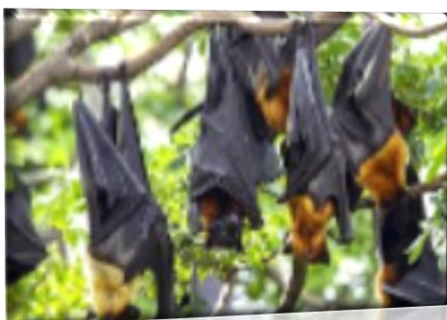
Εικόνα 6: Νυχτερίδες σε ανάποδη στάση

Η αλήθεια είναι ότι οι νυχτερίδες κινδυνεύουν σε παγκόσμιο επίπεδο και γι' αυτό τον λόγο όλα τα ευρωπαϊκά είδη νυχτερίδων προστατεύονται, τόσο από ευρωπαϊκές οδηγίες και συμβάσεις, όσο και από εθνικές νομοθεσίες.