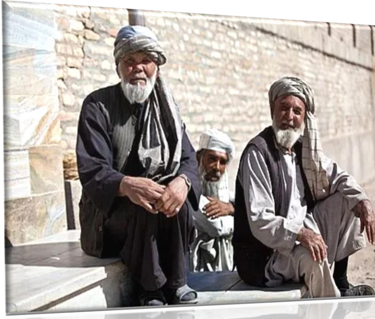
Εικόνα 12: Άντρες με τουρμπάνι

διαφορετικές περιοχές της χώρας. Αρχικά, τα φορούσαν για να προστατευθούν από τον ήλιο και τις αμμοθύελλες.