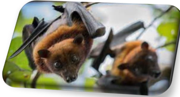
Εικόνα 5: Νυχτερίδα

Πολύ λίγα ζώα στον κόσμο είναι τόσο παρεξηγημένα, όσο οι νυχτερίδες. Όπως και οι αλεπούδες σε διάφορους μύθους, οι νυχτερίδες παρουσιάζονται ως μοχθηρά ζώα που σκορπούν τον φόβο και τον θάνατο. Η προκατάληψη αυτή ίσως σχετίζεται με το γεγονός ότι οι νυχτερίδες είναι μυστηριώδη ζώα, καθώς η νυχτερινή τους πτήση και η παραμονή τους σε σκοτεινές σπηλιές δυσκολεύουν τη μελέτη του είδους. Ο φόβος και η αντιπάθεια που υπάρχει απέναντι τις νυχτερίδες επηρεάζουν το πώς αντιμετωπίζουμε το ιδιαίτερο αυτό ζώο, που είναι το μόνο ιπτάμενο θηλαστικό στον πλανήτη.