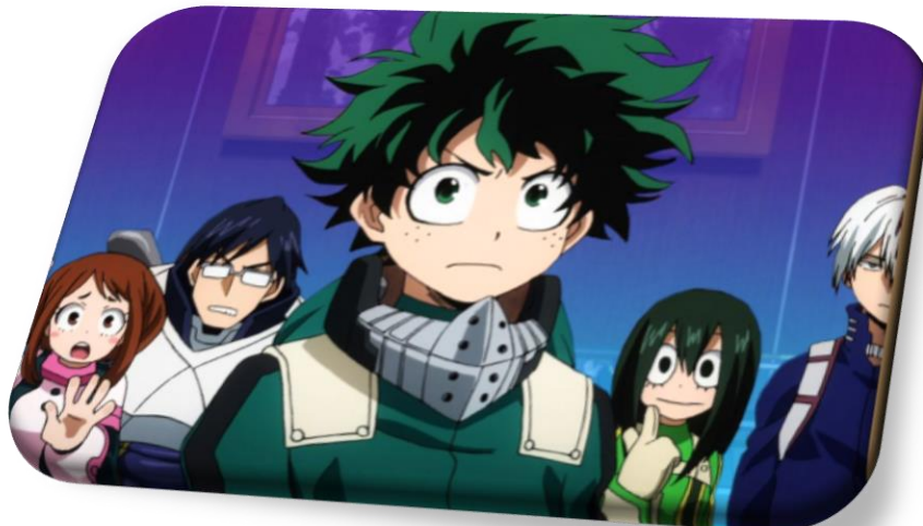
Εικόνα 1: Κκινούμενα σχέδια Anime

Ο σχεδιασμός των χαρακτήρων σε ένα anime μπορεί συχνά να συνοδεύεται από υπερβολικά οπτικά εφέ, τα οποία προσδίδουν αίγλη. Έτσι, τα πρόσωπα εμφανίζονται με μεγάλα μάτια, μικρό στόμα και μύτη ή ξεθωριασμένα και πολύχρωμα μαλλιά. Όσον αφορά τις διαφορετικές ψυχικές καταστάσεις, οι εκφράσεις των ηρώων πολλές φορές δεν είναι ρεαλιστικές, αφού το πρόσωπο και άλλα χαρακτηριστικά του μεγεθύνονται υπερφυσικά, ανάλογα με την ένταση του συναισθήματος. Επίσης, οι τοποθεσίες που παρουσιάζονται συνήθως είναι πολύ λεπτομερείς σε σχεδιασμό, και συχνά είναι εμπνευσμένες από πραγματικά μέρη.