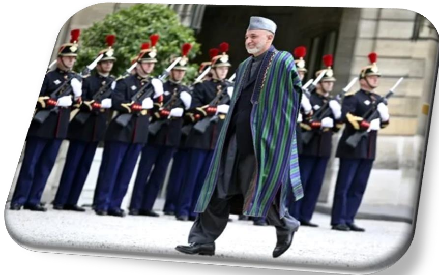
Εικόνα 11: Ο πρώην Πρόεδρος του Αφγανιστάν, Χαμίτ Καρζάι, φορώντας καπέλο rigan , chapan και καπέλο karakul

Η στολή συμπληρώνεται με καλύμματα κεφαλής. Μια επιλογή είναι το καπέλο Karakul . Το καπέλο είναι ακριβό επειδή είναι κατασκευασμένο από μαλλί του περσικού αρνιού, μία από τις κύριες εξαγωγές του Αφγανιστάν. Καθώς είναι απρόσιτο σε πολλούς, το καπέλο θεωρείται ως σύμβολο πλούτου στο Αφγανιστάν. Υποδηλώνει επίσης σοφία και εξουσία, επομένως οι πρεσβύτεροι της κοινότητας, οι πολιτικοί και οι κυβερνητικοί εργαζόμενοι συχνά φαίνονται να φορούν.