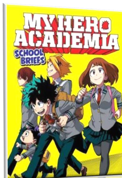
Εικόνα 3: Manga comic