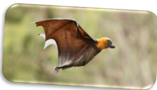
Εικόνα 7: Νυχτερίδα που πετάει