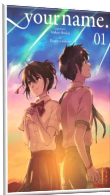
Εικόνα 2: Manga comic

Μετά τον πόλεμο και την καταστροφή της Ιαπωνίας, ξεκίνησε πάλι μια νέα προσπάθεια με την αποκορύφωση να έρχεται το 1970, όπου παρατηρείται μια μεγάλη άνθηση στην παραγωγή anime ταινιών, αλλά και των δημοφιλών manga, την αντίστοιχη έκφραση των anime σε μορφή comic. Ο Osamu Tezuka θεωρείται θρόλος των manga. Το έργο και οι χαρακτήρες του ενέπνευσαν πολλές γενιές animators και συνεχίζουν να το κάνουν μέχρι σήμερα. Πλέον το anime έχει πολλούς οπαδούς στην Ελλάδα και σε όλο τον κόσμο.