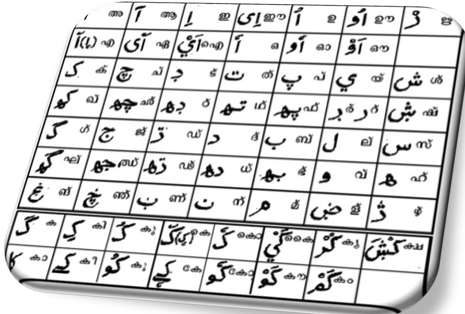
Εικόνα 12: Αραβική γλώσσα

και ποιησης) σε πολλές απ' αυτές. Επίσης χρησιμοποιούνται σε διάφορους βαθμούς στην ανεπίσημη γλώσσα των μέσων, όπως στις σαπουνόπερες και τις εκπομπές κουβέντας.