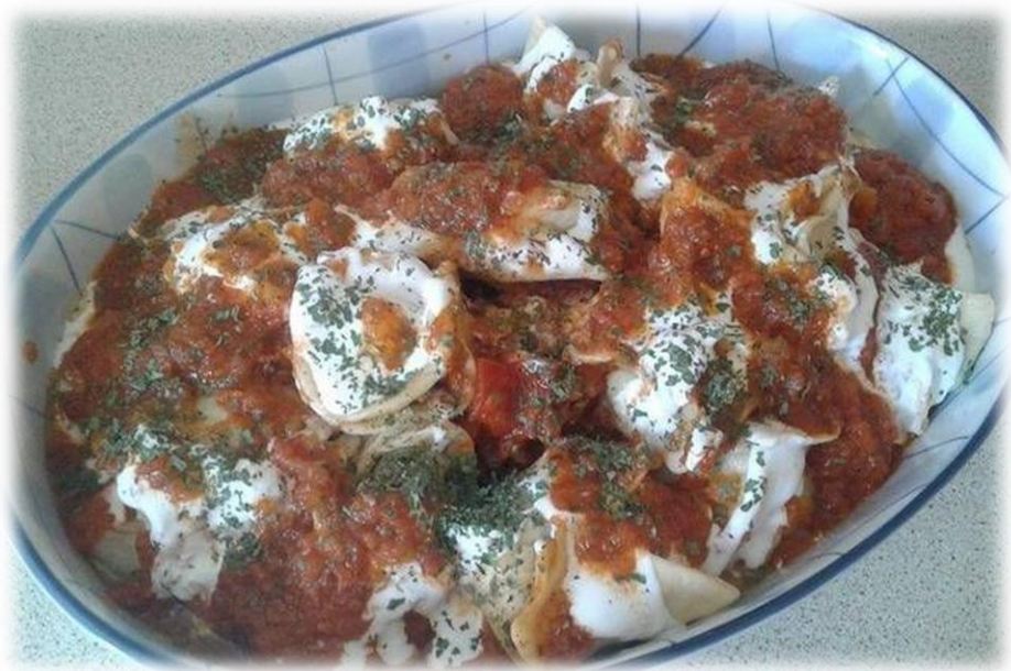
Εικόνα 13: Ashak