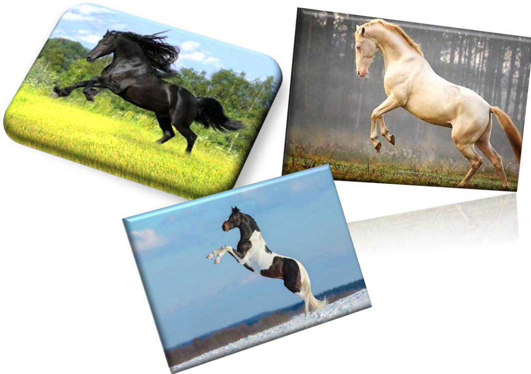
Εικόνα 15: άλογα

Η εγκυμοσύνη διαρκεί 11 μήνες. Το άλογο είναι ικανό για αναπαραγωγή από την ηλικία των 2 περίπου χρόνων. Επιπλέον, για να προσφέρει τις υπηρεσίες του το άλογο χρειάζεται περιποίηση, ώστε να διατηρείται γερό και δυνατό. Ο οργανισμός τους είναι ευαίσθητος σε ορισμένες ασθένειες, όπως είναι η μάλη και η σηψαιμία και υποφέρει από ορισμένα παράσιτα. Γι' αυτό χρειάζεται καθαριότητα και άγρυπνη παρακολούθηση της υγείας του. Επίσης καθώς μεγαλώνουν τα άλογα μακραίνουν και τα δόντια του. Τέλος, αν θες να μάθεις πόσο χρόνων είναι ένα άλογο το βλέπεις από τις μαυρίλες που έχει στα δόντια του.