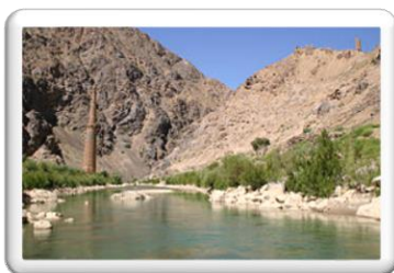
Εικόνα 4: Ποταμός Χάριρουντ ή Χαριρούντ