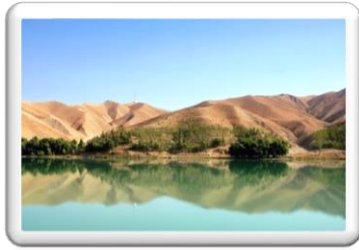
Εικόνα 5: Ποταμός Καμπούλ