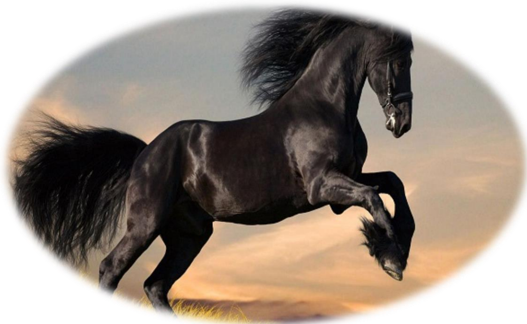
Εικόνα 14: Άλογο

Το άλογο είναι από τα μεγάλα θηλαστικά ζώα, σπονδυλόζωο και χορτοφάγο. Το σώμα του έχει αρμονικές αναλογίες και όμορφη εμφάνιση. Ο λαιμός του είναι μακρύς με μεγάλη χαιτή. Τα μάτια του είναι μεγάλα και τα αυτιά του μικρά σε σχέση με το σώμα του και μυτερά, τεντωμένα στο πάνω μέρος του κεφαλιού. Επίσης, η ουρά του είναι μεγάλη και φουντωτή, με τρίχες μεγάλες που καλύπτουν όλο το μήκος της. Το ύψος του φτάνει από 90εκ. έως 1,85μ. για το ψηλόσωμα άλογο, Τα πόδια του είναι μεγάλα, ψηλά αλλά και δυνατά. και καταλήγουν το καθένα σε ένα μόνο δάχτυλο, γι' αυτό και τα άλογα ανήκουν στα μόνοπλα ζώα. Το στήθος του είναι πλατύ, μεγάλο, για να αναπνέει εύκολα και γρήγορα όταν τρέχει σε δύσκολους και κουραστικούς δρόμους. Οι μυς του σώματος του είναι πολλοί και ισχυροί, αλλά όχι πλαδαροί, και δίνουν πλαστικότητα και ευλυγισία στο κορμί του. Το σώμα του καλύπτεται από πυκνό τρίχωμα, με κοντές, φιλές και απαλές τρίχες.