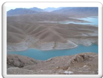
Εικόνα 2: Ποταμός Αμού Ντάρια