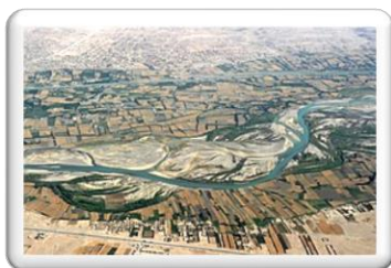
Εικόνα 3: Ποταμός Χέλμαντ, ή Χίλμεντ