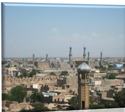
Εικόνα 9: Χεράτ