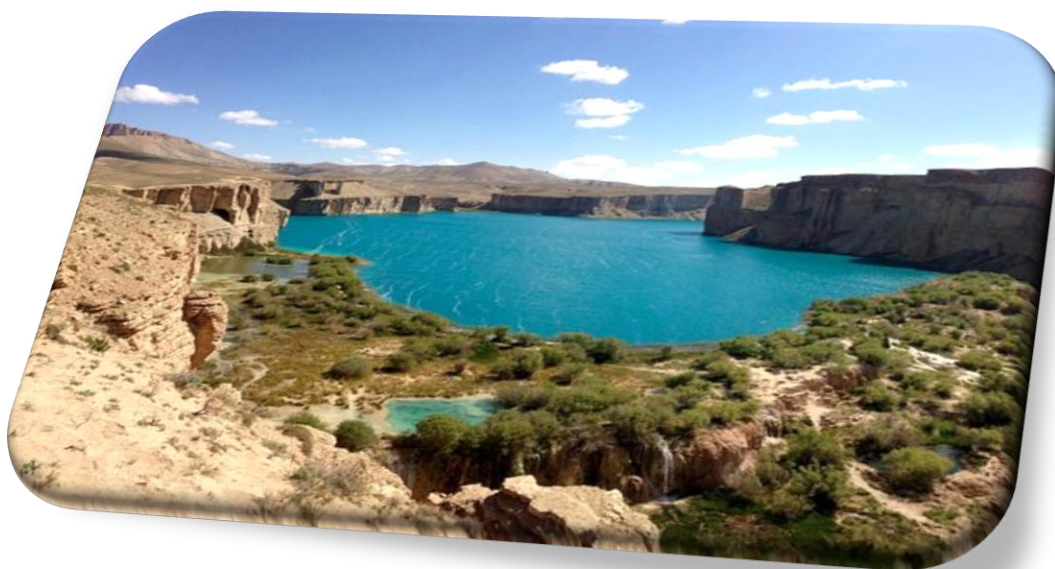
Εικόνα 7: Band-e-Amir National Park

Το κλίμα του Αφγανιστάν είναι κυρίως ηπειρωτικό ξηρό, ενώ στα νότια και ανατολικά (στα σύνορα προς το Πακιστάν) είναι υποτροπικό, δηλαδή αυτό της άνυδρης στέπας με ψυχρούς χειμώνες και πολύ ζεστά καλοκαίρια. Ακόμη, υπάρχουν πολλές κλιματικές διαφορές, όπως στο ΒΑ τμήμα όπου το κλίμα είναι υπο-αρκτικό. Γενικά το κλίμα της Χώρας επηρεάζεται και από τους Μουσώνες του Ινδικού Ωκεανού με υγρασία και βροχές από τον Ιούλιο μέχρι το Σεπτέμβριο. Γενικά στο Αφγανιστάν παρατηρούνται μεγάλες διαφορές θερμοκρασίας από 49 °C (Τζαλαλαμπάντ) τον Ιούλιο, μέχρι -31°C (ορεινές περιοχές), το χειμώνα. Οι περισσότερες βροχοπτώσεις παρατηρούνται στο διάστημα από Δεκέμβριο μέχρι Μάρτιο, ενώ στα πεδινά συνεχίζουν μέχρι και τον Απρίλιο. Η απομόνωση ολόκληρης της χώρας από την θάλασσα και το μεγάλο υψόμετρο των περισσότερων περιοχών του Αφγανιστάν, έχει ως αποτέλεσμα οι χειμώνες στη χώρα να είναι αρκετά ψυχροί.