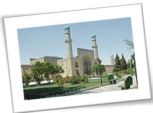
Εικόνα 10: το ιερό τέμενος της Χεράτ

Η Χεράτ ή Χαράτ είναι η σημαντικότερη πόλη στο βορειοδυτικό Αφγανιστάν. Είναι παραποτάμια πόλη που βρίσκεται στη κοιλάδα του Χαρίρουντ ποταμού, που ρέει από τα όρη του κεντρικού Αφγανιστάν προς το Τουρκμενιστάν. Η Χεράτ είναι η τρίτη σε πληθυσμό πόλη του Αφγανιστάν μετά την πρωτεύουσα αμπούλ και την Κανταχάρ. Η γλώσσα που μιλάνε είναι η περσική και τα φαρσί. Ακόμη, στη Χεράτ υπάρχει ένα από τα σημαντικότερα πανεπιστήμια του Αφγανιστάν καθώς και το διεθνές αεροδρόμιο. Επίσης στην πόλη αυτή αναπτύχθηκε η φημισμένη ομώνυμη Σχολή Χεράτ που αφορά τεχνοτροπία της ισλαμικής ζωγραφικής και ειδικότερα της μικροτεχνίας, της οποίας κυρίαρχη μορφή υπήρξε ο Μπεχζάντ.