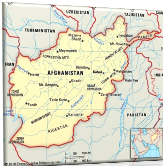
Εικόνα 1: Αφγανιστάν

Το Αφγανιστάν είναι χώρα στη νότια κεντρική Ασία. Το επίσημο όνομα της χώρας, είναι Ισλαμικό Εμιράτο του Αφγανιστάν . Η χώρα συνορεύει βόρεια με το Τατζικιστάν, το Τουρκμενιστάν και το Ουζμπεκιστάν, βορειοανατολικά με την Κίνα, ανατολικά και νότια με το Πακιστάν και δυτικά με το Ιράν. Έχει έκταση περίπου 647.500 τ.χλμ και ο πληθυσμός της χώρας είναι 32.890.171 κάτοικοι, σύμφωνα με επίσημη εκτίμηση για το 2020. Οι κάτοικοι ανήκουν κυρίως στις εθνότητες των Παστούν, των Τατζίκων, των Χαζάρων και των Ουζμπέκων. Το Αφγανιστάν είχε πάντα στρατηγική θέση, καθώς μπορούσε να ελέγχει το διεθνές εμπόριο, ενώ υπήρξε μια από τις κατακτήσεις του Μ. Αλέξανδρου, αλλά και μεταγενέστερων κατακτητών.