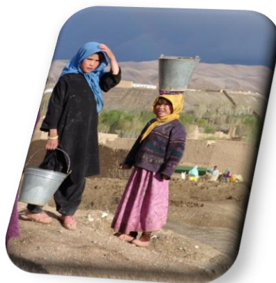
Εικόνα 8: Καμπούλ

Η Καμπούλ είναι η πρωτεύουσα και η μεγαλύτερη σε πληθυσμό πόλη του Αφγανιστάν, περίπου 3.000.000. Είναι χτισμένη στην κοιλάδα του ποταμού Καμπούλ ανάμεσα στα βουνά του Χίντου Κους, σε μέσο υψόμετρο 1790 m πάνω από την επιφάνεια της θάλασσας. Η Καμπούλ έχει ιστορία μεγαλύτερη των τριάντα αιώνων, καθώς πολλοί στρατοί πολέμησαν για τη στρατηγική της θέση στον Δρόμο του μεταξιού. Το 1776 ο Τιμούρ Σαχ Ντουράνι την ανακήρυξε πρωτεύουσα του νέου κράτους του Αφγανιστάν. Ο πληθυσμός της σήμερα μιλά κυρίως τη διάλεκτο νταρί της περσικής γλώσσας, ενώ τα κυριότερα προϊόντα της είναι τα υφάσματα, η ζάχαρη από ζαχαρότευτλα και τα έπιπλα.