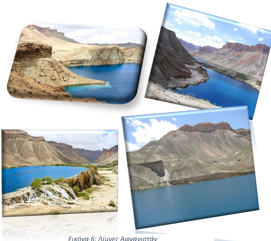
Εικόνα 6: Λίμνες Αφγανιστάν