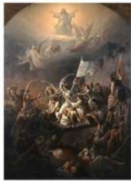
Η ..... του Μεσολογγίου