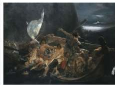
Μετά την καταστροφή των .....