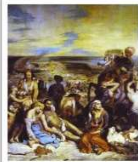
Η σφαγή της .....