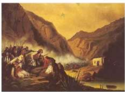
Η μάχη στα στενά των .....