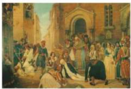
Η ..... του Ιωάννη Καποδίστρια

1. Βρες τους τίτλους των πινάκων που εικονίζουν σκηνές σχετικές με την ελληνική επανάσταση.