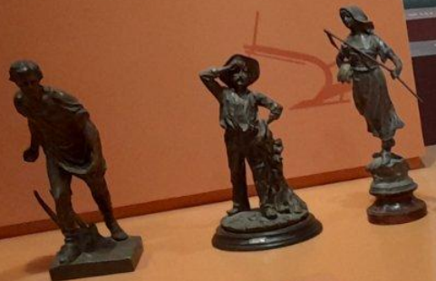
Three bronze figurines depicting agricultural scenes: a man plowing, a man sowing, and a man with a scythe.

Autumn is the season for ploughing. Ploughing aerates and turns the soil, allowing it to receive the seed. Farmers used to use wooden and later metal ploughs pulled by a pair of animals to create furrows in their fields. Then they would walk between the furrows, sowing the seeds by hand. The seeds would then spring into life with the rains that followed.