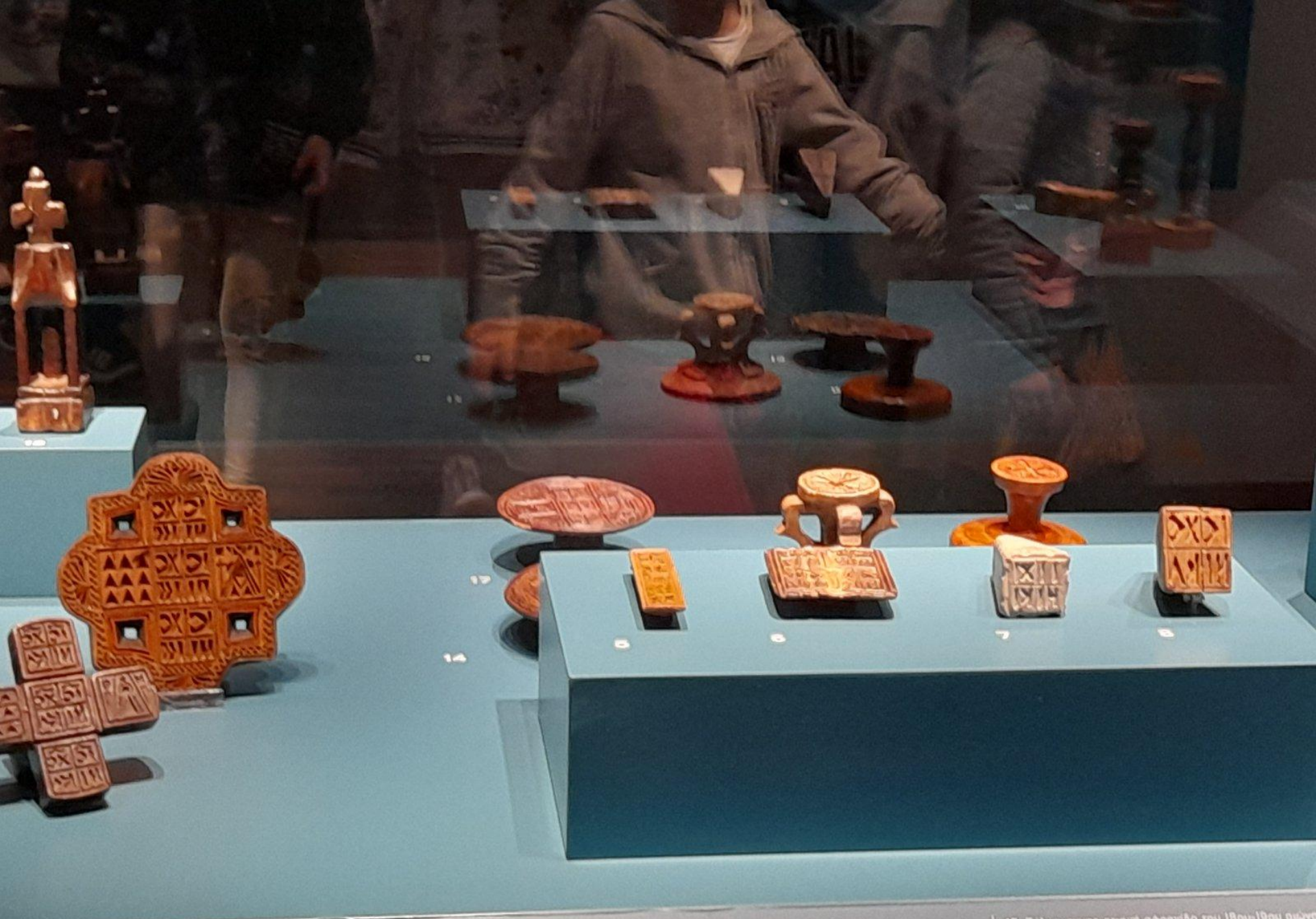
9. Τμήμα ξύλινης διπλής ευχαριστιακής σφραγίδας (μερίδιο της Θεσοκόου) του 19ου αι., από την Τασκένδη. 9. Part of a wooden double stamp for eucharistic bread from the 19th c. From Tashkent.