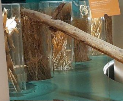
Small informational card on the floor.