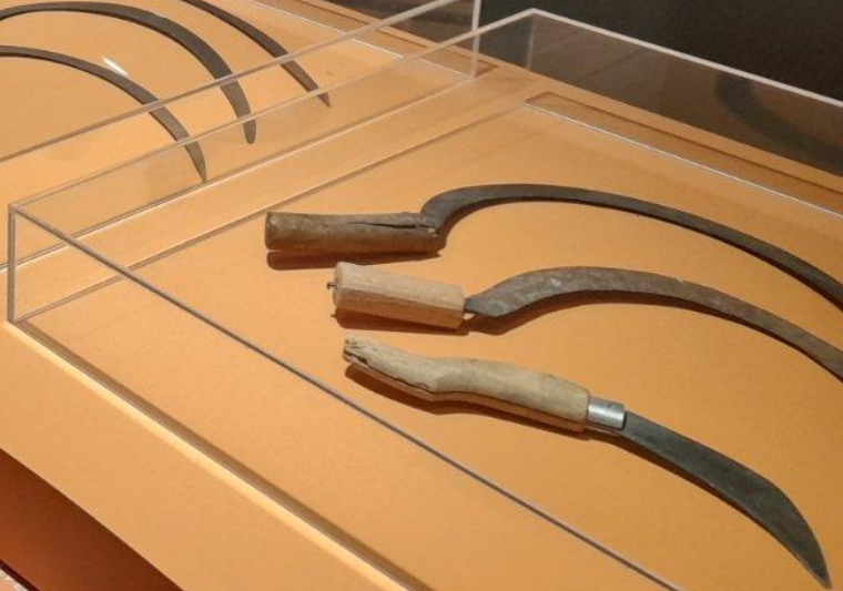
A wooden-handled sickle with a curved blade, displayed in a glass case.

Η άνοιξη περιζείται και ανακατεύεται το χώμα. Περπατάει στα αυλάκια το σπόρο. Με τη βοήθεια του αλετριού, αρχικά ξύλινου αργότερα σιδηρένιου, που το έσπινε ένα ζευγάρι ζώων, οι αγρότες άνοιγαν τα χωράφι, δημιουργώντας αυλάκια. Έπειτα, περπατώντας, έριχνε τους σπόρους με το χέρι στα αυλάκια. Οι βροχές που ακολουθούσαν ήταν ευεργετικές για τα σπάρια.