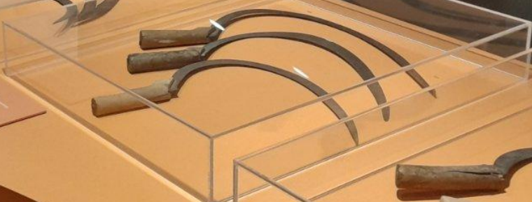
Three wooden-handled scythes with curved blades, displayed in a glass case.