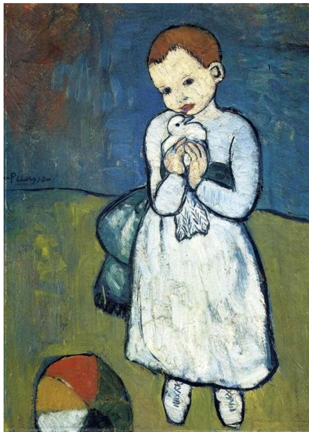
Πάμπλο Πικάσο, Παιδί με περιστέρι