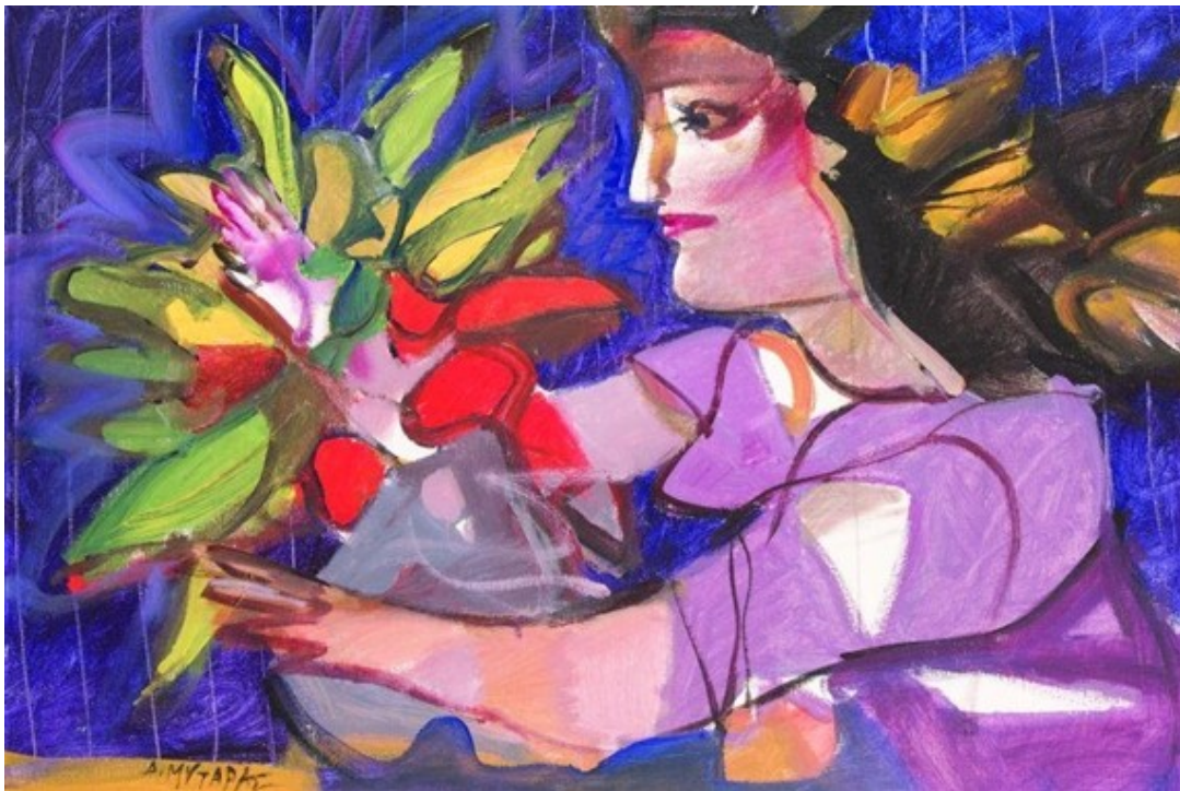
Δημήτρης Μυταράς, χωρίς τίτλο

Και αφού διαλέξεις ένα πίνακα... κάντον να ζωντανέψει! Με ποιο τρόπο; Ντύσου όπως το πρόσωπο του πίνακα και κάνε ό,τι κάνει κι εκείνο! Μην ξεχάσεις το φόντο. Καλή διασκέδαση και... περιμένουμε φωτογραφία σου! Να θυμάσαι ότι η κυρία Φαντασία θα είναι εκεί να σε βοηθήσει.