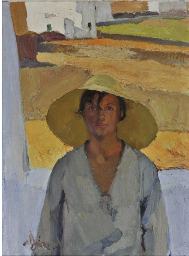
Νικόλαος Λύτρας, Το ψάθινο καπέλο