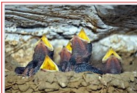
Μικρά χελιδόνια περιμένουν την τροφή τους