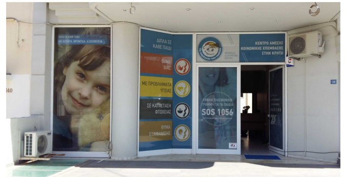
Εικ.2 Κέντρο Άμεσης Κοινωνικής Επέμβασης, Ηράκλειο Κρήτης.