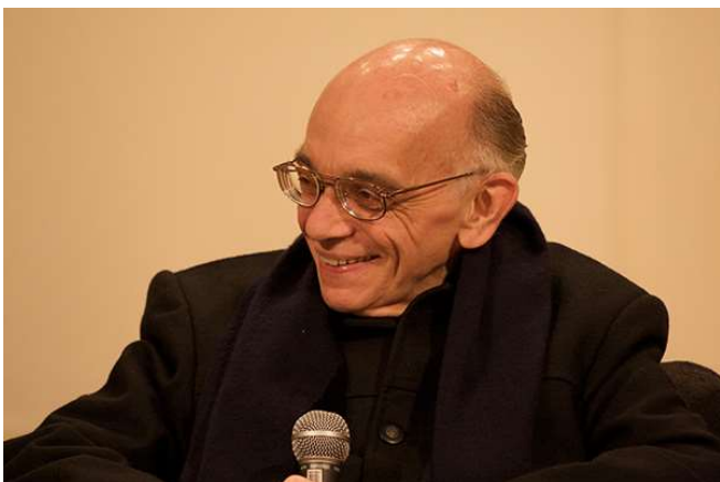
Εικ.: Ο José Antonio Abreu.

Το βιβλίο, που αξιοποιήθηκε για τις ανάγκες του διαγωνισμού, συνεγράφη από την Αγγελική Δαρλάση , η οποία το ενεπνεύσθη από την ιστορία του « El Sistema », το οποίο είναι ένα χρηματοδοτούμενο, εθελοντικό, πρόγραμμα μουσικής εκπαίδευσης, που ιδρύθηκε στη Βενεζουέλα το 1975 από τον Βενεζουελανό εκπαιδευτικό, μουσικό και ακτιβιστή José Antonio Abreu . Αργότερα υιοθέτησε το σύνθημα « Music for Social Change ».