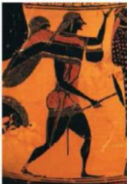
Μελανόμορφος αμφορέας που απεικονίζει τον Αρισταίο, γύρω στο 540 π.Χ. Ελληνική Μυθολογία, Εκδοτική Αθηνών, τόμος 3ος, Αθήνα. 1986.

Ο Αρισταίος ήταν γιος του Απόλλωνα και της Κυρήνης, γεννήθηκε στη Λιβύη και ο Ερμής τον πήρε και τον πήγε στη Γαία και στις Ώρες για να τον αναθρέψουν. Ήταν ένα χαρισματικό παιδί που έζησε ονειρεμένα χρόνια κοντά στις όμορφες και πολύξερρες Νύμφες. Οι Μούσες, που, όταν μεγάλωσε, του είχαν αναθέσει τη φύλαξη των κοπαδιών τους στη Φθία, του δίδαξαν τη μαντική και την ιατρική τέχνη.