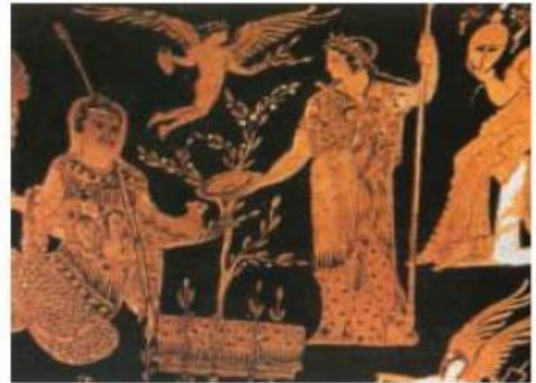
Νίκος & Μαρία Ψιλάκη - Ηλιάς Καστανάς, Ο πολιτισμός της ελιάς, εκδ. Καρμάνωρ, Ηράκλειο, 1999.

Ο Ποσειδώνας, θεός-κυρίαρχος των θαλασσών, σήκωσε την τρίαινά του και την κάρφωσε στον ιερό βράχο της Ακρόπολης. Αλμυρό νερό ροιζοφόρησε να αναβλύζει και να κυλά στα ριζά του βράχου. Πίστευε ο Ποσειδώνας πως αυτή η πηγή στο άνυδρο τοπίο της Αττικής θα μπορούσε να του προσφέρει τη νίκη. Η Αθηνά δε χρειάστηκε να κάνει καμιά εντυπωσιακή κίνηση. Σήκωσε μόνο και φύτεψε στον ίδιο τόπο μια ελιά. Μέσα σε λίγη ώρα είχε βλαστήσει και το ασημοπράσινο φύλλωμά της τους είχε όλους εντυπωσιάσει.