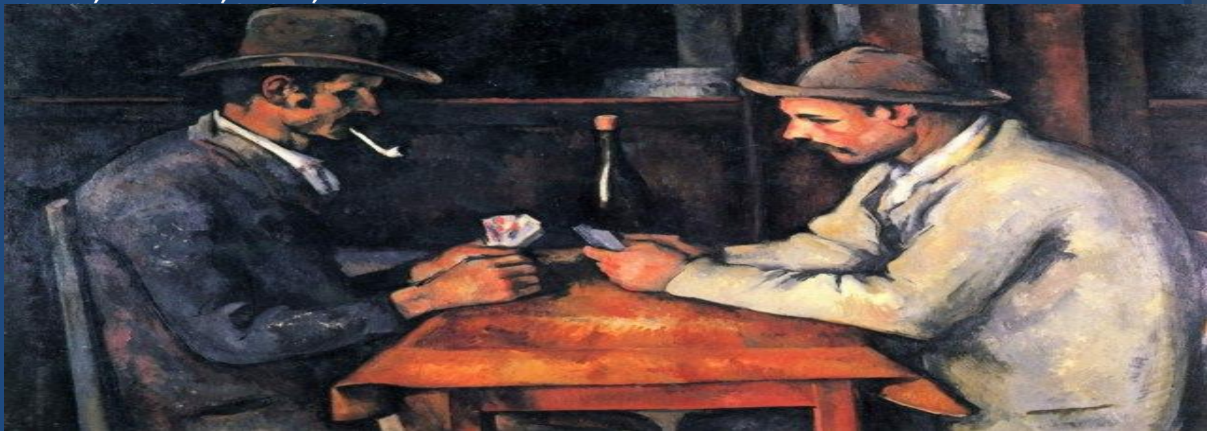
Paul Cézanne «The Card Players», 1892/93

Εδώ εξετάζονται τα έργα τέχνης, από το μεσαίωνα, την αναγέννηση και τη σύγχρονη εποχή. Το χρήμα εκτός από ένα κοινά αποδεχτό μέσο συναλλαγής, μέσο υπολογισμού της αξίας, είναι και μέσο διατήρησης της περιουσίας. Στη διάρκεια του χρόνου οι άνθρωποι αποθησαύριζαν σε χρυσό ή σε πολύτιμα μέταλλα, αργότερα σε νομίσματα, στη συνέχεια σε χαρτονομίσματα, μετοχές και ομόλογα. Στη σημερινή εποχή παρατηρείται μια ιδιαίτερη τοποθέτηση του χρήματος κυρίως από άτομα με μεγάλη οικονομική