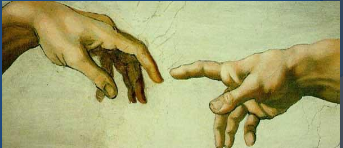
Ένα μουσείο για την Αναγέννηση

Παρατηρούμε συχνά ότι η τέχνη και ο πολιτισμός αναπτύσσονται συχνά όπου υπάρχει οικονομική ευημερία. Κατά τη διάρκεια της Αναγέννησης τα χρήματα και η τέχνη συμβάδιζαν. Οι καλλιτέχνες εξαρτιόνταν ολοκληρωτικά από προστάτες των τεχνών, ενώ οι τελευταίοι χρειάζονταν χρήματα για να συντηρούν ιδιοφυείς ανθρώπους. Έτσι, αρχίζει αυτή η σχέση τέχνης-χρήματος και η ποιότητα των έργων τέχνης εκτιμάται.