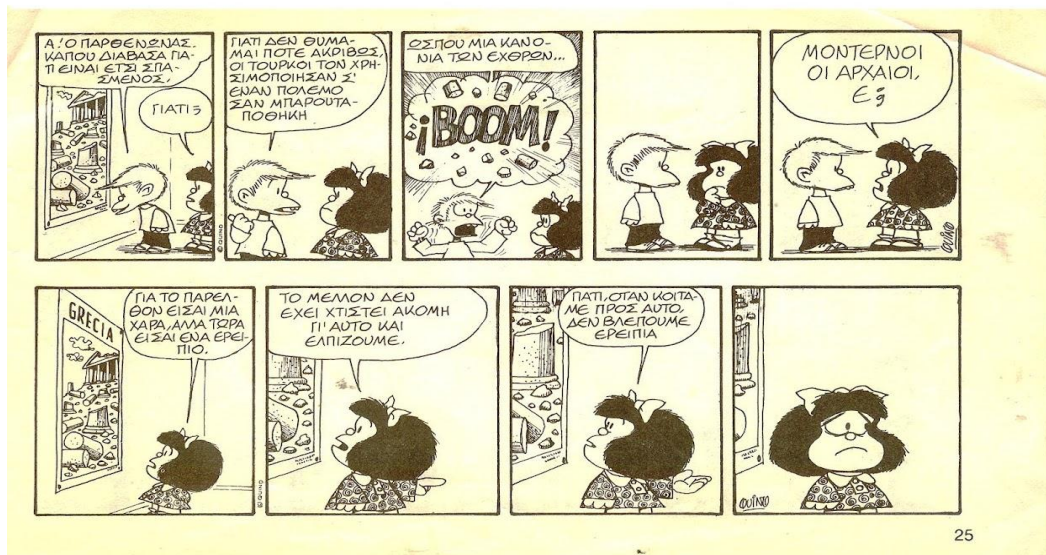
Αναφορές της Μαφάλντα για την Ελλάδα