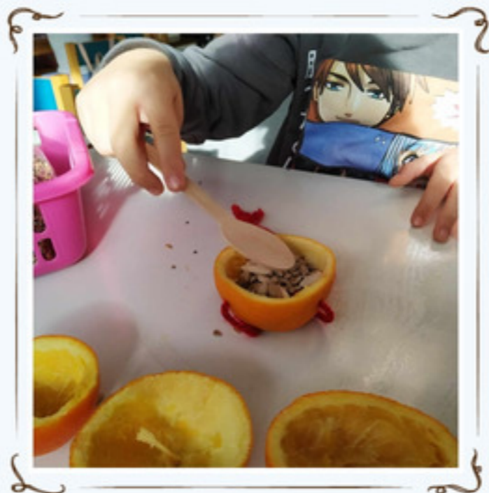
Γεμίσαμε τις φλούδες με σπόρους....