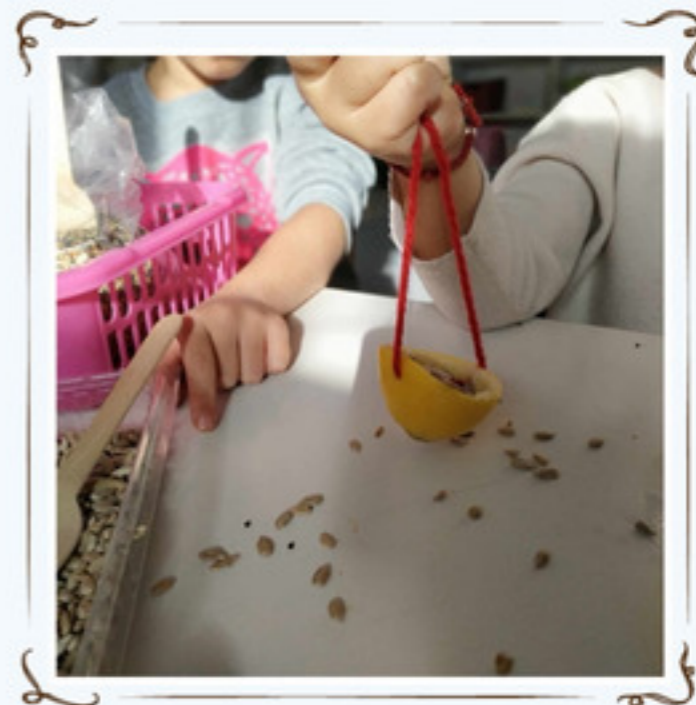
Με πολλή προσοχή.....