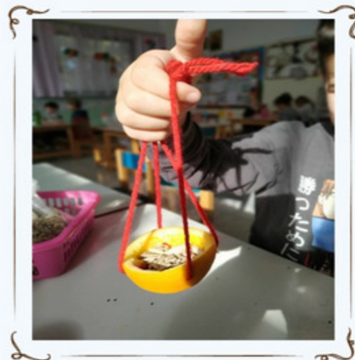
Και να το αποτέλεσμα!!!