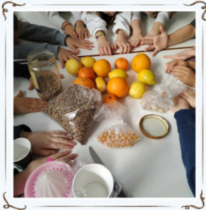
Συγκεντρώσαμε τα φρούτα...