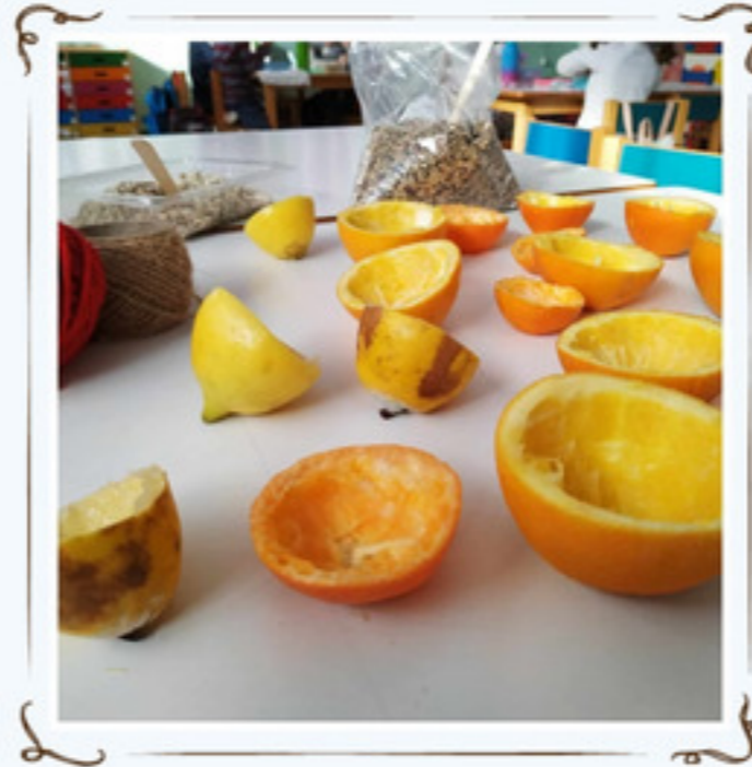
Στύψαμε το χυμό τους....