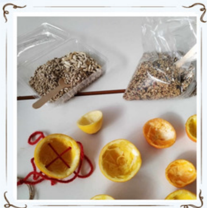
Μετά αρχίσαμε τη δουλειά.....