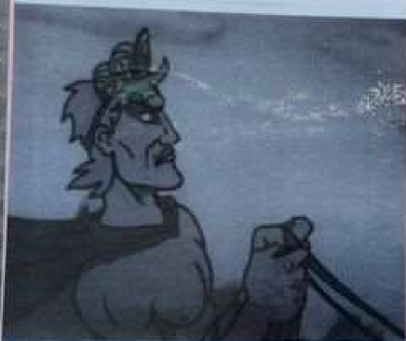
Ο Βασις ΠΑΥΣ Στρατεύεται εν τη μάχη Κλεονόου αλλ' ουκ εστιν ο Πάυς ουκ ελπίσας ουτω μισθόν.