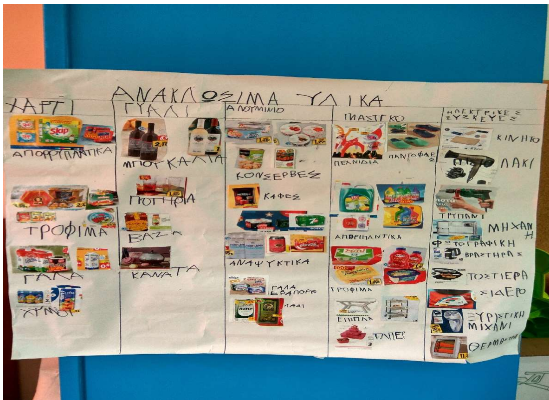
Εικόνα 2 Δημιουργία Πίνακα Αναφοράς με Κατηγορίες ανακυκλώσιμων υλικών