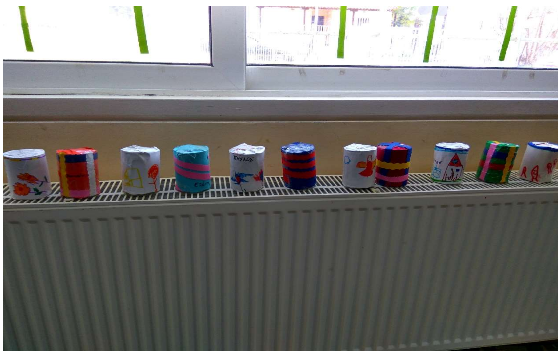
Εικόνα 7 Οι μαράκες μας διακοσμημένες ελεύθερα από τα παιδιά