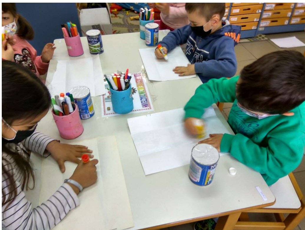
Εικόνα 6 Εικαστικά / Δημιουργία μαράκας με μεταλλικό κουτί