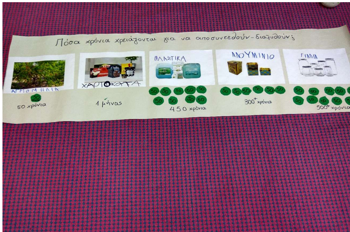
Εικόνα 4 Δημιουργία Πίνακα Αναφοράς αποσύνθεσης διαφόρων υλικών/ Σύγκριση του χρόνου αποσύνθεσής τους