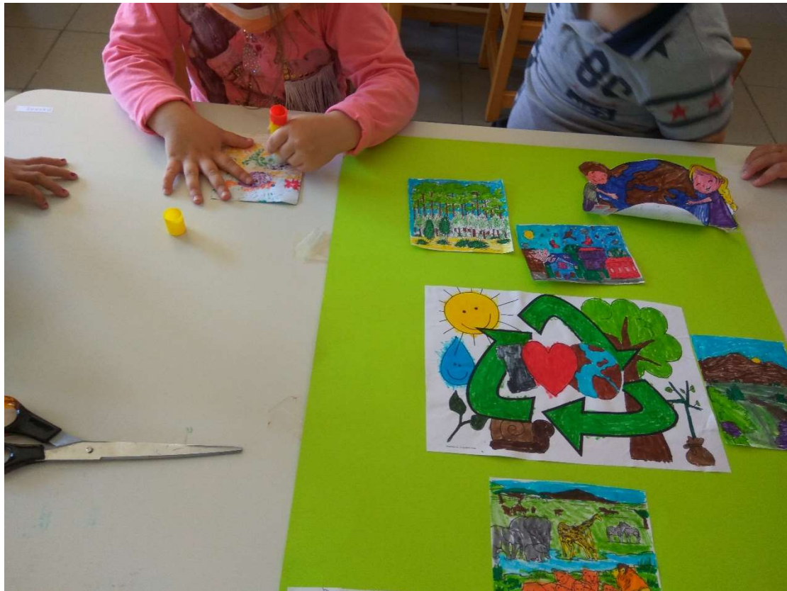
Εικόνα 10 Τα νήπια δημιουργούν Αφίσα με την τεχνική Κολλάζ για την Ανακύκλωση