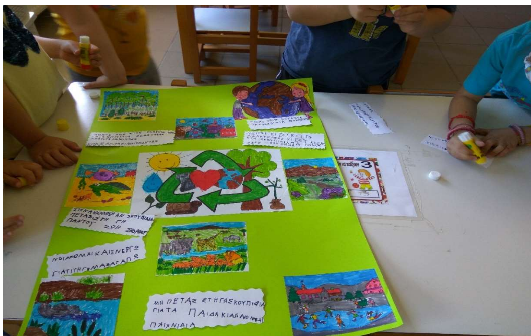
Εικόνα 11 Τα παιδιά έγραψαν και συνθήματα για την Αφίσα