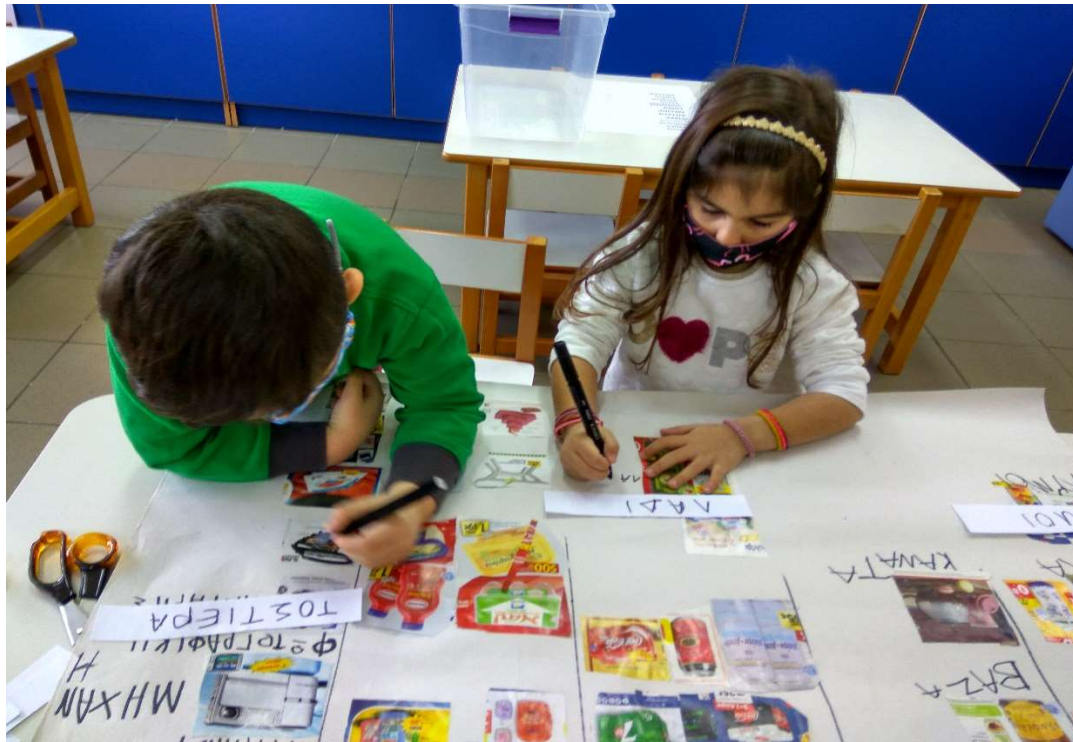
Εικόνα 1 Ομαδοποίηση ανακυκλώσιμων υλικών/Κατηγοριοποίηση