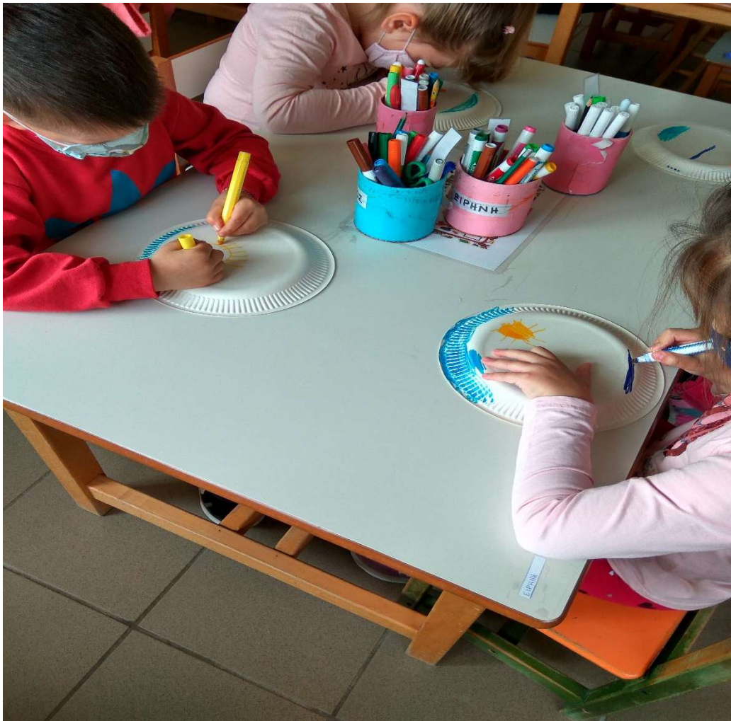
Εικόνα 5 Εικαστικά / Δημιουργία κάδρων από χάρτινα πιάτα