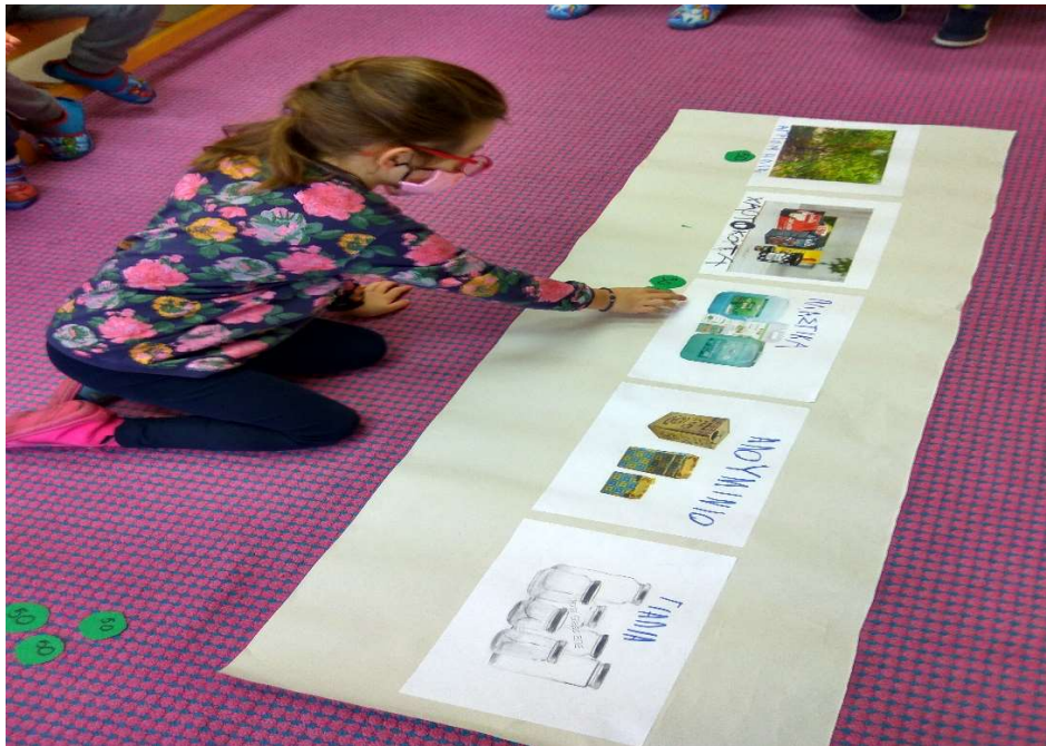
Εικόνα 3 Αποσύνθεση φυσικών και μη φυσικών υλικών