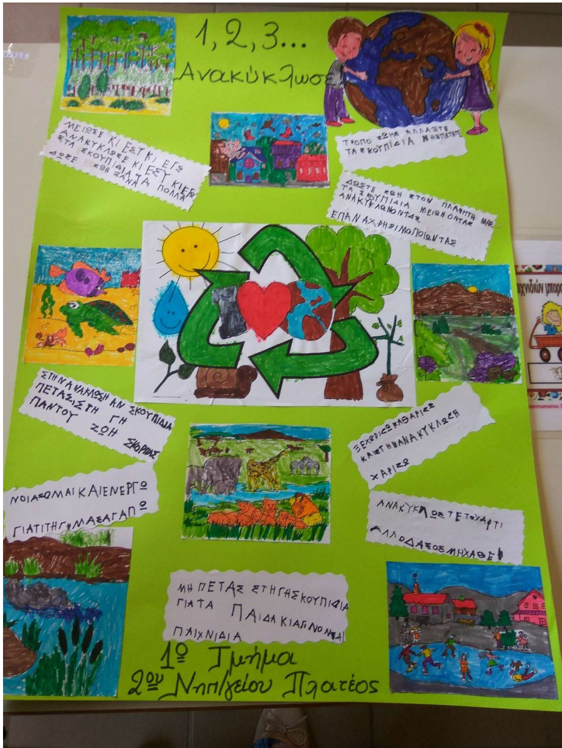
Εικόνα 12 Το τελικό προϊόν: Η Αφίσα μας για την Ανακύκλωση