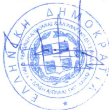
Δρ ΚΛΑΔΗΣ ΝΙΚΟΛΑΟΣ