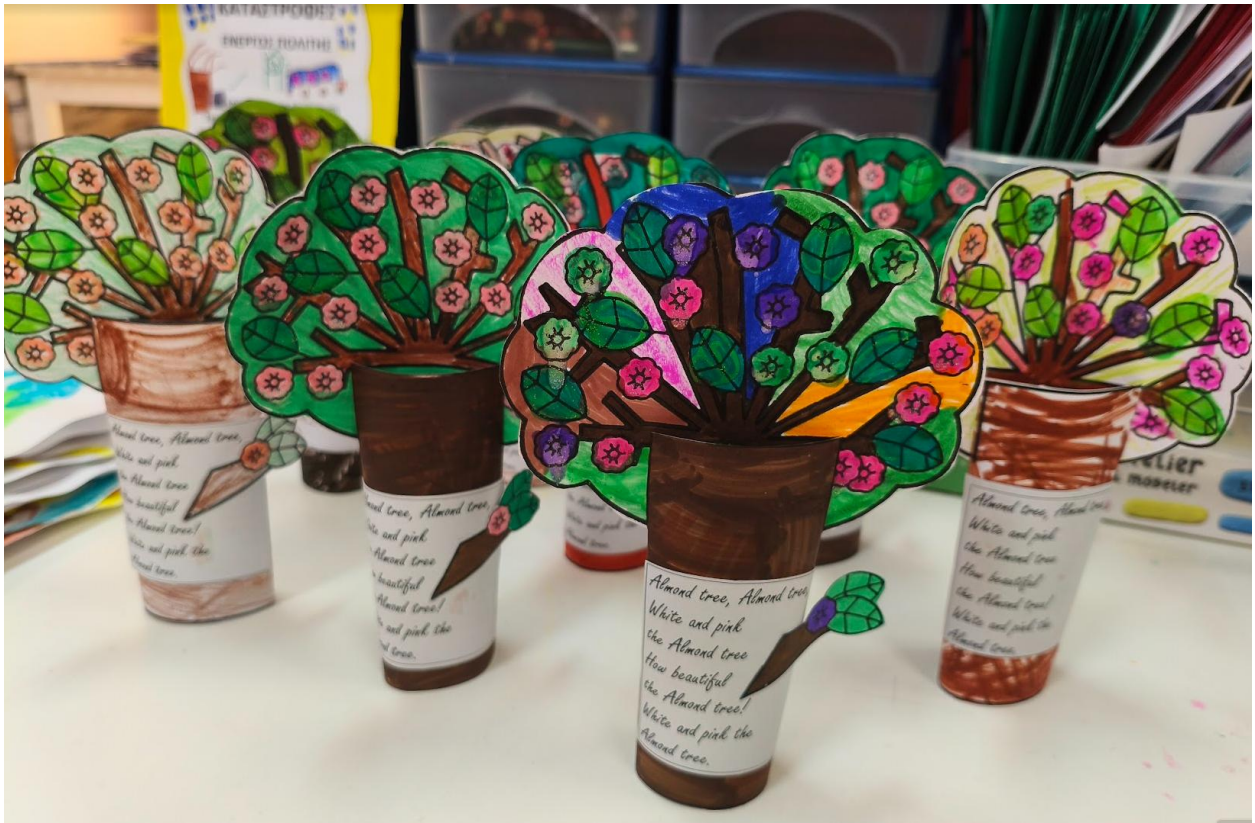
Κατασκευούλα στο μάθημα των αγγλικών για την 'άνοιξη!!