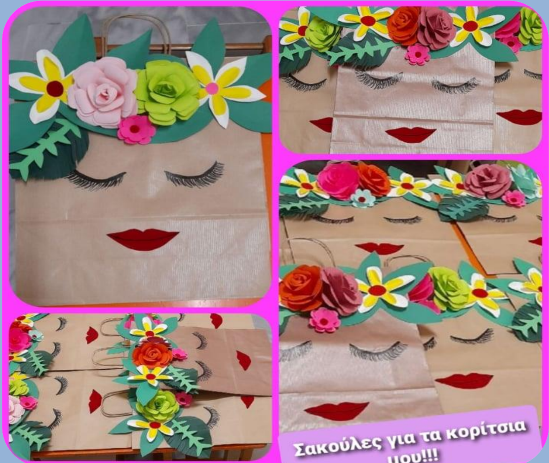
Σακούλες για τα κορίτσια μου!!!