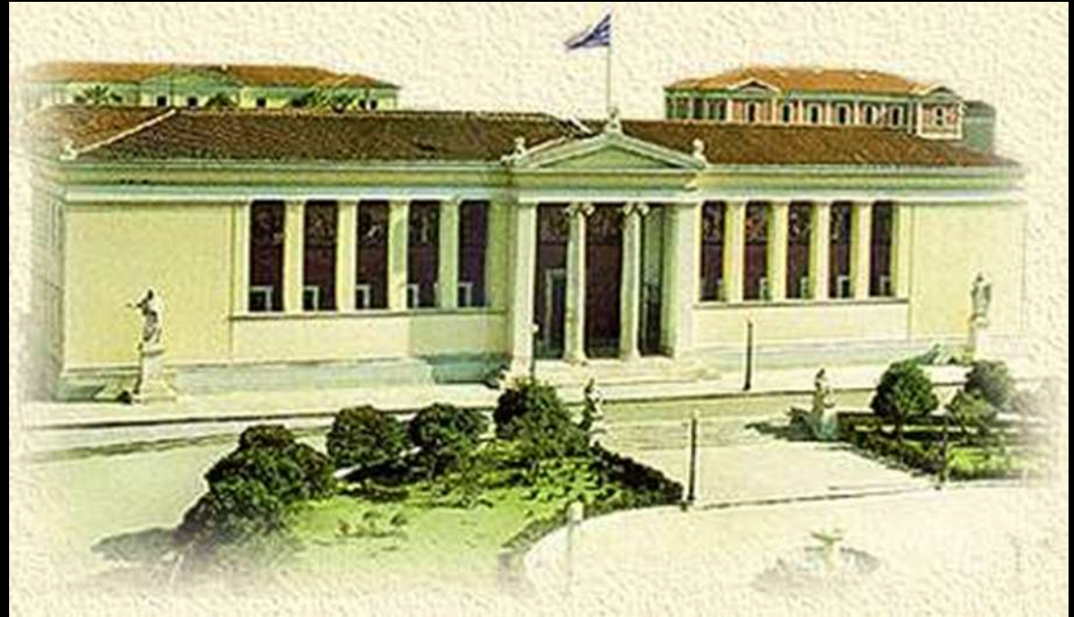
το Οθωνικό Πανεπιστήμιο (μετέπειτα Εθνικό Καποδιστριακό).