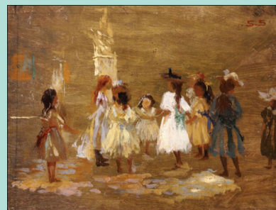
Συμεών Σαββίδης, Γύρω γύρω όλοι . Εθνική Πινακοθήκη.

Η συμμετοχή των μαθητών στη σχολική ζωή είναι απαραίτητη. Οι διάφορες μορφές οργάνωσης της μαθητικής ζωής αποσκοπούν να βοηθήσουν τους μαθητές: