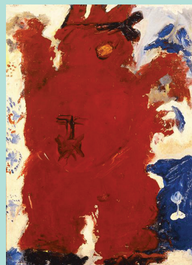
Αλέκος Φασιανός, Η κόκκινη φιγούρα , Εθνική Πινακοθήκη.

α) Οι μαθητικές κοινότητες (Μ.Κ.) , καθαρά παιδαγωγικός θεσμός , που συνδέεται άρρηκτα με την εκπαιδευτική διαδικασία, αποτελούν τον χώρο για την ανάπτυξη της μαθητικής πρωτοβουλίας μέσα στο σχολείο, αποτελούν κύτταρο δημοκρατικής ζωής , στο πλαίσιο των οποίων, με τον διάλογο και τη συμμετογή οι μαθητές με πνεύμα συνεργασίας, ασκούνται στη δημοκρατική διαδικασία και στη