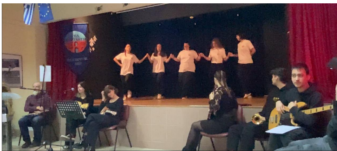
Συρτός Σάμου «Πλατανιώτικο Νερό»