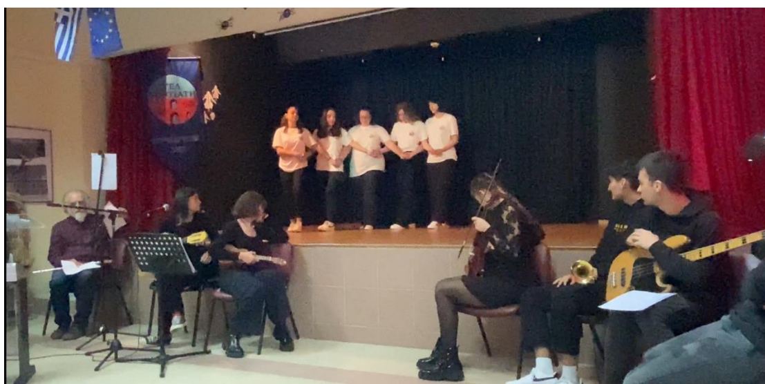
Τράτα Μεγάρων «Είσαι Άγγελος Ωραίος»