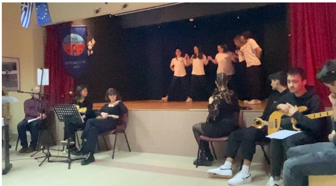
Συρτός Νησιώτικος «Μες του Αιγαίου τα νησιά»