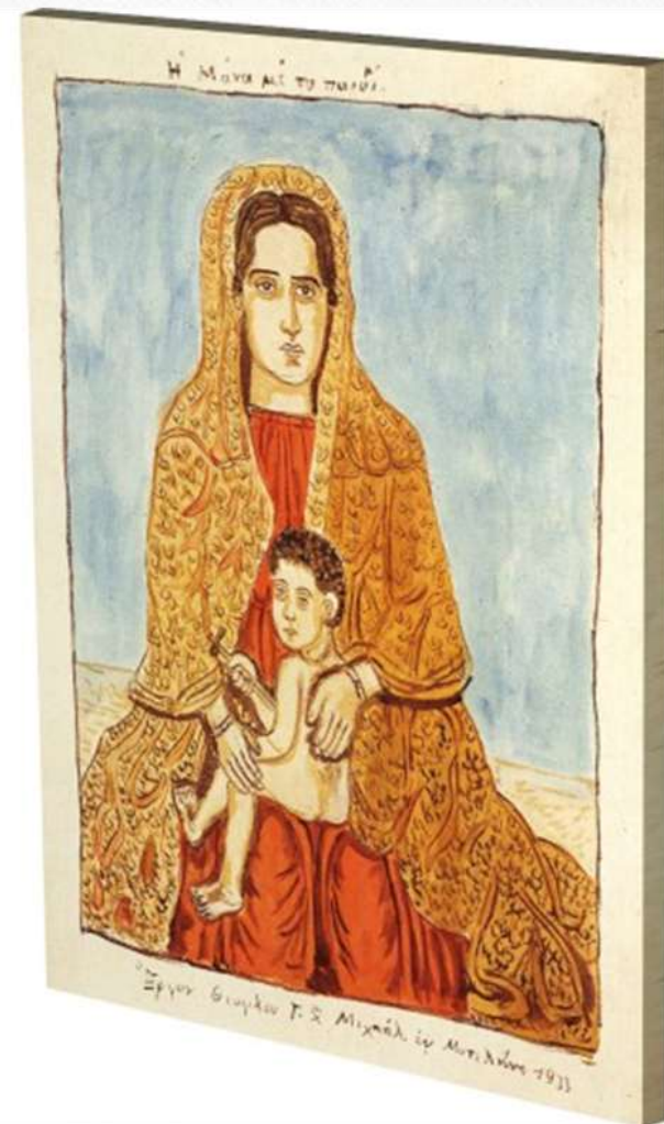
Η μάνα με το παιδί