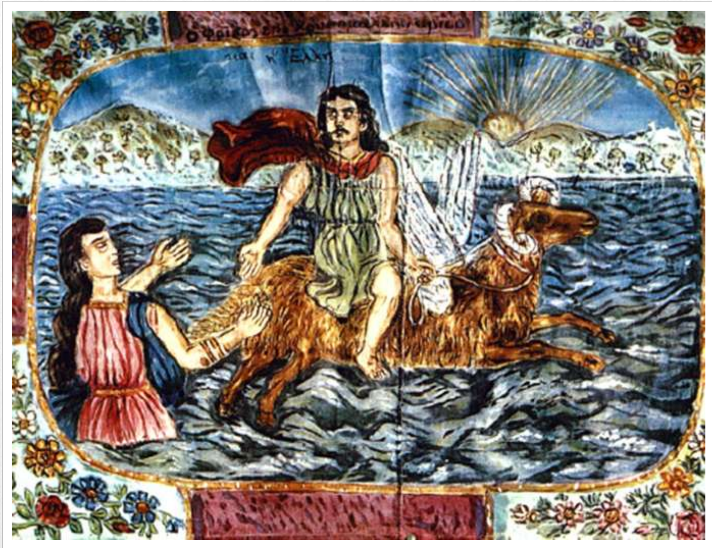
Ο Φρίξος και η Έλλη