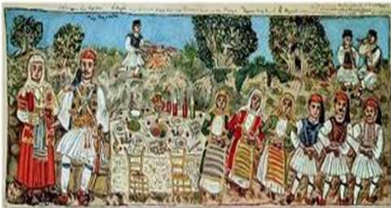
Ο χορός των Μεγάρων