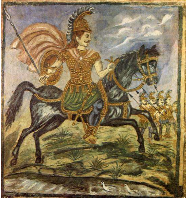
Ο Μέγας Αλέξανδρος