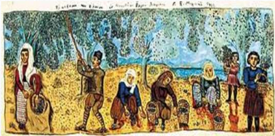
Το μάζεμα των ελαιών