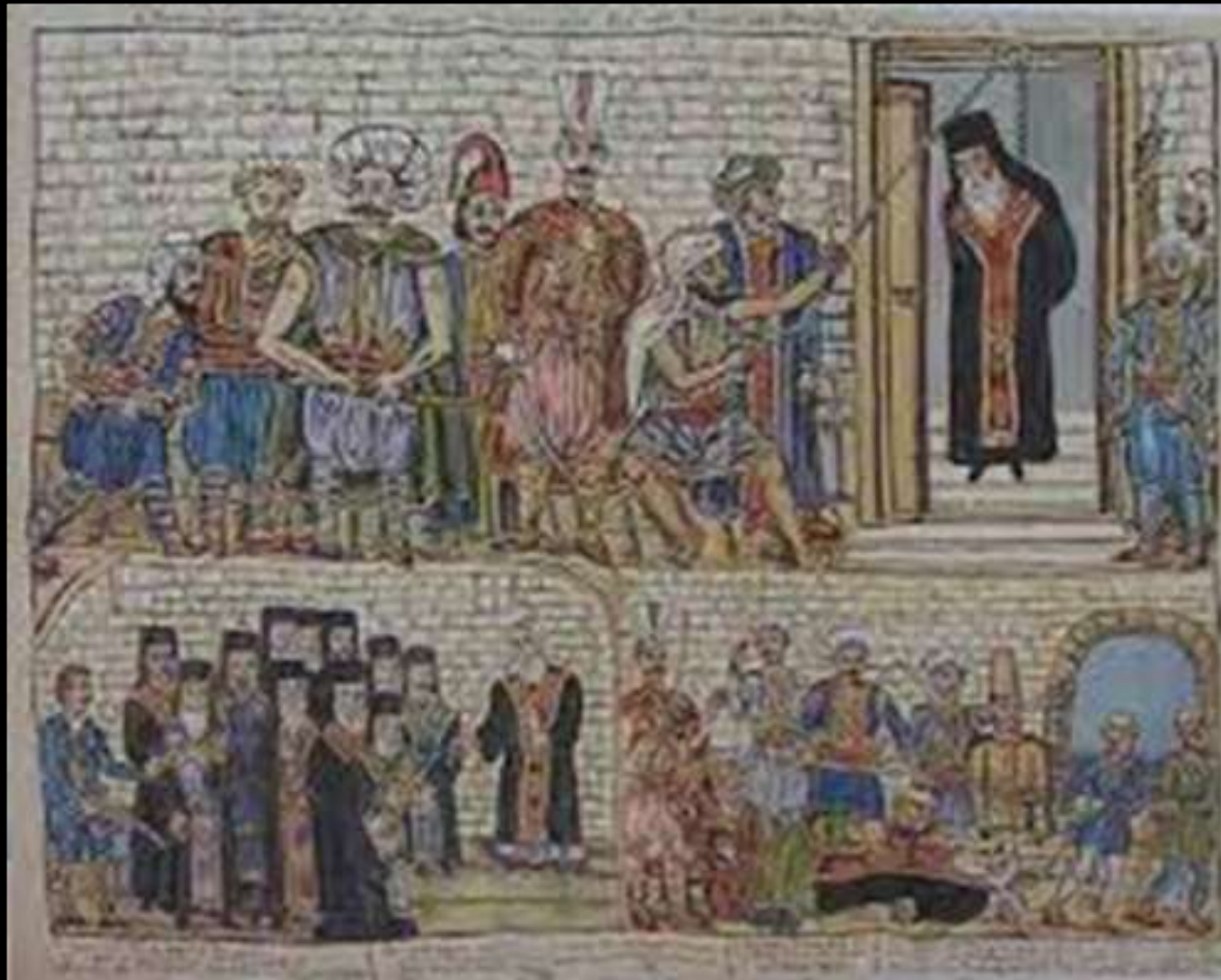
Ο απαγχονισμός του Πατριάρχη Γρηγορίου Ε΄