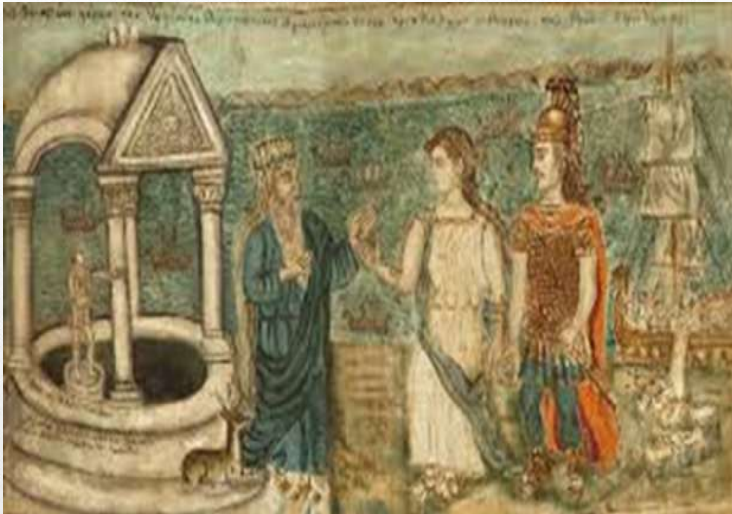
Οδυσσεύς φέρων την Ιφιγένειαν εις τον ιερέαν Κάλχα του θεού Απόλλωνος