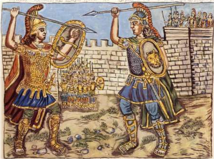
Η μονομαχία του Αχιλλέα