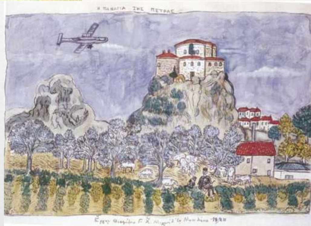
Η Παναγία της Πέτρας