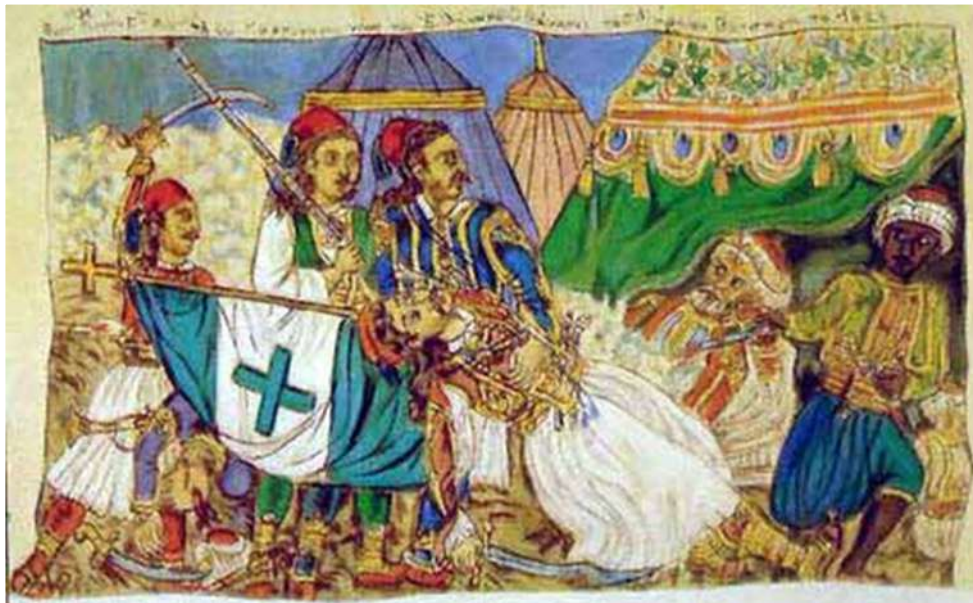
Θάνατος Μάρκου Μπότσαρη