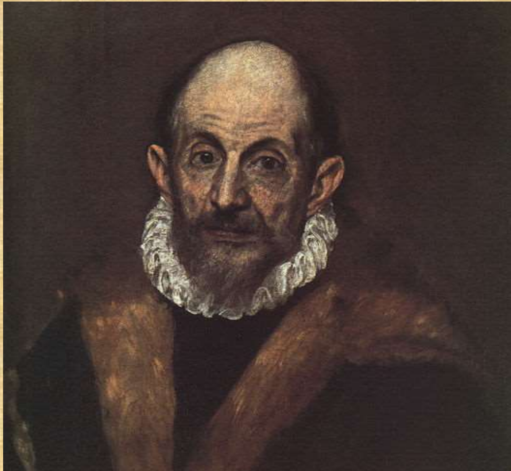
Αυτοπροσωπογραφία (π. 1590-1600), Νέα Υόρκη, Μητροπολιτικό Μουσείο