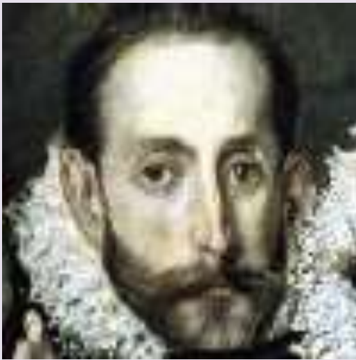
Ο ίδιος ο Ελ Γκρέκο