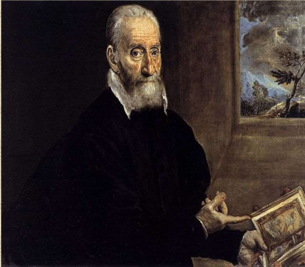
Προσωπογραφία του Τζούλιο Κλόβιο, Νάπολη, Μουσείο Καποντιμόντε