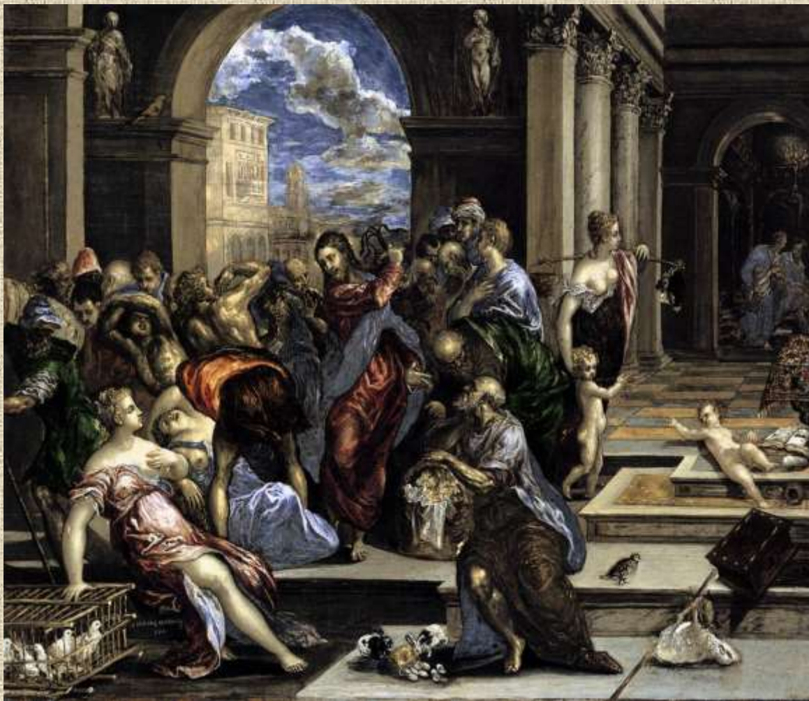
Εκδίωξη των εμπόρων από το ναό (1570-75), Ινστιτούτο Καλών Τεχνών Μινεάπολης