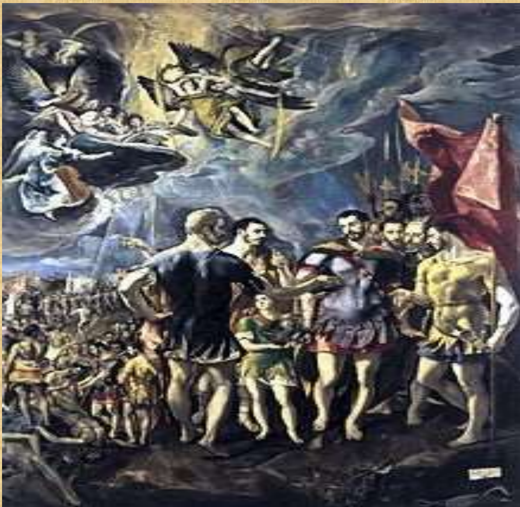
Το Μαρτύριο του Αγίου Μαυρίκιου (1580-82), Εσκοριάλ, Μοναστηριακή Εκκλησία Αγίου Λαυρεντίου