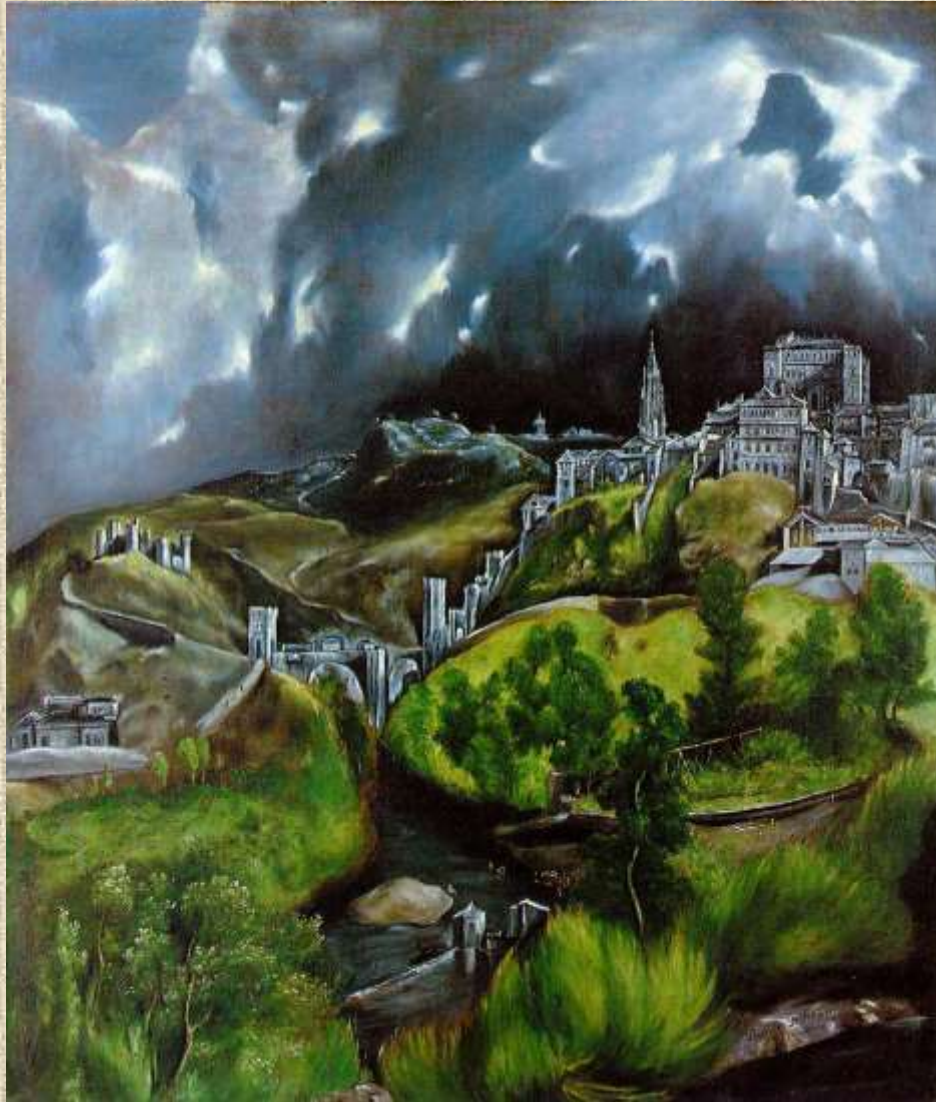
• Άποψη του Τολέδου (1595- 99), Μητροπολιτικό Μουσείο Νέας Υόρκης