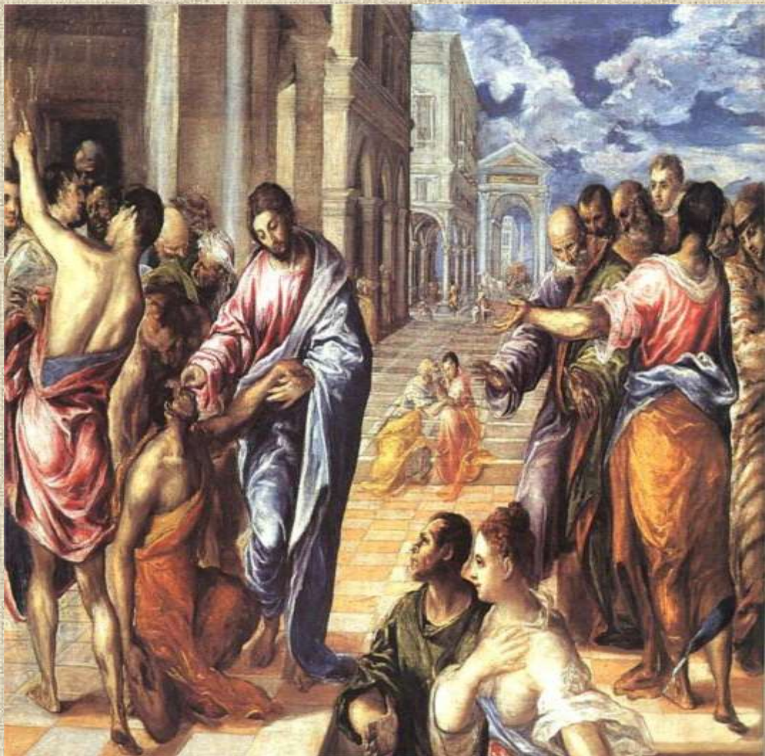
Θεραπεία του Τυφλού (περ. 1565,) Πινακοθήκη Δρέσδης