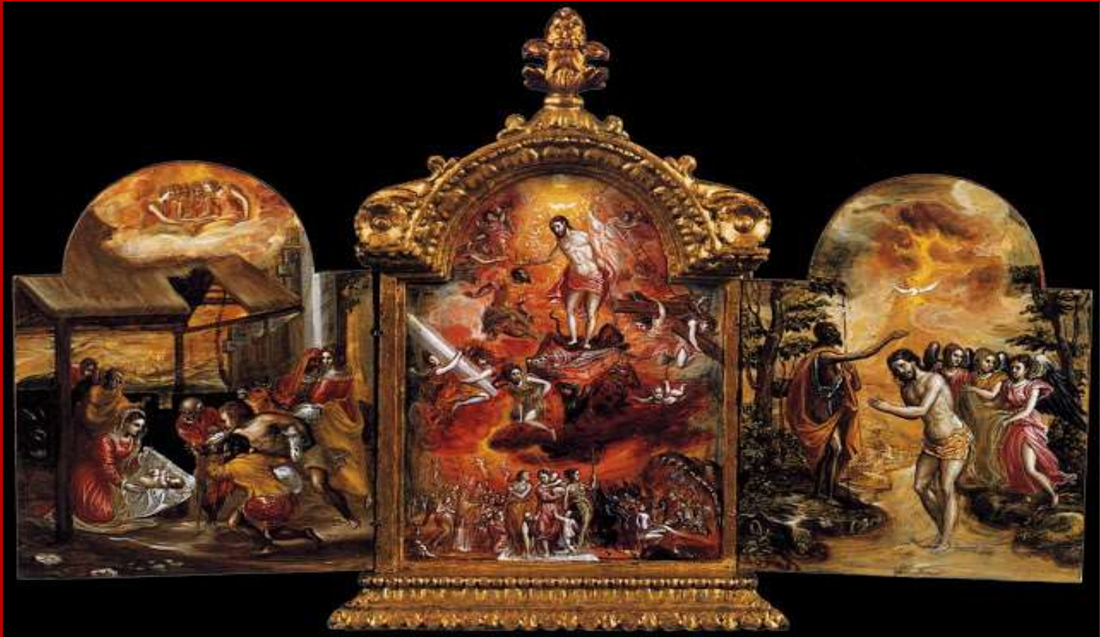
Το τρίπτυχο της Μοντένα (Galleria Estense)