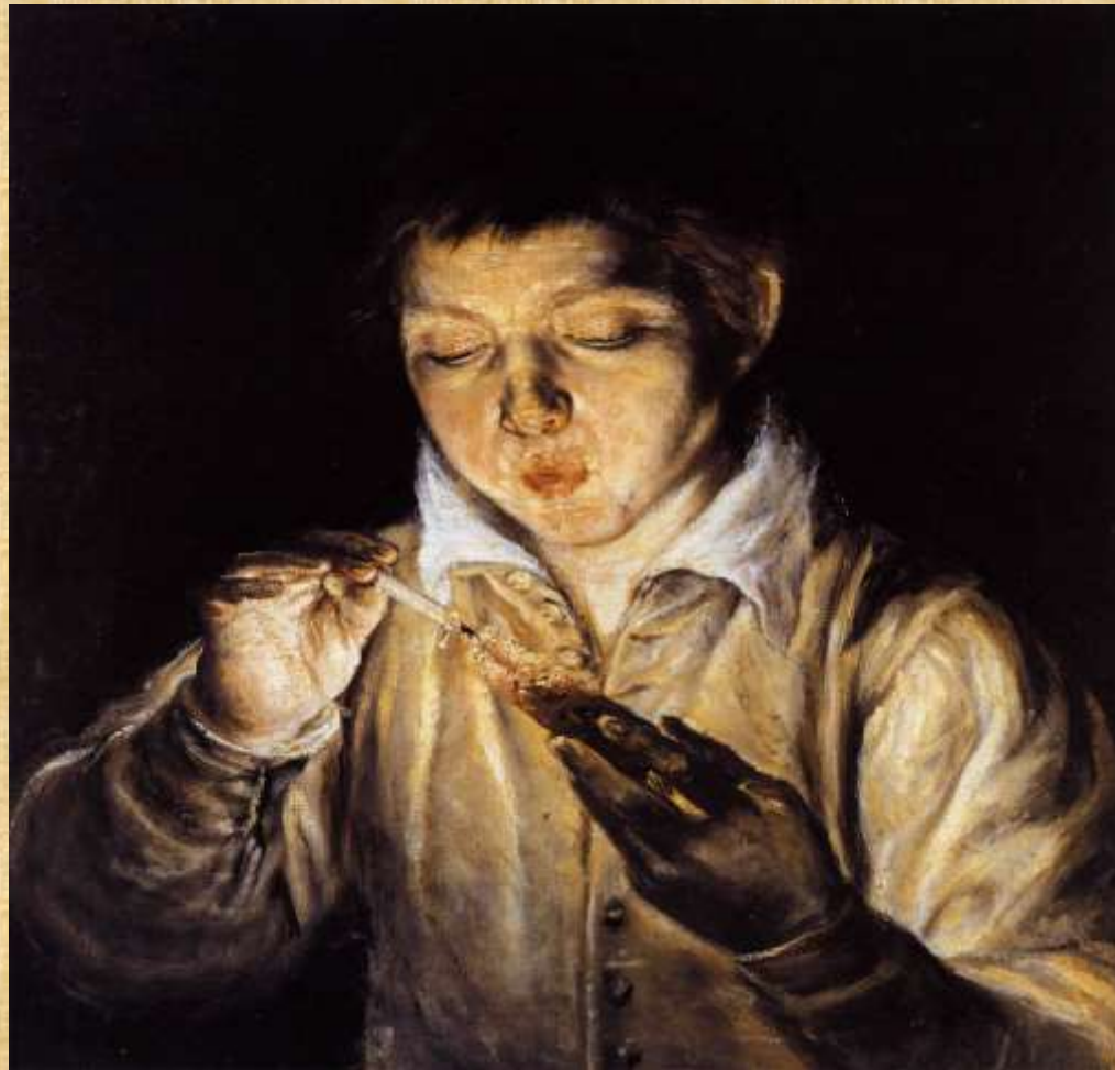
Αγόρι που ανάβει κερί, (π. 1570,) Μουσείο Καποντιμόντε