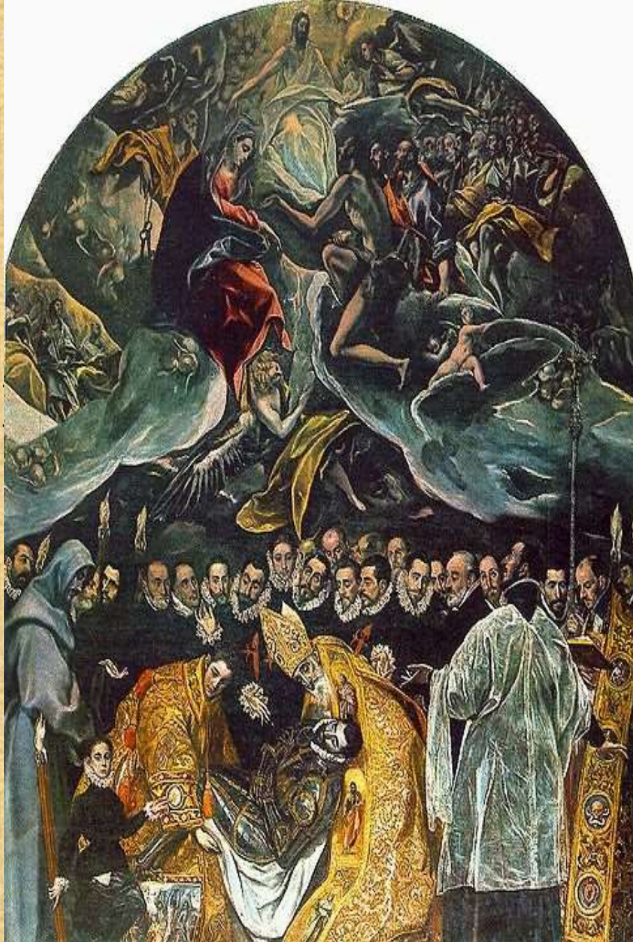
Ταφή του κόμη του Οργάνθ (1586-88), Τολέδο, Άγιος Θωμάς