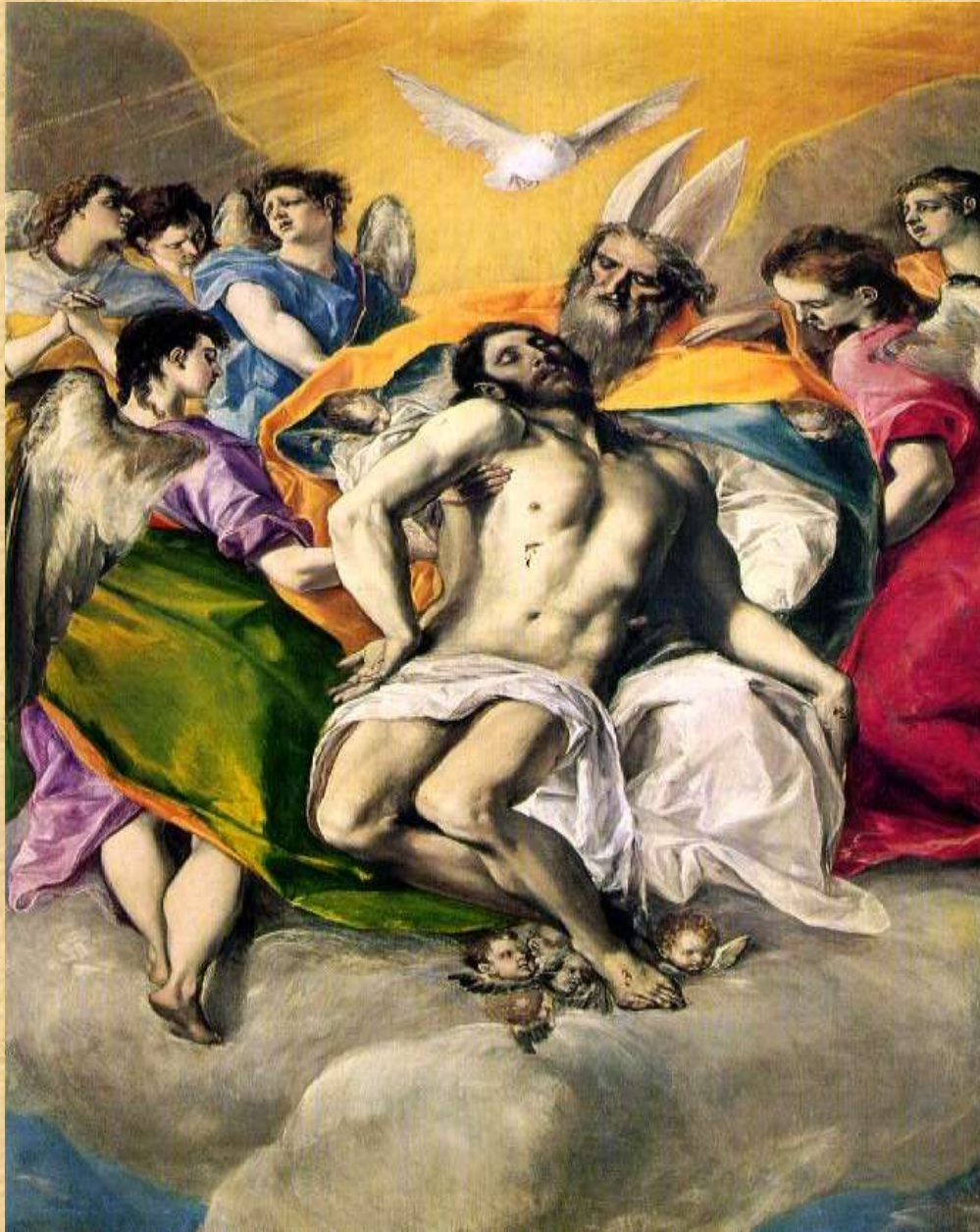
Αγία Τριάδα (1577-79), Μουσείο Πράδο