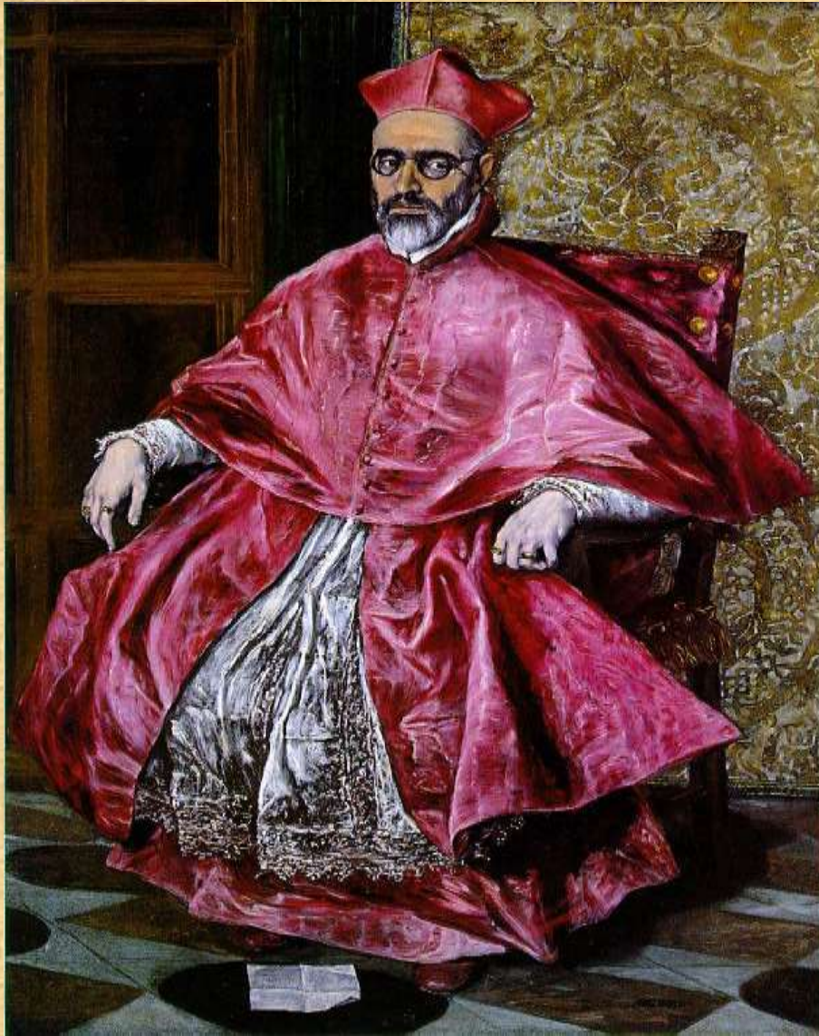
Προσωπογραφία του Καρδινάλιου (π. 1600), Μητροπολιτικό Μουσείο Νέας Υόρκης