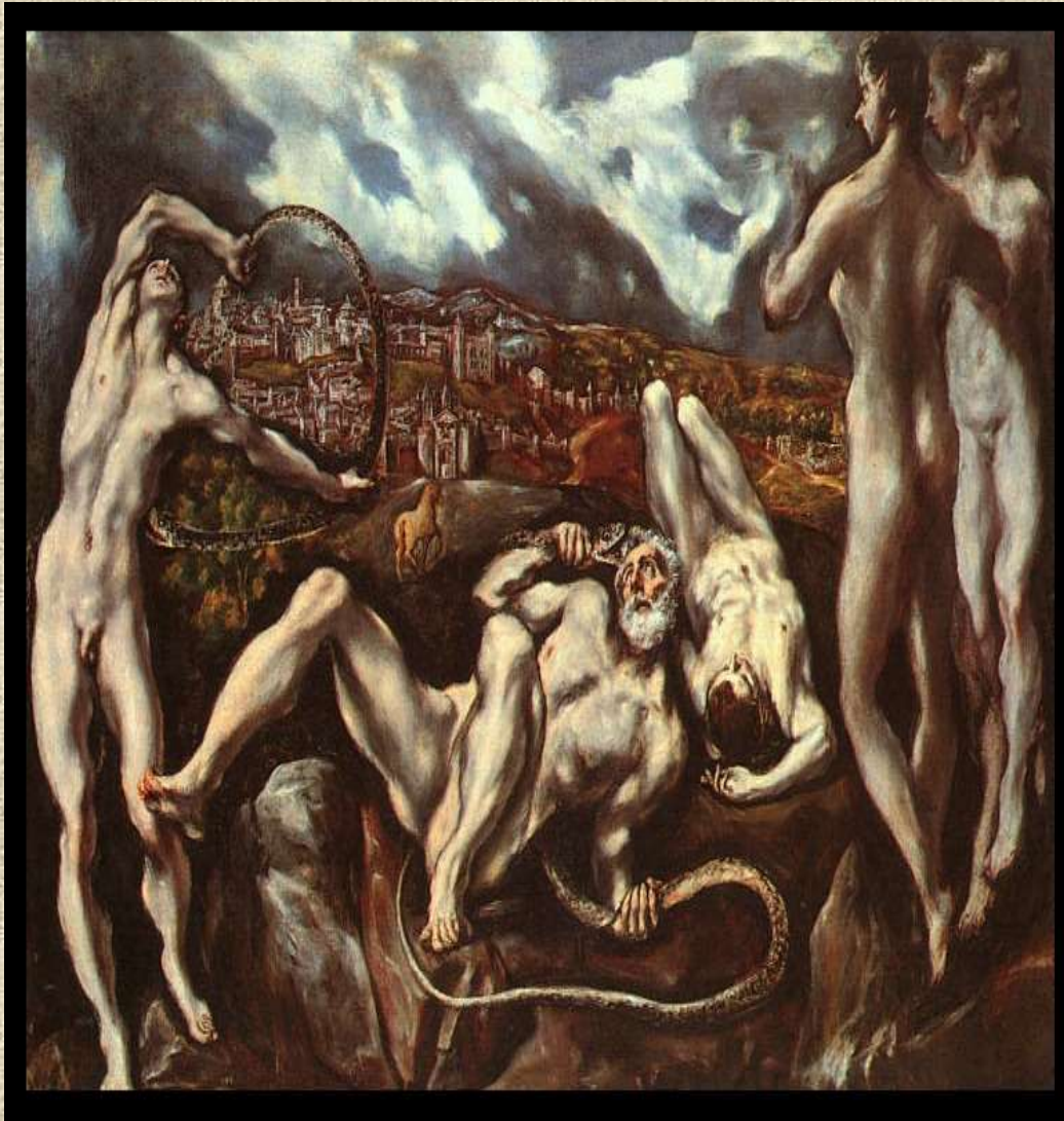
Λαοκόων, (1610-14), Εθνική Πινακοθήκη Ουάσιγκτον