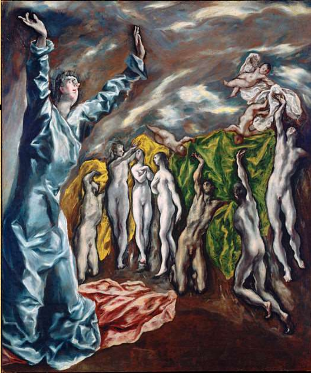
Η Πέμπτη Σφραγίδα της Αποκαλύψεως (1608-14), Νέα Υόρκη, Μητροπολιτικό Μουσείο.