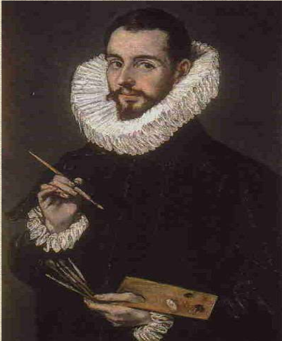
Προσωπογραφία του Χόρχε Μανουέλ Θεοτοκόπουλου, (1600), Σεβίλλη, Μουσείο Καλών Τεχνών