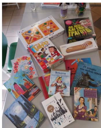
Η Κιβωτός του Κόσμου, Διμήνη