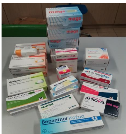
Κοινωνικό Φαρμακείο Μητρόπολης