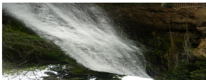
(Κόκκαλη Πολυξένη, Γ2).

από το νερό, που λέγεται «φρύδι της πόλης», με 11 καταρράκτες. Οι δύο είναι μεγάλοι, ορατοί και επισκέψιμοι. Το πάρκο των καταρρακτών προσφέρει ανοιχτούς χώρους αναψυχής και συνάντησης για όλους. Κάθε βράδυ οι εντυπωσιακοί καταρράκτες φωταγωγούνται και προσφέρουν μοναδικές εικόνες.