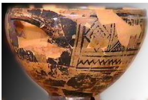
Κύπελλο του Νέστορος 740 π.Χ.

Στην επιγραφή διαβάζουμε: «Είμαι το γλυκόπιτο ποτήρι του Νέστορα. Όποιος πει από τούτο το ποτήρι, αυτόν αμέσως θα τον κυριέψει ο πόθος της μορφοστεφανωμένης Αφροδίτης.»