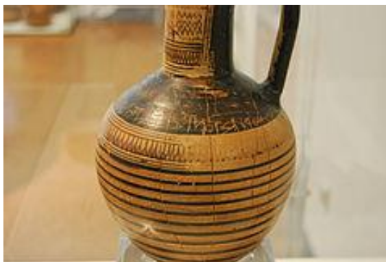
Οينوχόη του Διπύλου 740 π.Χ.

Είναι χαραγμένη πάνω σε οينوχόη, ύστερου γεωμετρικού ρυθμού, και βρέθηκε στην Αθήνα το 1871. Η επιγραφή λέει: «Όποιος από τους χορευτές χορεύει πιο ανάλαφρα θα πάρει το βραβείο.» Απ' αυτό συμπεραίνουμε ότι η οينوχόη θα ήταν έπαθλο ορχηστικού αγώνα.