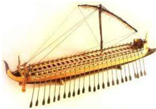
(τυπικό πλοίο της εποχής του Ομήρου, αναπαράσταση)