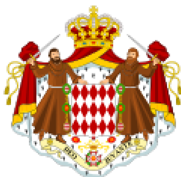
Το οικόσημο του Οίκου Γκριμάλντι

Γκριμάλντι, γνωστός και ως "ο Πονηρός", καταφέρνοντας να περάσει ως ένας Φραγκισκανός μοναχός που ζητάει άσυλο για τη νύχτα, καταφέρνει έτσι να μπει στο φρούριο για να μπορέσει να ανοίξει την πόρτα στους στρατιώτες του. Καταλαμβάνουν τότε το φρούριο. Από τότε, το κτίριο έγινε η έδρα των Γκριμάλντι. Αυτό το γεγονός έχει αποτυπωθεί στο άγαλμα του Φραγκίσκου Γκριμάλντι που βρίσκεται μπροστά από το παλάτι. Γι' αυτό τον λόγο, το οικόσημο του Οίκου Γκριμάλντι και του Πριγκιπάτου αναπαριστούν δύο μοναχούς που κρατούν από ένα σπαθί ο καθένας και οι δυο τους κρατάνε το έμβλημα του Μονακό.