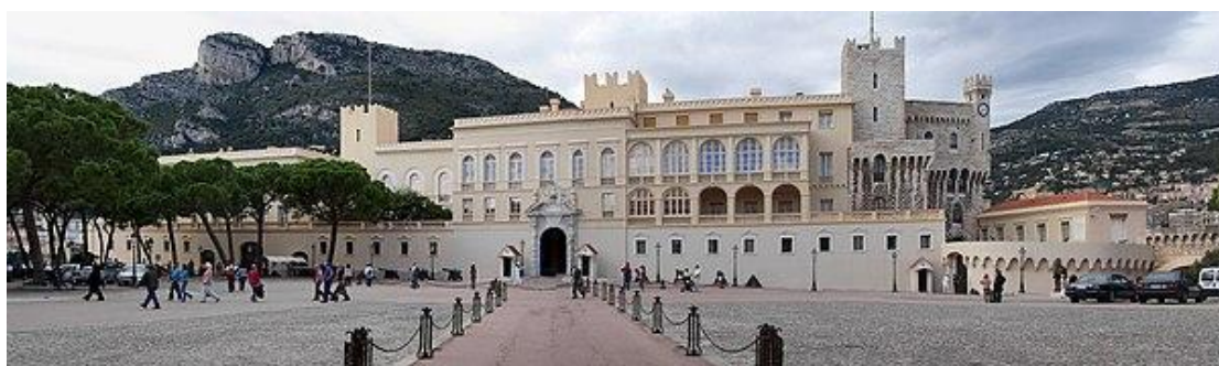
Το παλάτι του Μονακό σήμερα

Στη διάρκεια του 19ου και του 20ού αιώνα, το παλάτι και οι ένοικοί του γίνονται σύμβολα του «γκλάμουρ» (glamour) και του «τζετ σετ» (jet-set) που γίνονται συνώνυμα της πολυτέλειας του Μόντε Κάρλο και της Κυανής Ακτής. Αποτέλεσμα αυτής της θεατρικότητας είναι, το 1956, ο γάμος της Αμερικανίδας star του κινηματογράφου Γκρέις Κέλι με τον Ρενιέ Γ' του Μονακό και ο τίτλος της châteline που λαμβάνει μετά από αυτόν. Σήμερα, το παλάτι αποτελεί την κατοικία του Αλβέρτου Β', πριγκίπα του Μονακό.