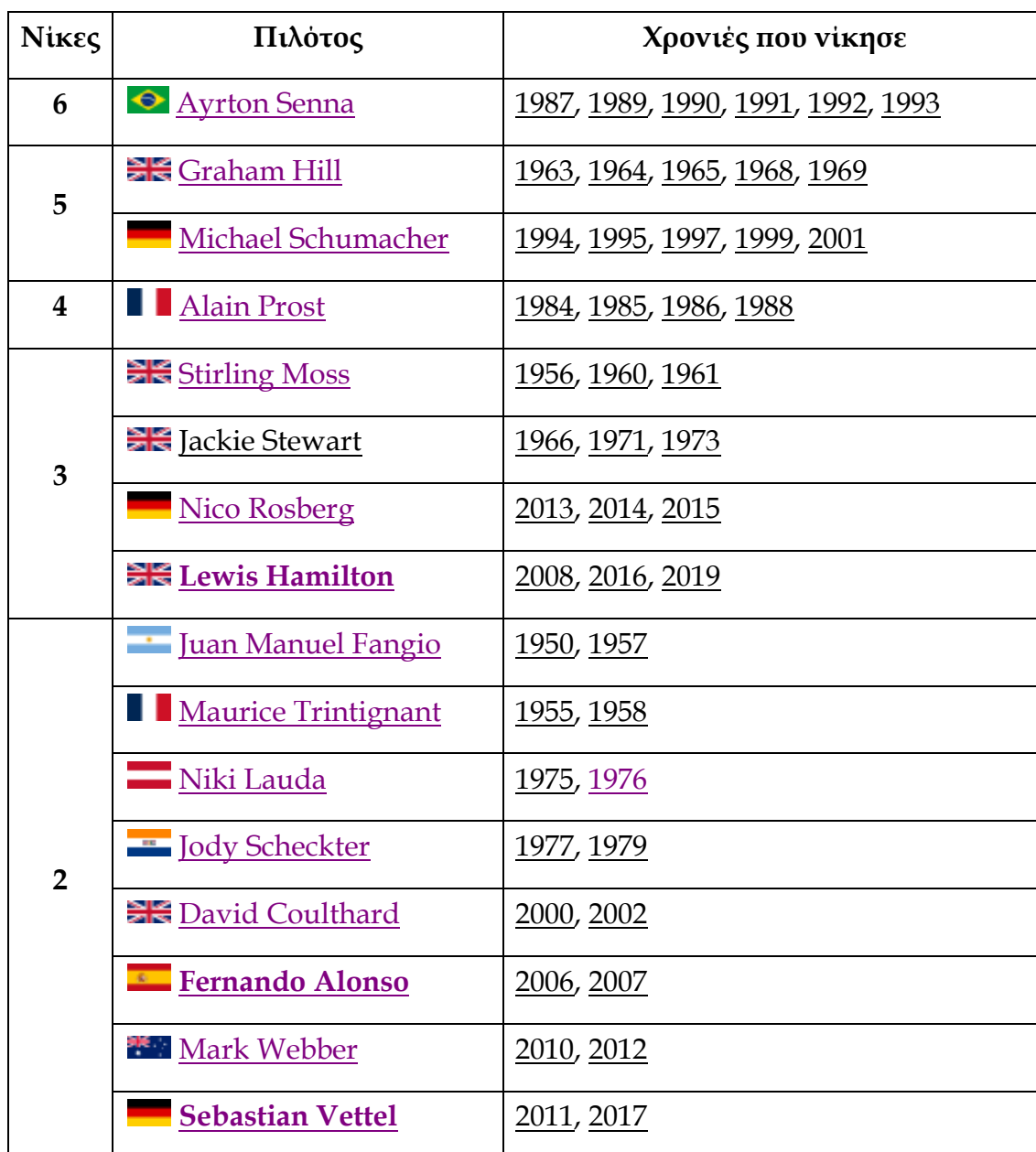
Πίνακας νικητών της F1