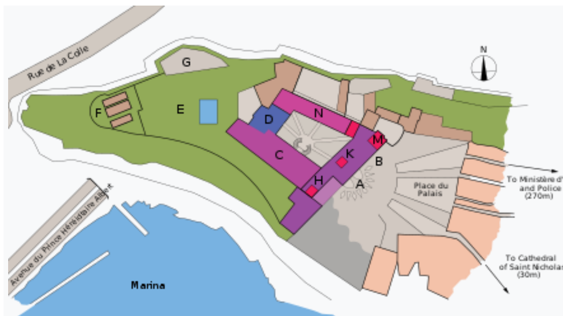
Χάρτης του σημερινού παλατιού

A: Είσοδος B: λότζια C: διοικητικά γραφεία του κράτους D: παρεκκλήσι