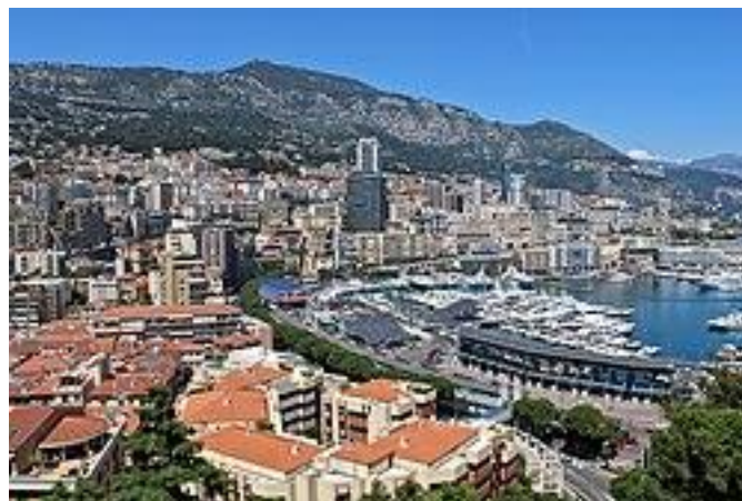
Πανοραμική άποψη του λιμανιού