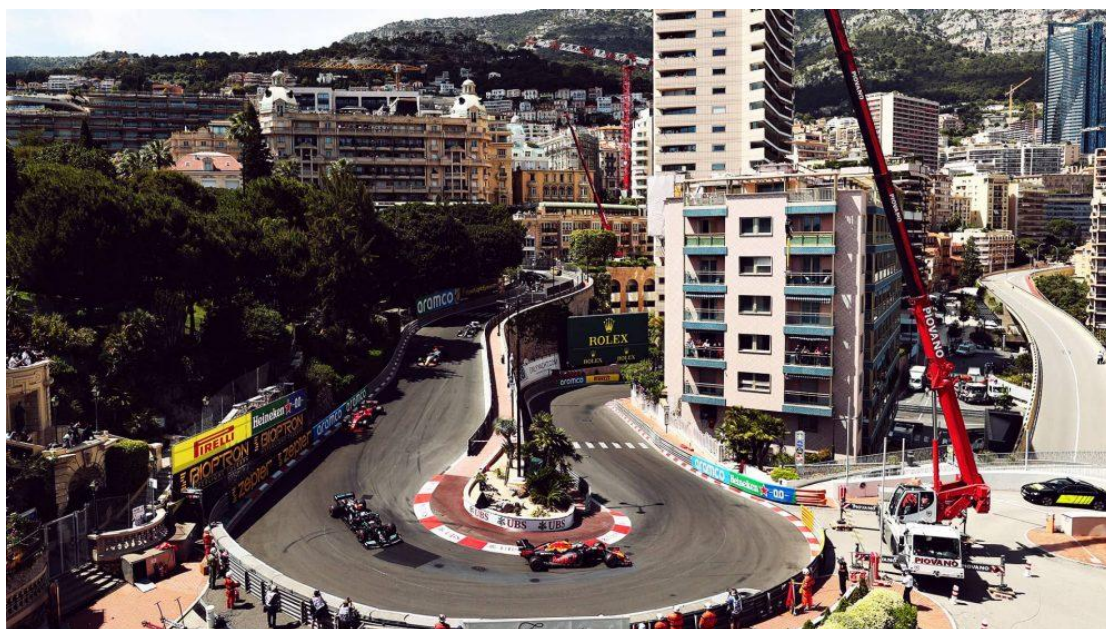
Monaco Grand Prix 2022 - F1 Race

Για την ιστορία το πρώτο γκραν πρι στο Μονακό διεξήχθη το 1929, που διοργανώθηκε από έναν καπνέμπορο, αφού έδωσε το «πράσινο» φως ο