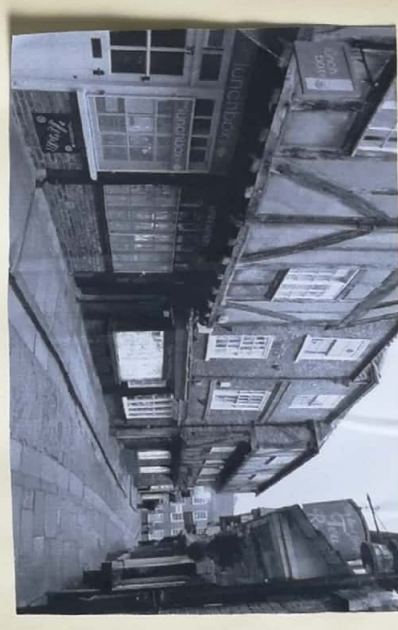
Εδση Project στην Κορναβίν (Κορναβίν Βορνακιστής)