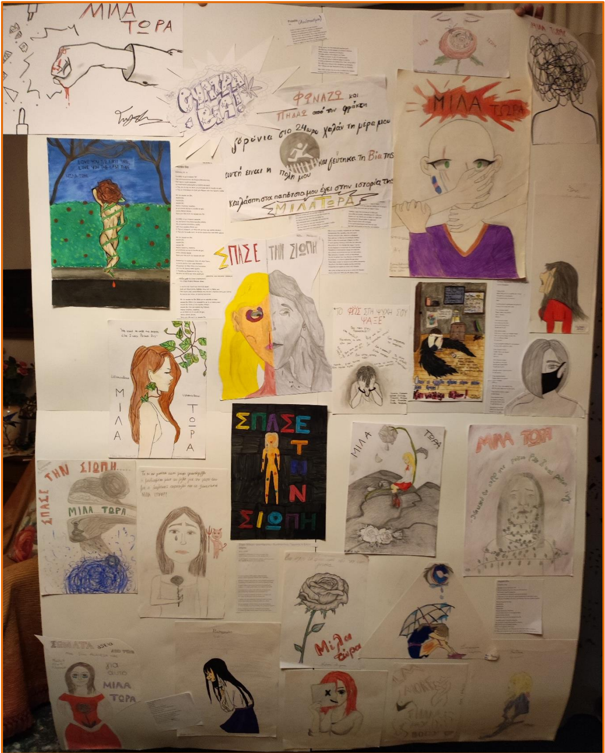
Αποτελεί μια εικαστική δημιουργία -σύνθεση διαστάσεων 140cmX200cm, η οποία εμπεριέχει επιμέρους ζωγραφικές δημιουργίες των μαθητών εμπνευσμένες από τους στίχους και τις εικόνες γνωστών τραγουδιών που αναφέρονται στις μορφές βίας της μοντέρνας κοινωνίας .