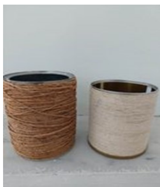
Μολυβοθήκες από ανακυκλώσιμα υλικά