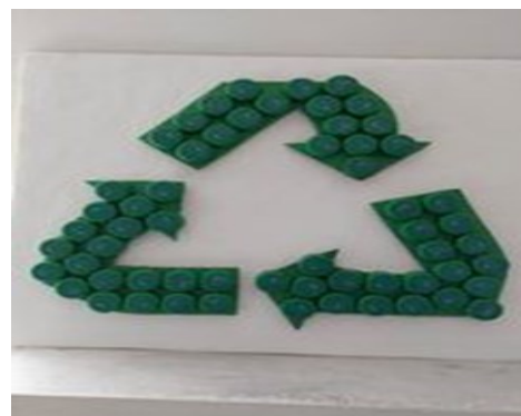
Αξιοποιώντας τα καπάκια από αναψυκτικά....