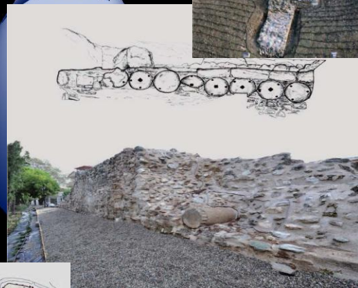
Το τείχος μετά τις εργασίες αποκατάστασης