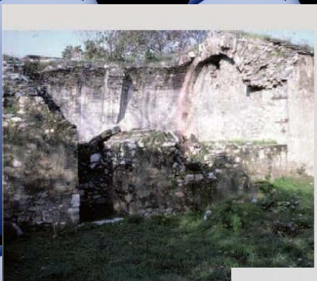
Το κτίριο της πυριτιδαποθήκης