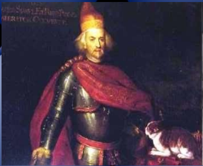
Ο Μοροζίνι και η γάτα του...

Το 1651, το κάστρο υπέστη την πρώτη του καταστροφή από τον ενετικό στρατό και συγκεκριμένα από την επίθεση του ναυάρχου Μοροζίνι , που ύστερα από την κατάκτηση της Αθήνας, αποφάσισε να επιτεθεί στο κάστρο του Βόλου. Βομβάρδισε με τα κανόνια του το κάστρο , δημιουργώντας τεράστιες ζημιές. Φόρτωσε το στόλο του με όσα τρόφιμα μπορούσε να βρει, έβαλε φωτιά σε ότι απέμεινε στις αποθήκες, τα τζαμιά και στα σπίτια. Πριν φύγει, γκρέμισε με τα κανόνια του στόλου όλο το κάστρο ως τα θεμέλια. Ο Πασάς που ήταν διοικητής του κάστρου και ο Αγάς προτίμησαν να το σκάσουν. Η μεγάλη αυτή νίκη ήταν μία σημαντική επιτυχία για τον Μοροζίνι. Οι Τούρκοι όμως κατά τη διάρκεια του τουρκοενετικού πολέμου και μέχρι το τέλος του 17ου αιώνα, κατάφεραν να επισκευάσουν και να ανακατασκευάσουν ξανά το κάστρο, το οποίο ήταν κατεστραμμένο ως τα θεμέλια και να κτίσουν πάλι το τζαμί.