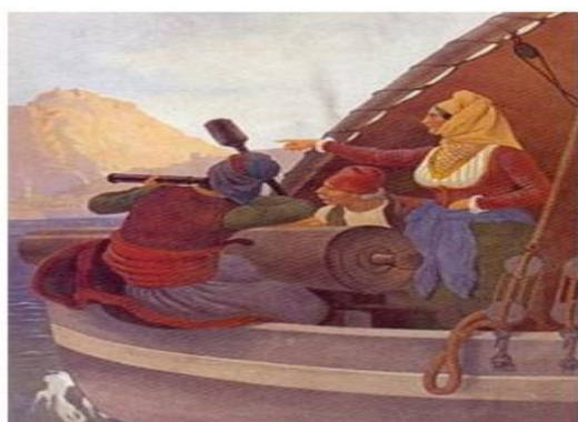
Η Μπουμπουλίνα στο πλοίο «Αγαμέμνων», πίνακας του Γερμανού ζωγράφου Peter von Hess

Όταν ξεκίνησε η ελληνική επανάσταση, είχε σχηματίσει δικό της εκστρατευτικό σώμα από Σπετσιώτες , τους οποίους αποκαλούσε «γενναία μου παλικάρια». Είχε αναλάβει να αρματώνει, να συντηρεί και να πληρώνει τον στρατό αυτό μόνη της όπως έκανε και με τα πλοία της και τα πληρώματά τους, κάτι που συνεχίστηκε επί σειρά ετών και την έκανε να ξοδέψει πολλά χρήματα για να καταφέρει να περικυκλώσει τα τουρκικά οχυρά, το Ναύπλιο και την Τρίπολη . Έτσι τα δύο πρώτα χρόνια της επανάστασης είχε ξοδέψει όλη της την περιουσία.