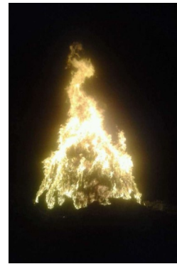
Το κάψιμο του «Ιούδα»

«Χιλιάδες κάλυκες από «οβίδες» πέφτουν στη Σάμο»