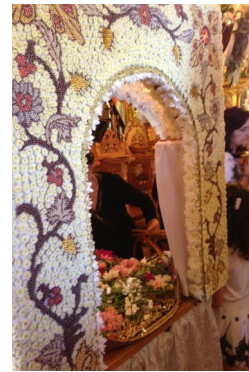
Ένας επιτάφιος διακοσμημένος με καρφίτσες και πέρλες

«Οι δεκάδες πιστοί φροντίζουν να φέρουν τα άνθη και τις πέρλες για τον στολισμό του Επιταφίου»