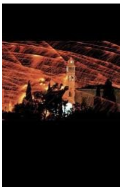
Ο νικητής αναδεικνύεται την ημέρα του Πάσχα.