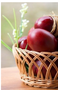
Τα κόκκινα αβγά δε λείπουν από κανένα σπίτι!

«Το αβγό, κατά τη παράδοση, συμβολίζει τον τάφο του Χριστού που ήταν ερμητικά κλειστός»