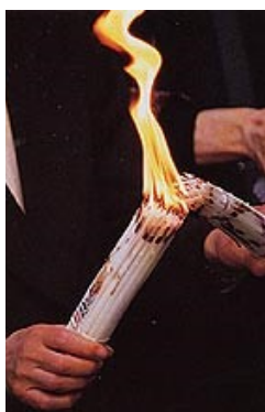
Το Άγιο Φως

«Το Άγιο Φως συμβολίζει τη νίκη του Χριστού και της ζωής απέναντι στον θάνατο»