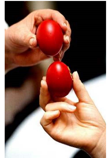
Ποιος θα κερδίσει φέτος στο τσουγκρίσμα των αυγών;

Αναπολώντας όλα όσα κά- ναμε τις περασμένες χρο- νιές, ελπίζουμε ότι το επό-