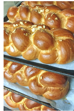
Τσορέκια: τα αγαπημένα μικρών και μεγάλων