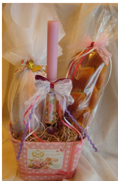
Λαμπάδα, τσουρέκι, αβγό: το κλασικό τρίπτυχο δώρου νονών