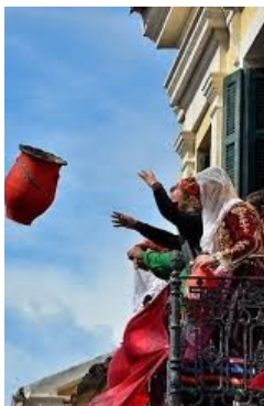
Το σπάσιμο των «Μπόπηδων» αναπαριστά την οργή για την προδοσία του Ιούδα.