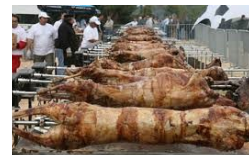
Το σούβλισμα του οβελία