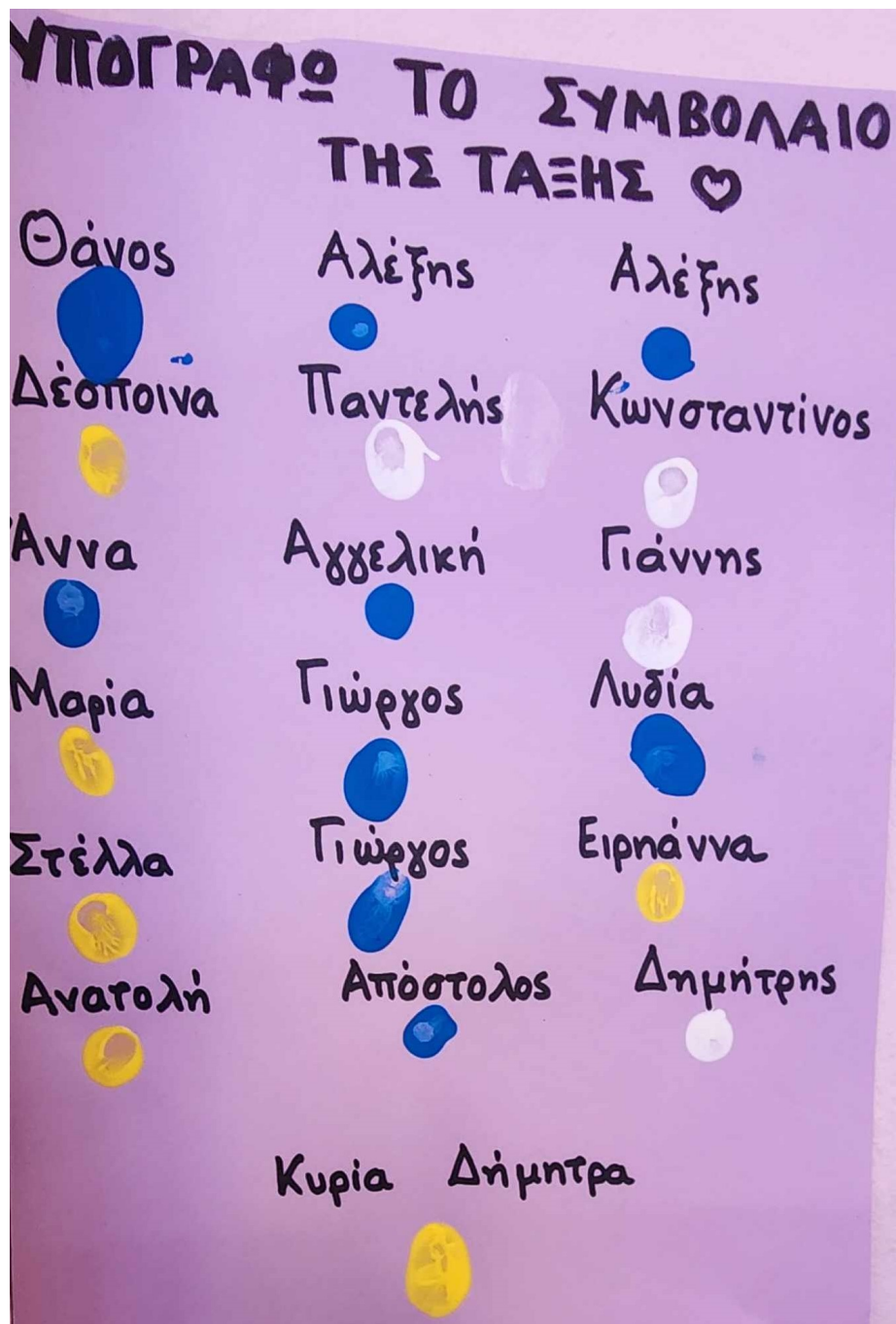
Εικόνα 3 Β1