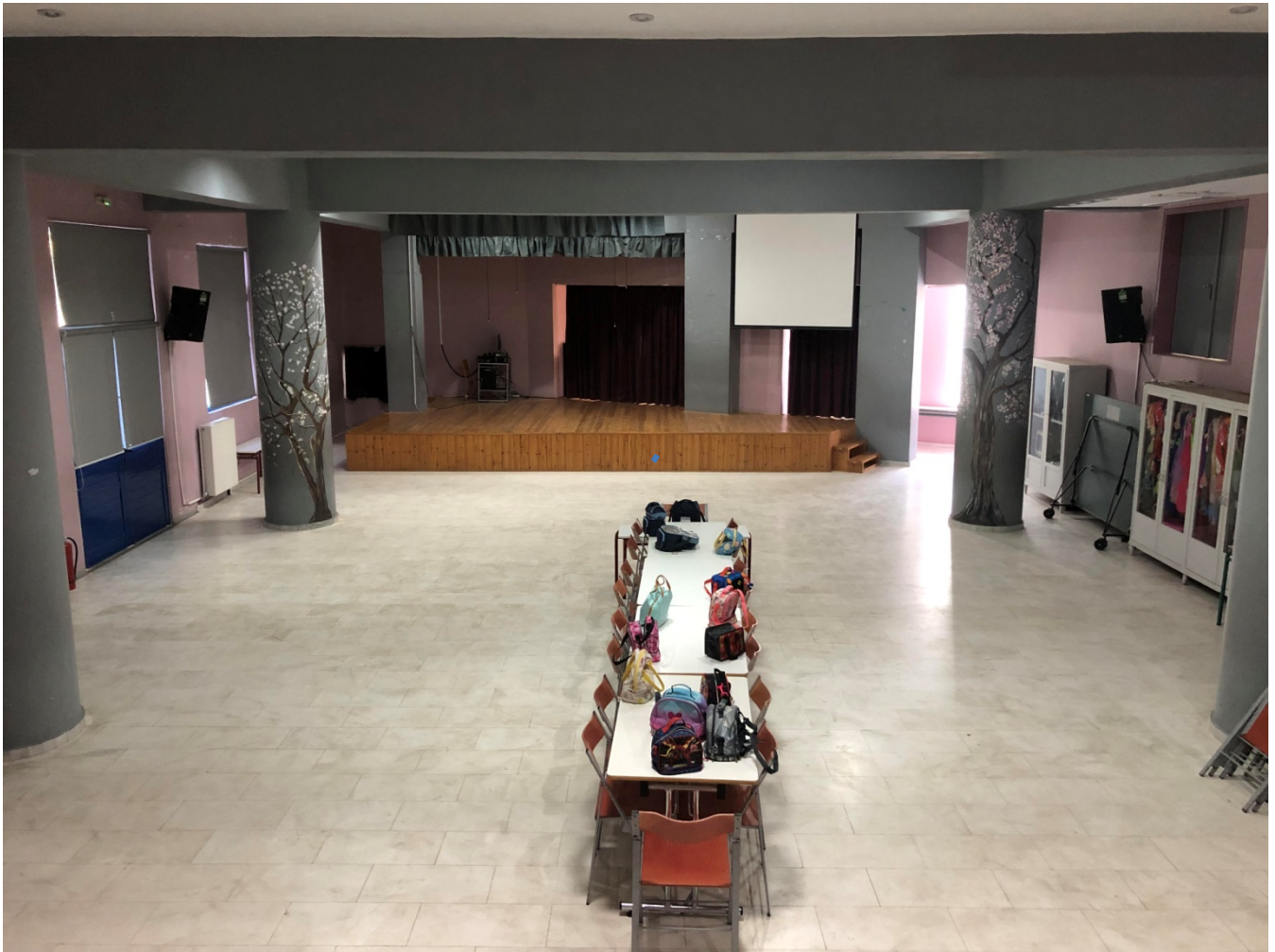
Εικόνα 2 Εσωτερικός χώρος συγκέντρωσης μαθητών