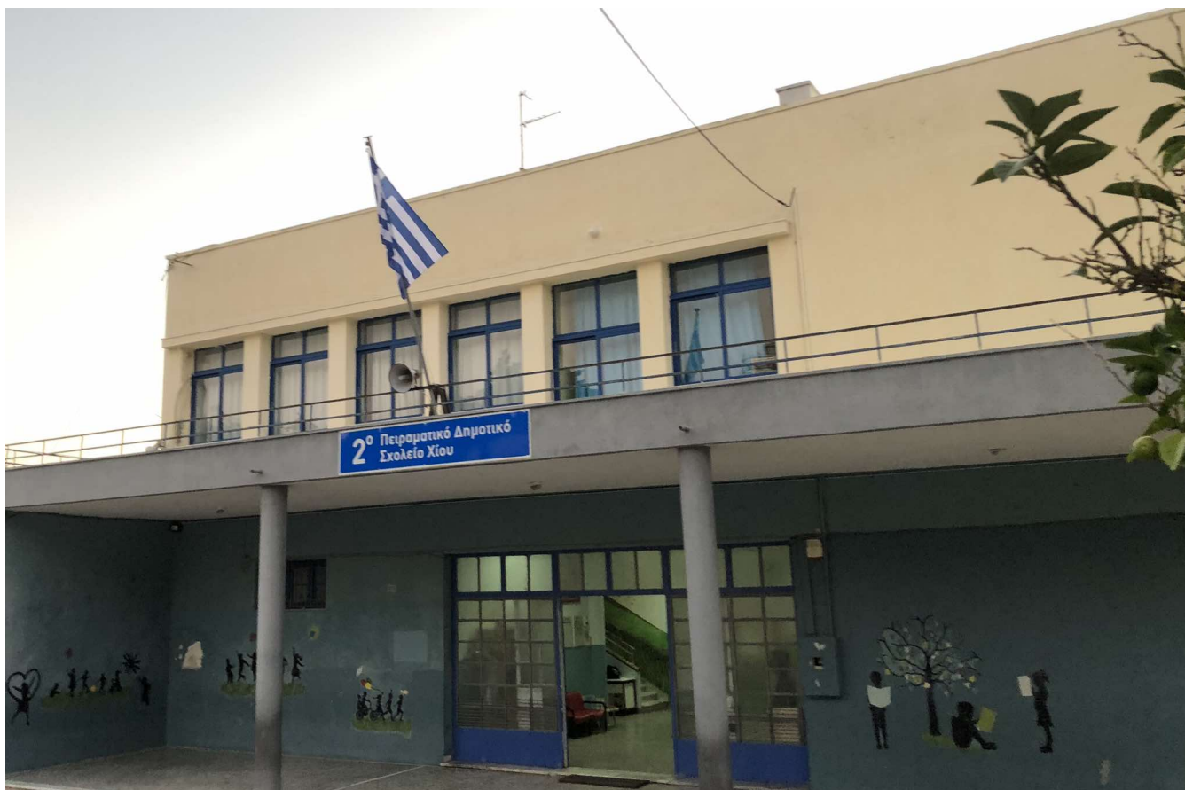
Εικόνα 1 Το σχολείο μας