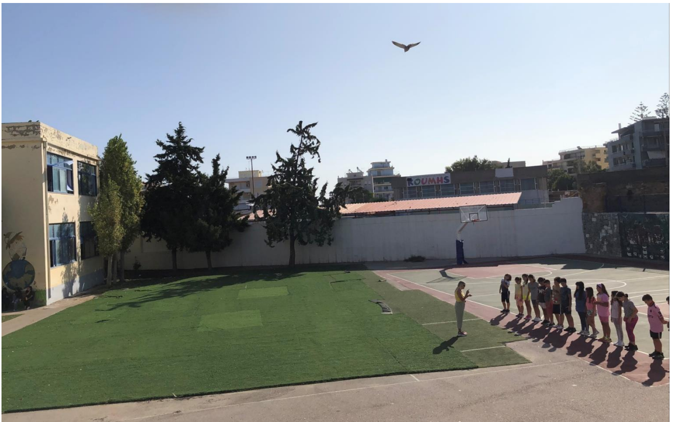
Εικόνα 2 : Χώρος συγκέντρωσης στον εξωτερικό χώρο του σχολείου