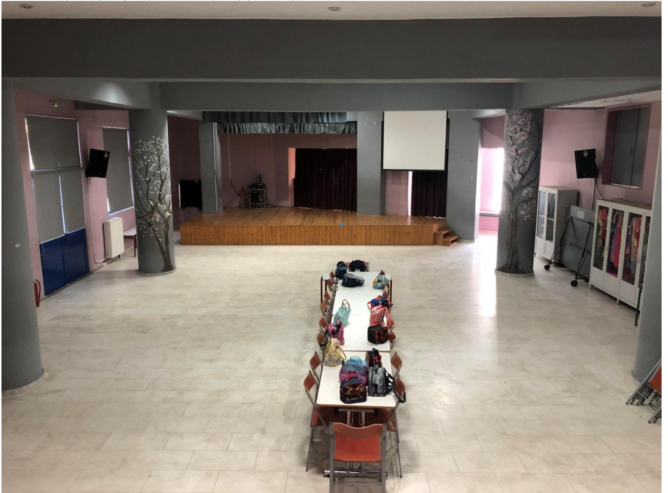
Εικόνα 2 Εσωτερικός χώρος συγκέντρωσης μαθητών