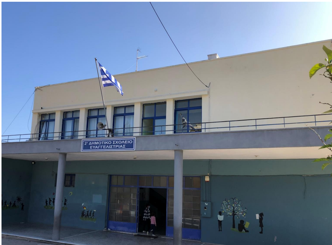
Εικόνα 1 Το σχολείο μας