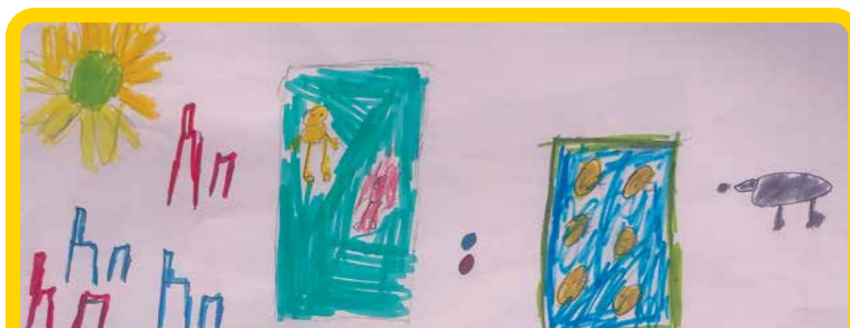
και κρεβάτια για χελώνες στο Πάρκο