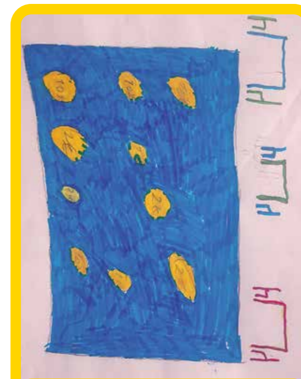
και χρυσά νομίσματα στο Κανάλι