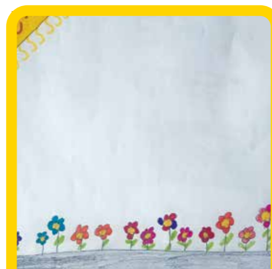
και λουλούδια από εξωτικές χώρες