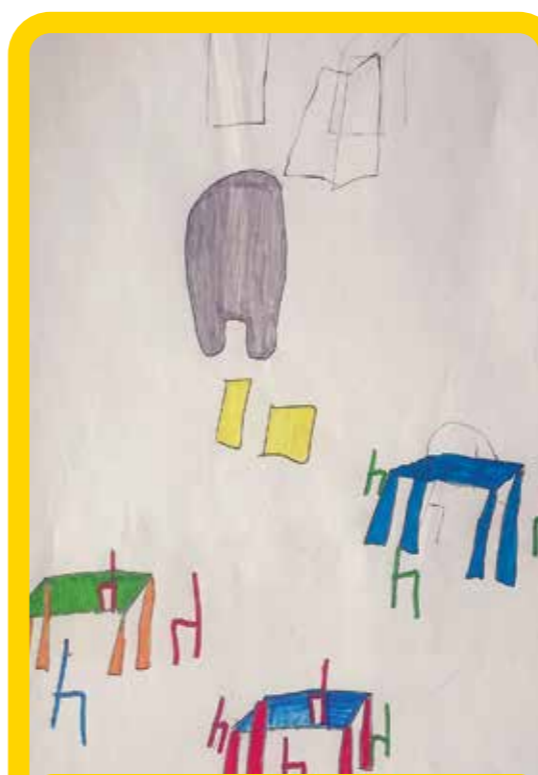
και ιπτάμενες καρέκλες στην Αγορά