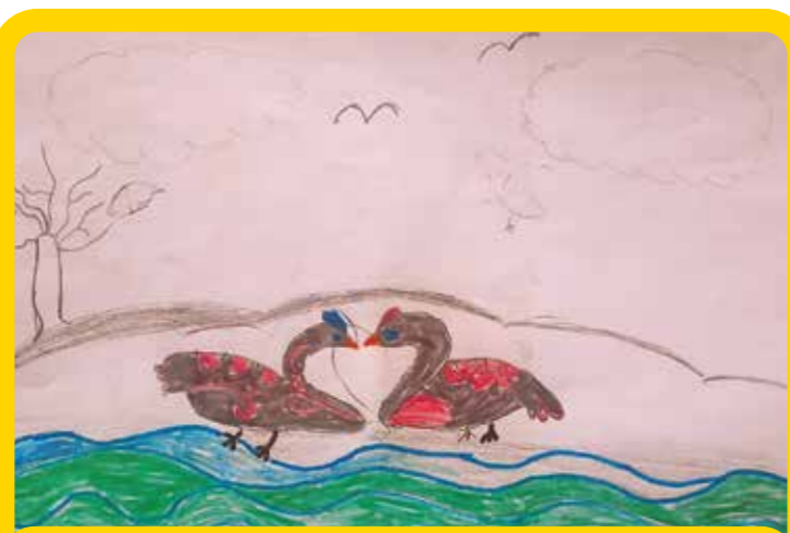
Αν έρθεις στο ΚΠΙΣΝ θα δεις μια λίμνη με κύκνους που χορεύουν τη λίμνη των κύκνων