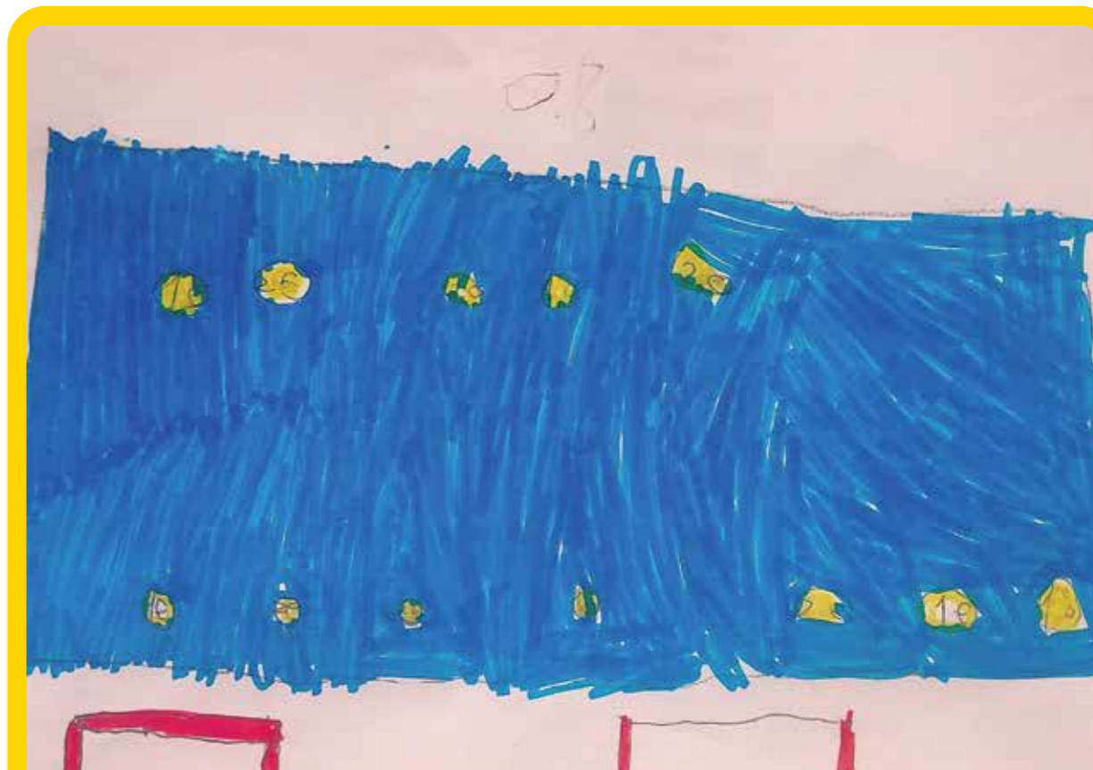
κι άλλα χρυσά νομίσματα...