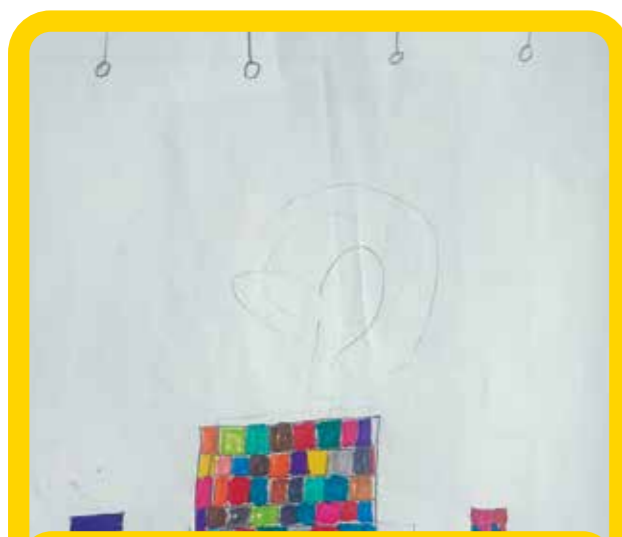
και πολύχρωμα βιβλία