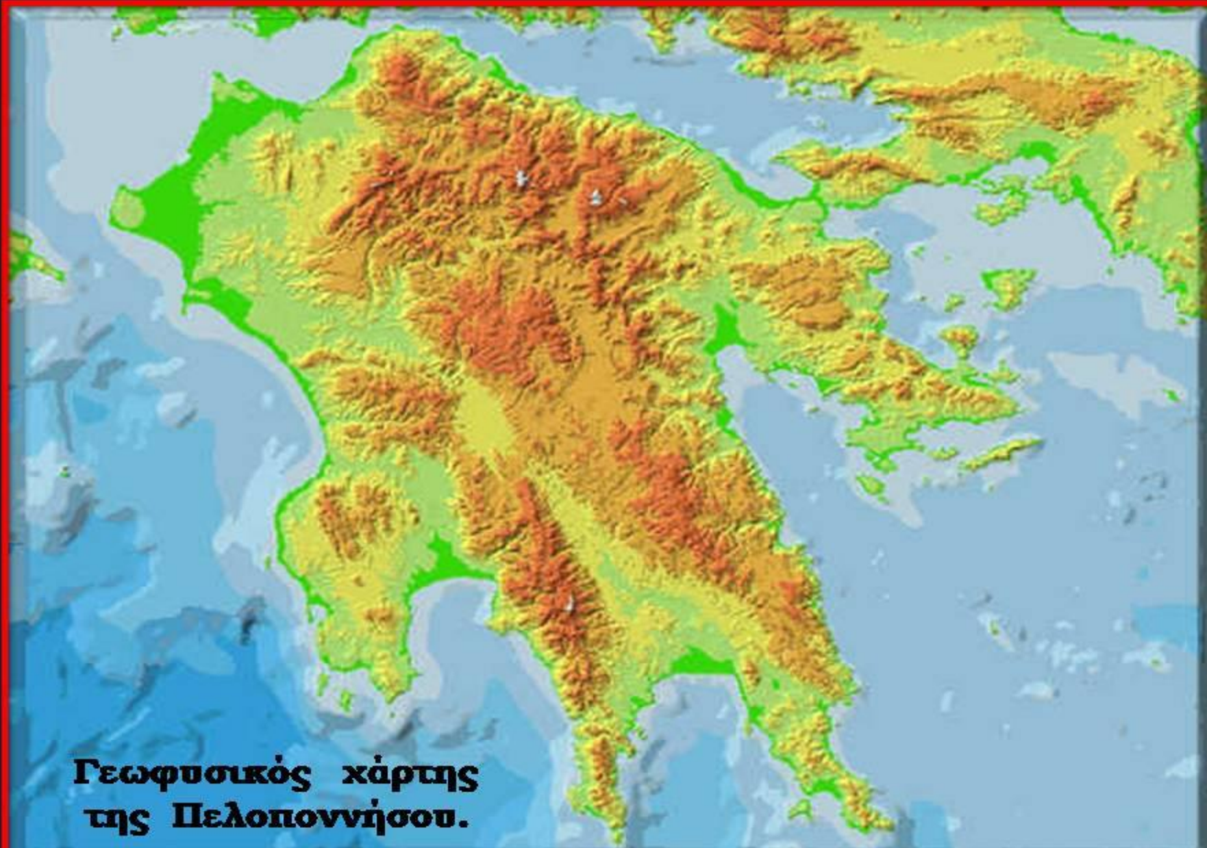
Γεωφυσικός χάρτης της Πελοποννήσου.