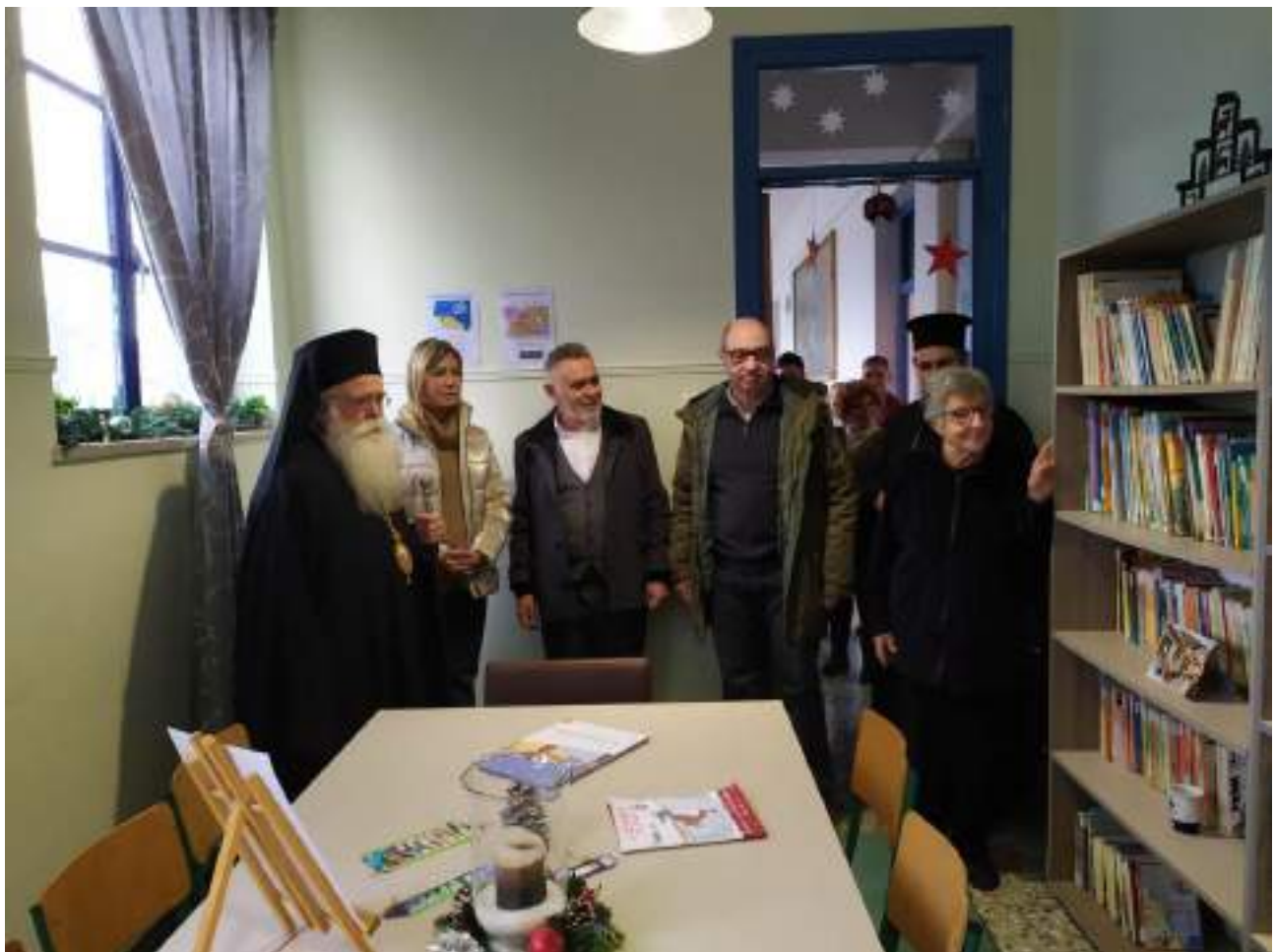
Εγκαίνια σχολικής Βιβλιοθήκης από την Υφυπουργό Παιδείας, 20/12/2022