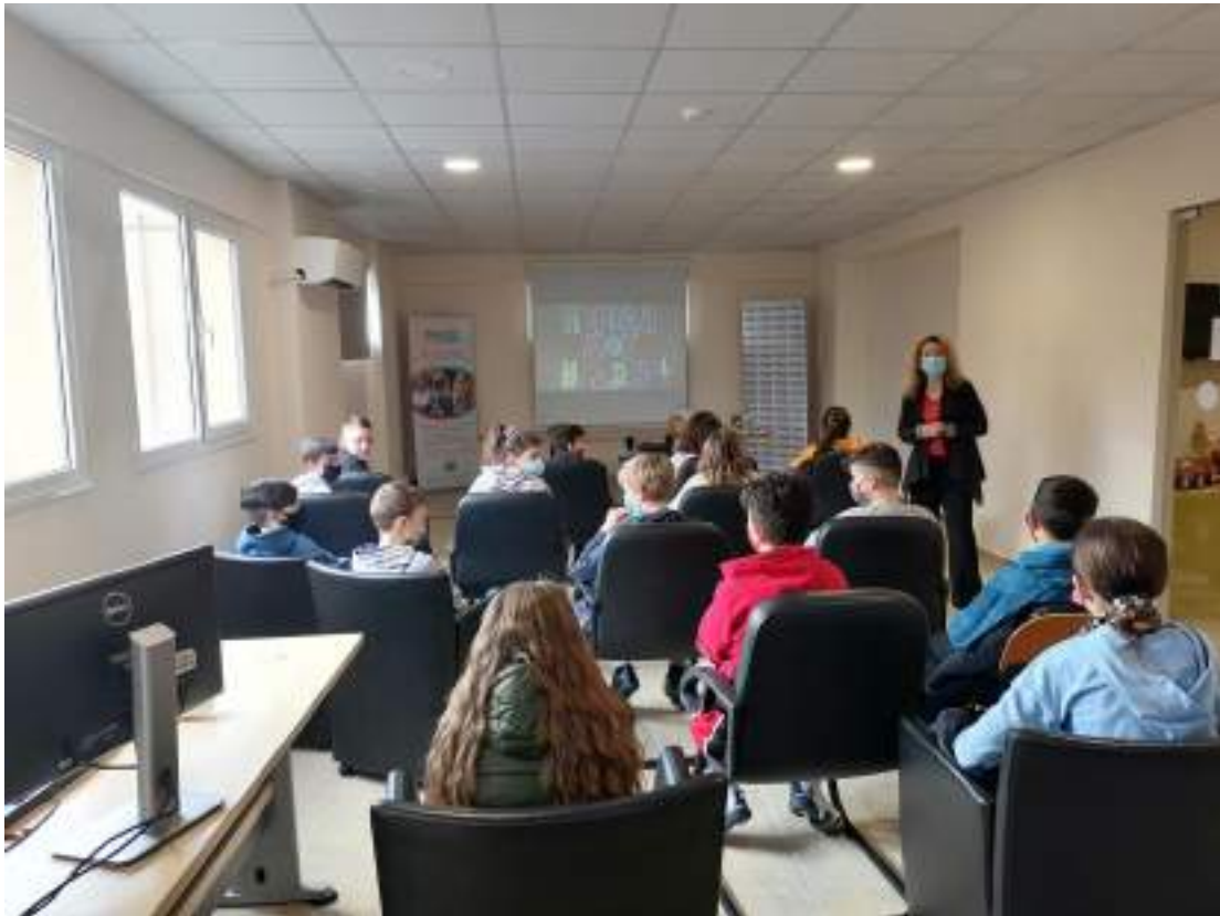
Συνεργασία με την ΕΛΕΠΑΠ-τμήμα Βόλου