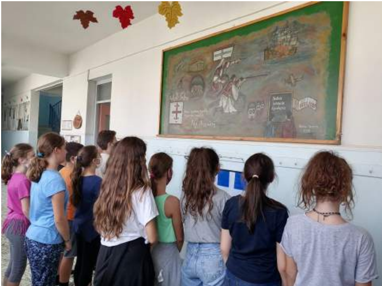
Ο πίνακας κιμωλίας γίνεται πίνακας ζωγραφικής, Μάρτιος 2021