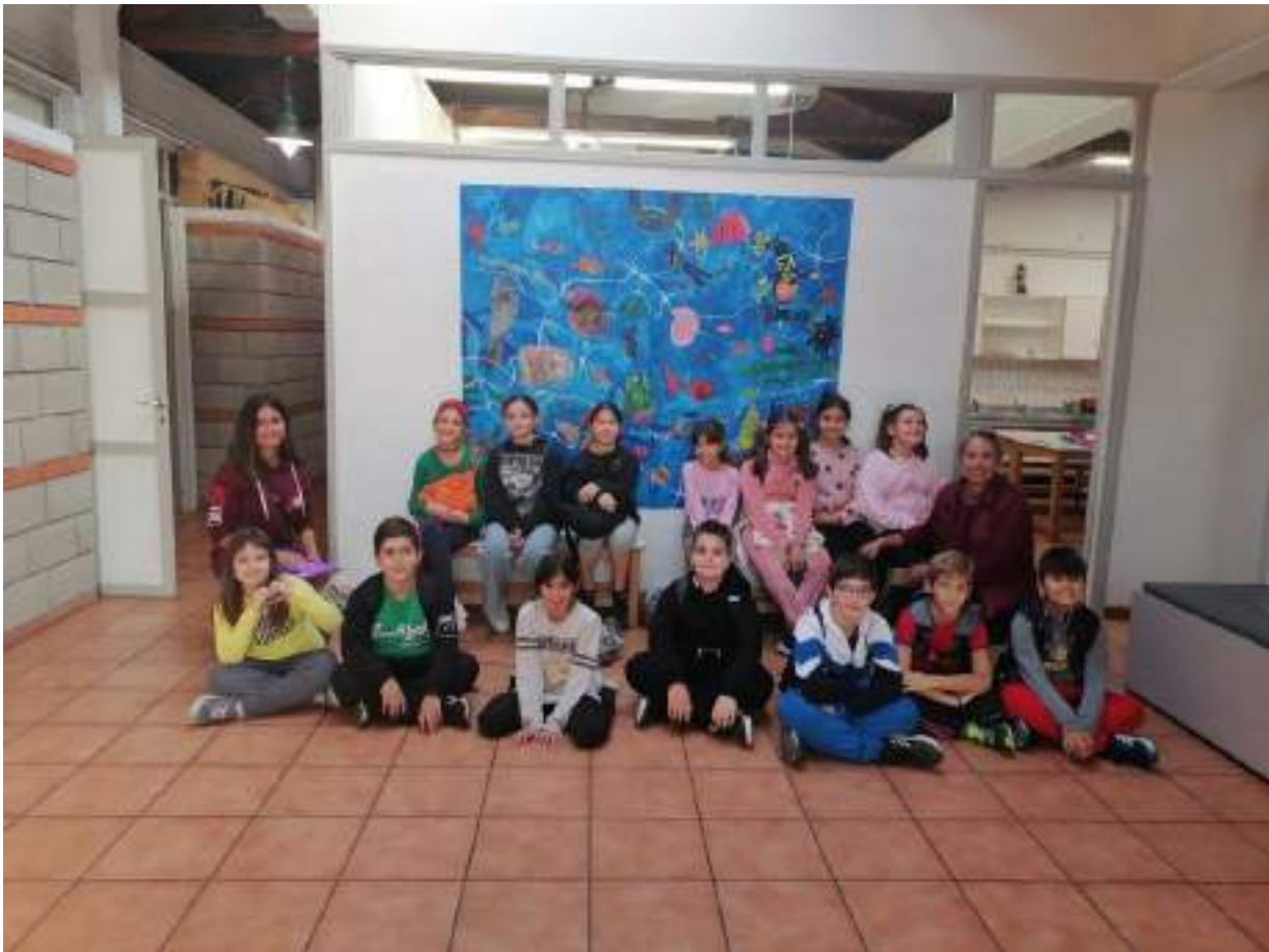
Η Δ' τάξη στο ΚΔΑΠ Νεάπολης-εκπαιδευτικό πρόγραμμα, Νοέμβριος 2022