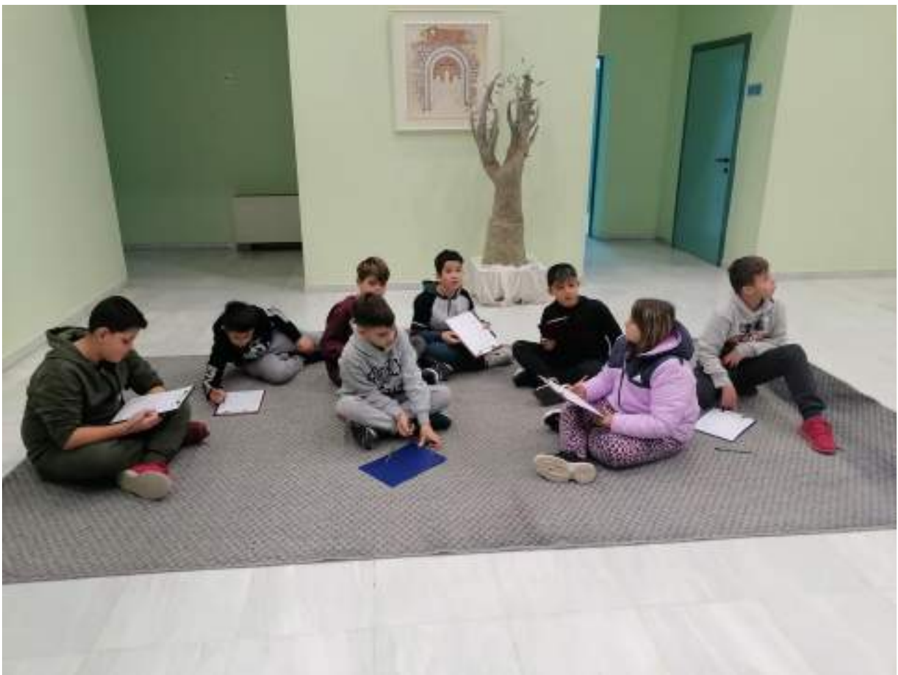
Η Ε΄ τάξη στο Συνεδριακό Κέντρο της Ι. Μητρόπολης Δημητριάδος σε εκπαιδευτικό πρόγραμμα που σχεδίασε και υλοποίησε ο Δ/ντής του 29ου Δημ. Σχολείου Βόλου, 14/12/2022