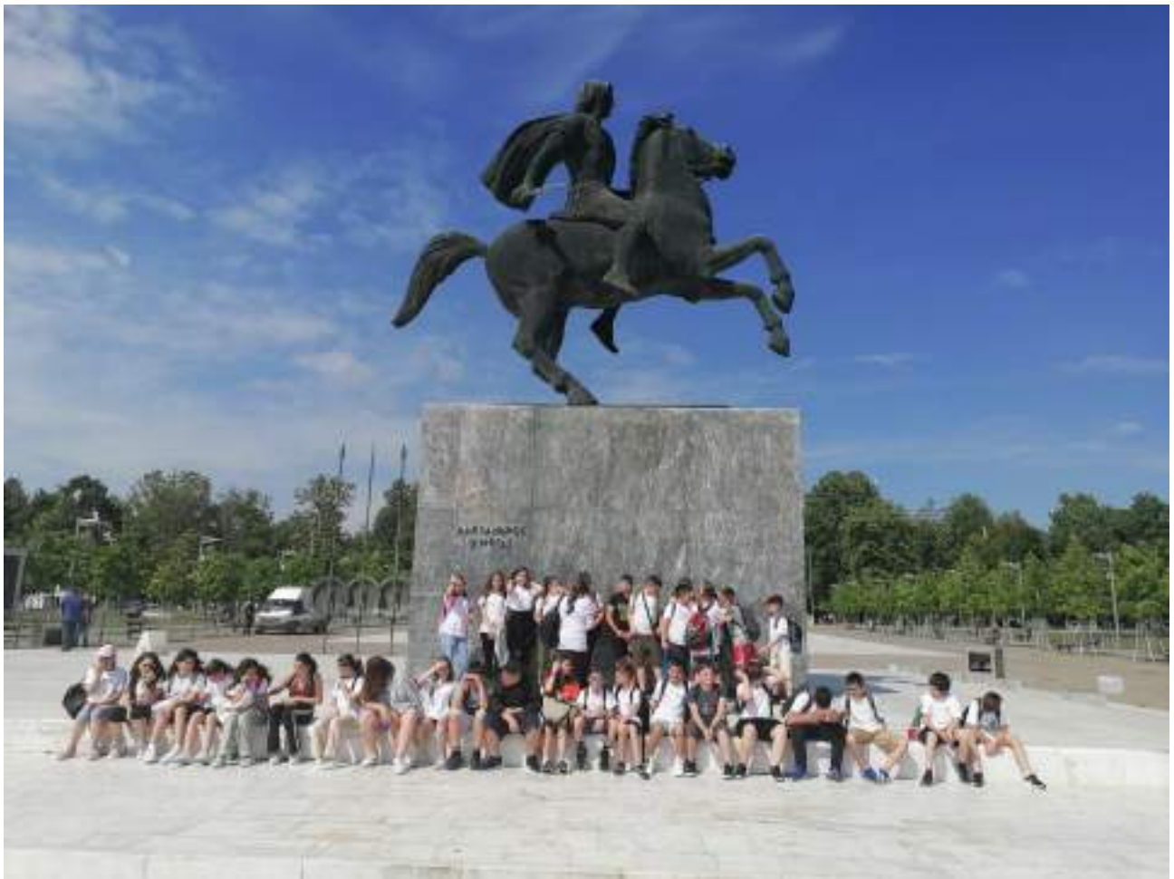
Η ΣΤ΄ τάξη στη Θεσσαλονίκη, 8/06/2023