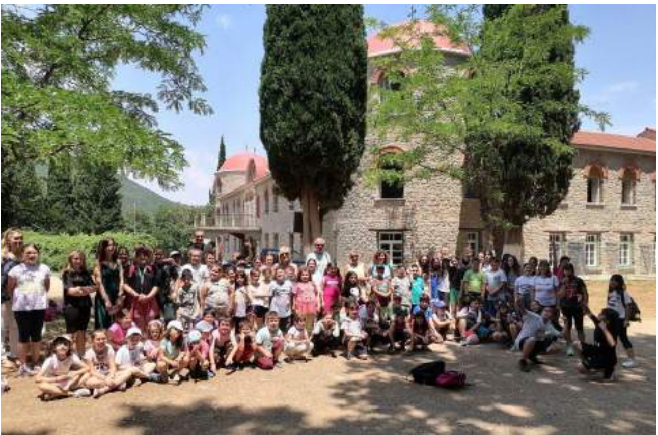
φωτογραφία: Στην Παναγία Ξενιά, Ιούνιος 2022