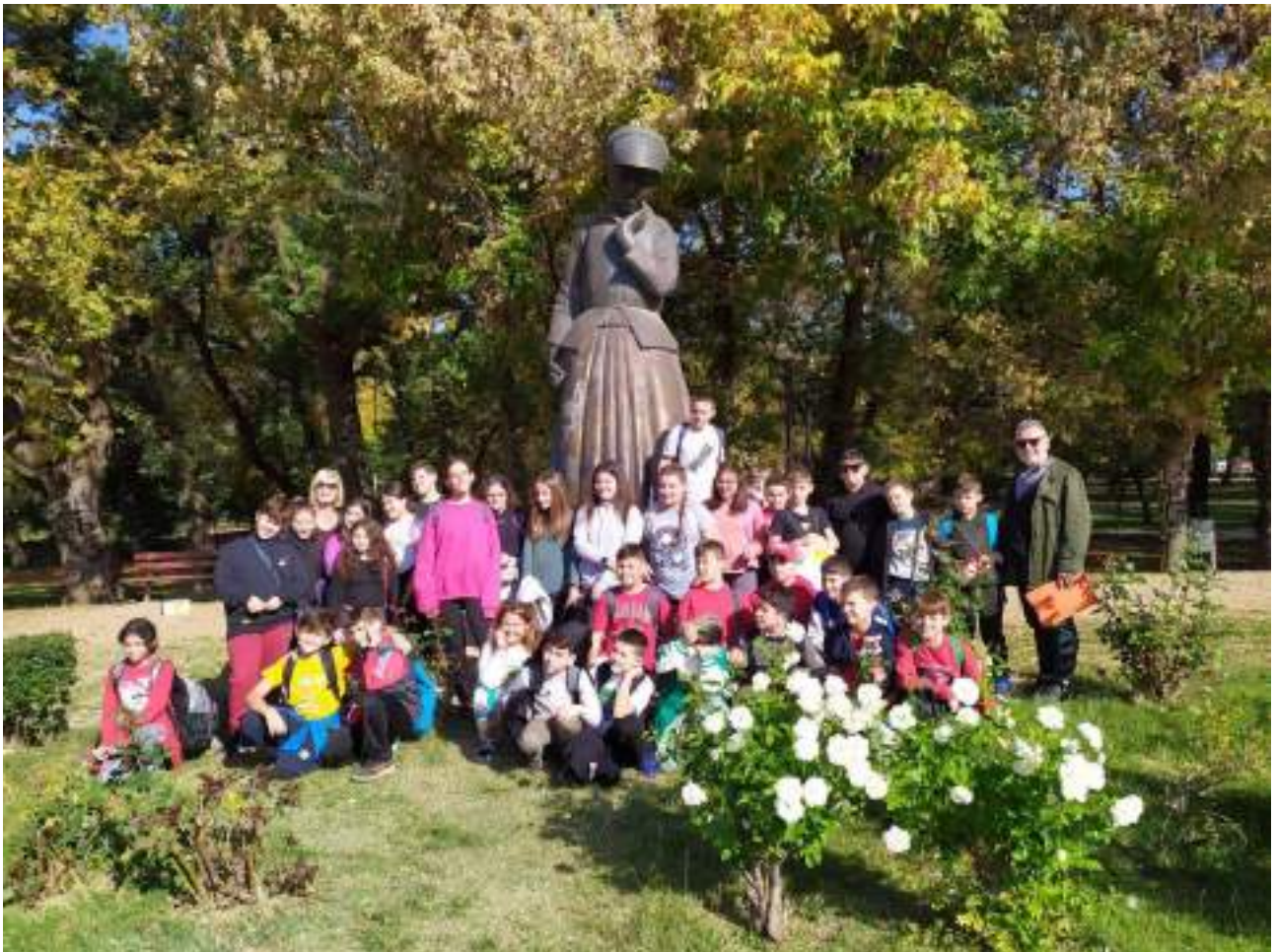
Οι τάξεις Ε΄ & ΣΤ΄ στην Καρδίτσα & στον Βοτανικό κήπο Νεοχωρίου-Λίμνης Πλαστήρα Νοέμβριος 2022