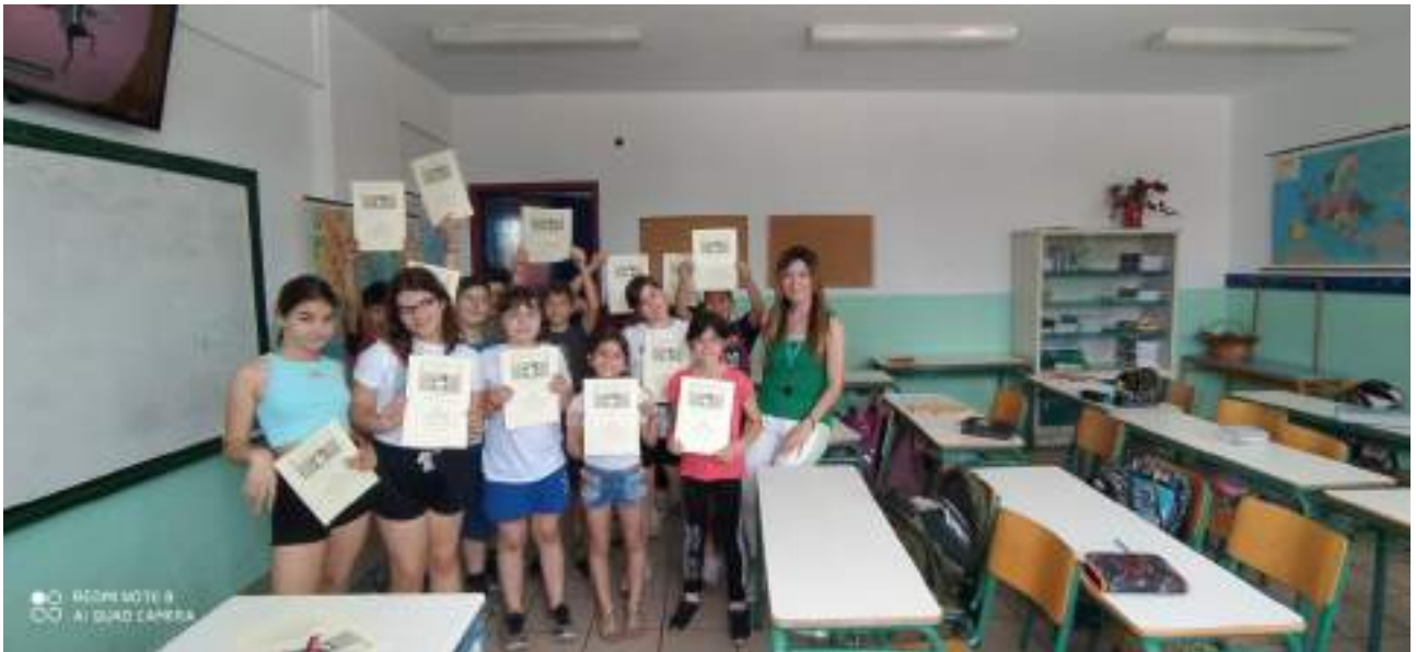
Πολιτιστικό πρόγραμμα της Δ΄ τάξης «Κυριακίδης: Για την Ελλάδα», σχολική χρονιά 2022-23