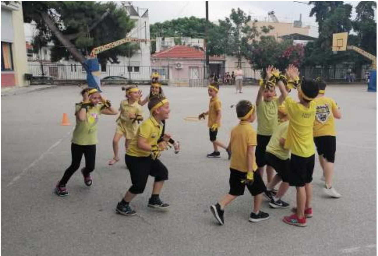
Γιορτή λήξης 12/06/2023