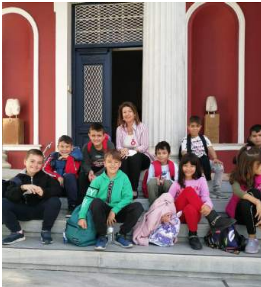
Η Γ΄ τάξη στο Αρχαιολογικό Μουσείο Βόλου, Νοέμβριος 2022