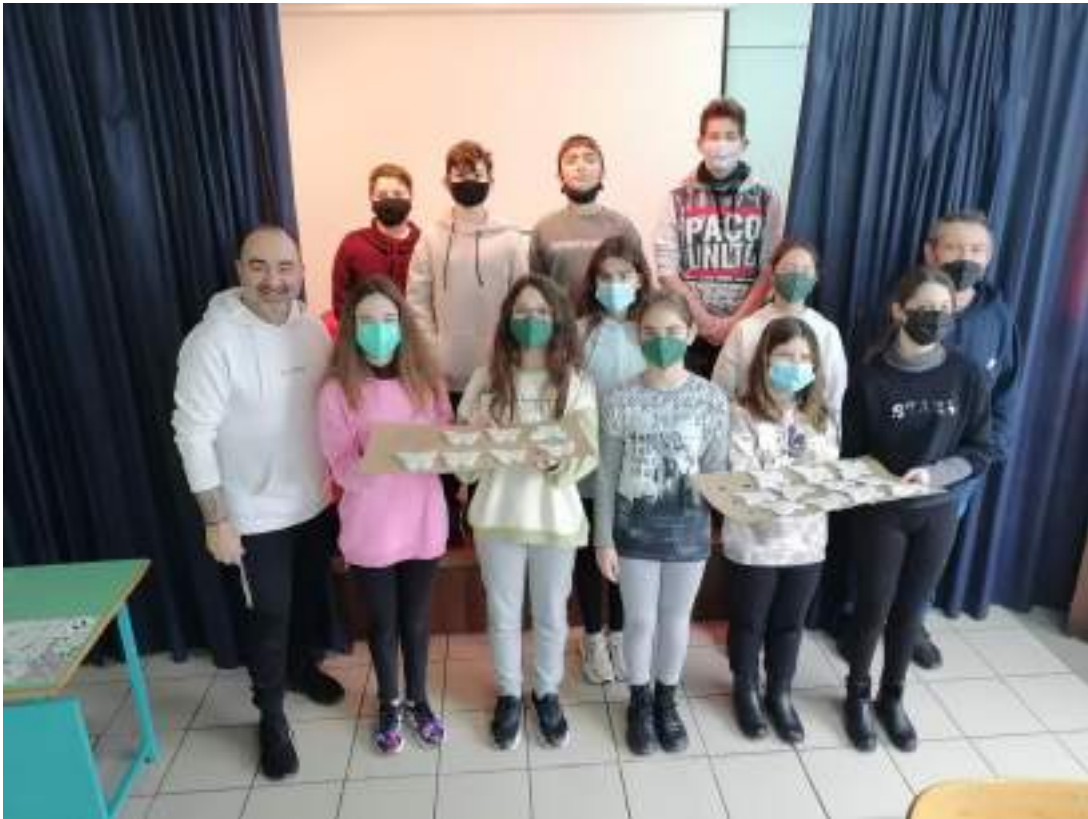
Πρόγραμμα «The Butterfly Project - Εβραϊκό Μουσείο Ελλάδος», Ιανουάριος 2022