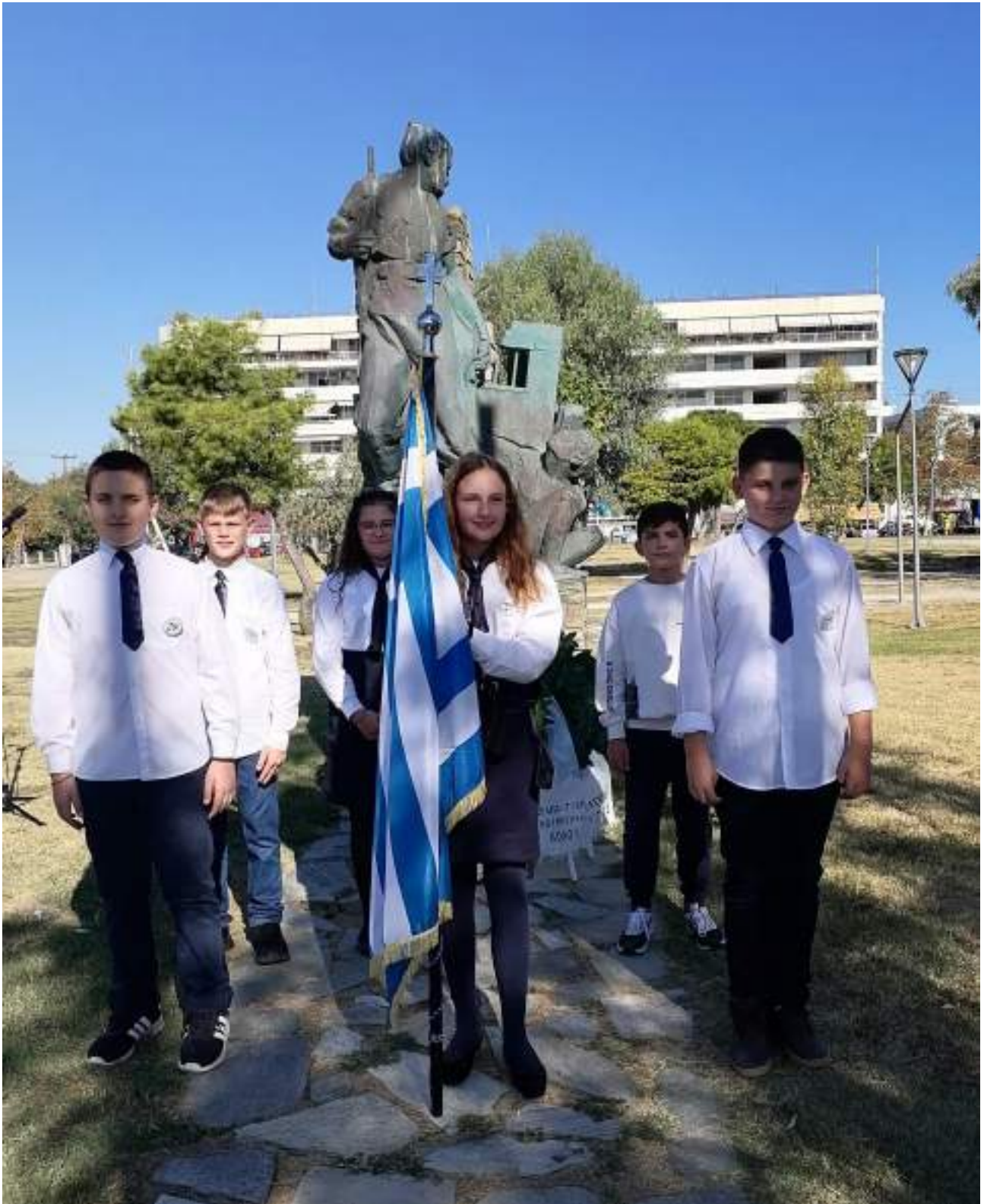
Συμμετοχή στην κατάθεση στεφάνων στο μνημείο Εθνικής Αντίστασης, 19 Οκτωβρίου 2022, ημέρα απελευθέρωσης από τα γερμανικά στρατεύματα.