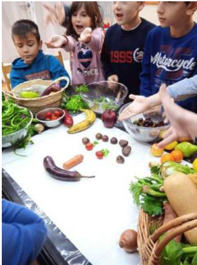
Η Α΄ τάξη σε πρόγραμμα για τη διατροφή, Νοέμβριος 2022