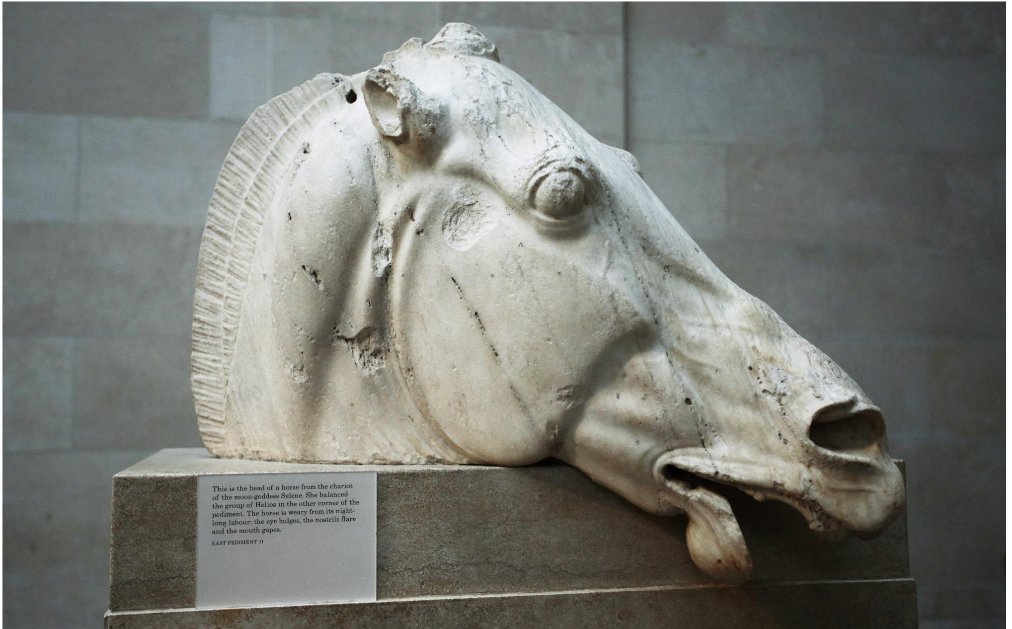
This is the head of a horse from the chariot of the moon-goddess Selene. She balanced the group of Helios in the other corner of the pediment. The horse is weary from its night-long labour: the eye bulges, the nostrils flare and the mouth gapes. EAST PEDIMENT O