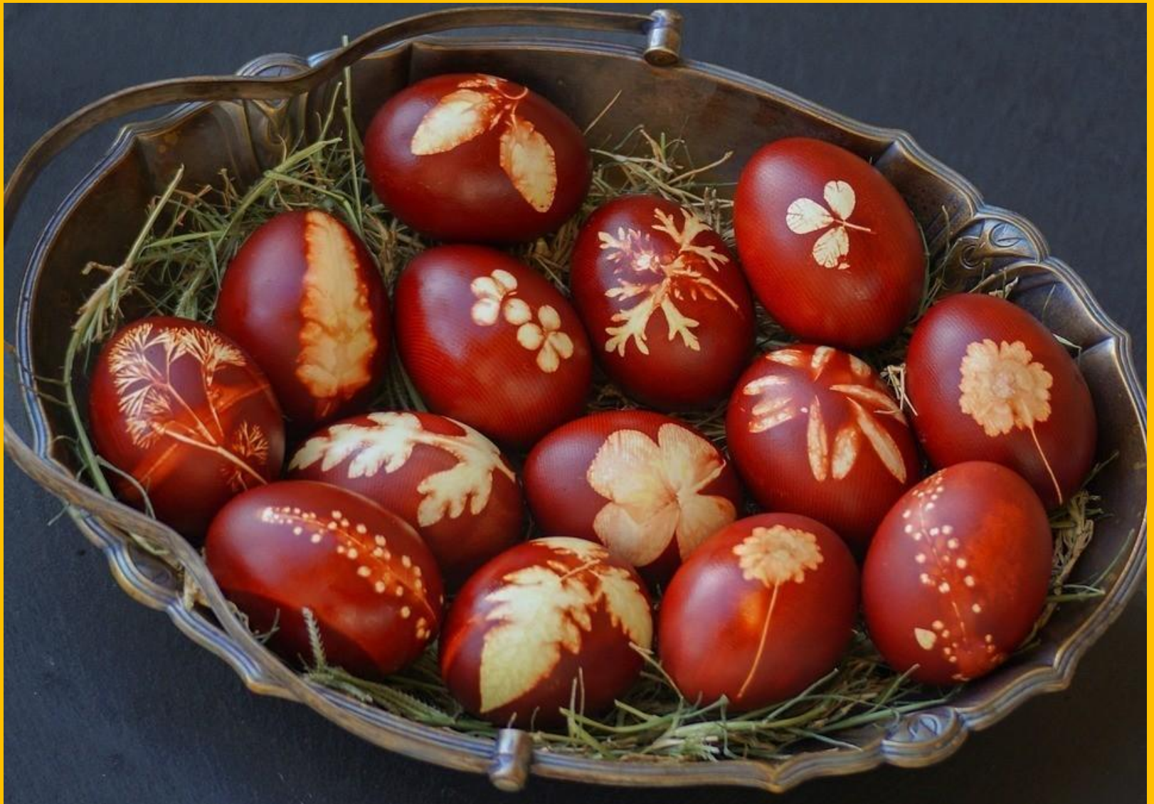
Τα κόκκινα αυγά