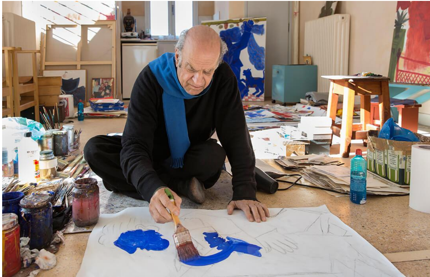
Ο ζωγράφος Αλέκος Φασιανός