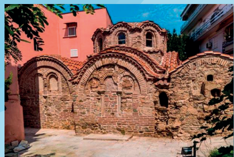
Ναός του Αγίου Παντελεήμονος Λουτρά Παράδεισος Βυζαντινό Λουτρό της Άνω Πόλης