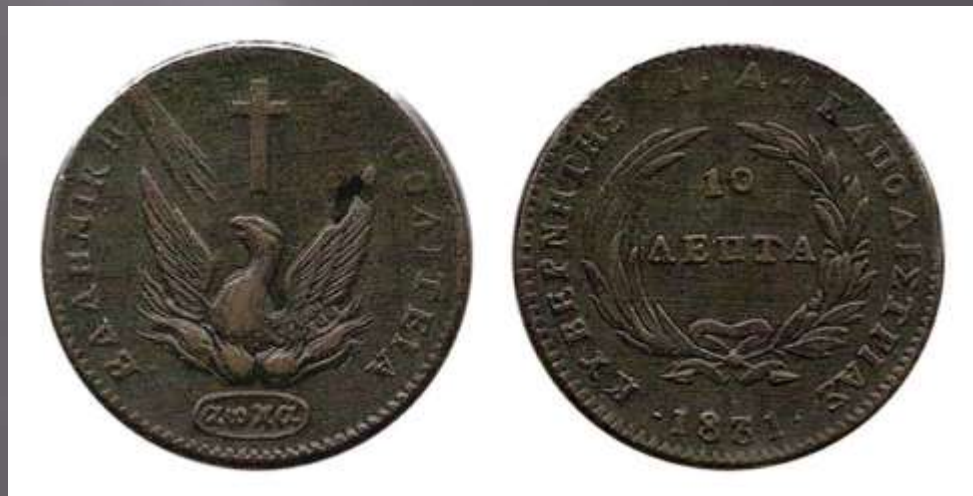
Ο Φοίνικας, το νόμισμα που αντικατέστησε το τουρκικό γρόσι