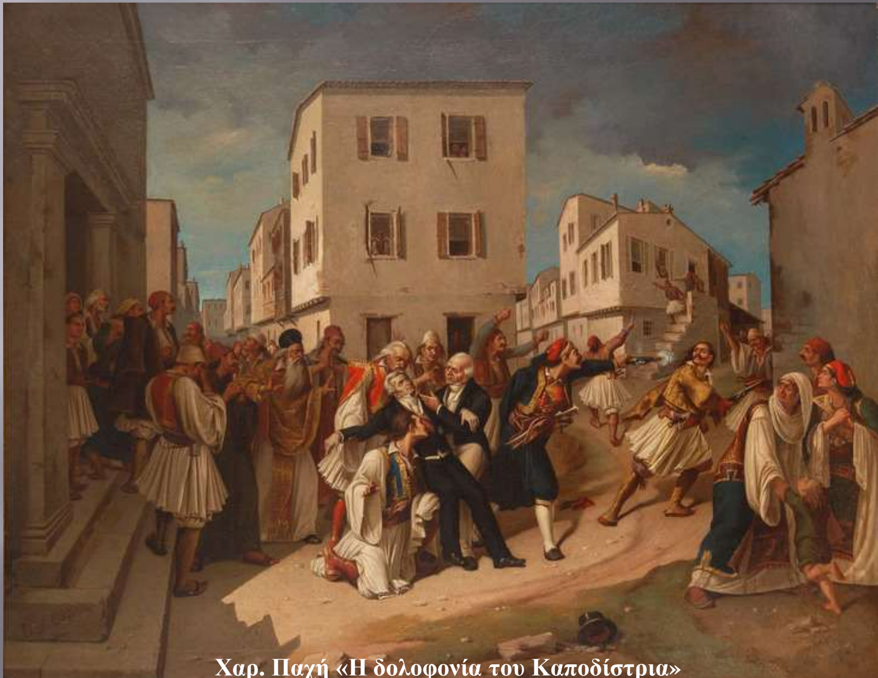
Χαρ. Παχή «Η δολοφονία του Καποδίστρια» Δημαρχείο Κέρκυρας