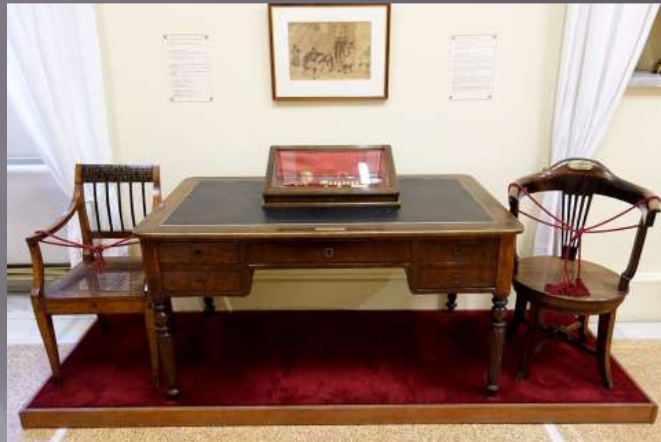
Το γραφείο του