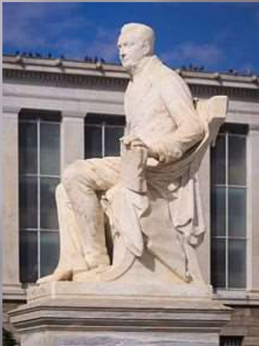
Άγαλμα του Ιωάννη Καποδίστρια στην οδό Πανεπιστημίου, φιλοτεχνημένο από τον Γεώργιο Μπονάνο