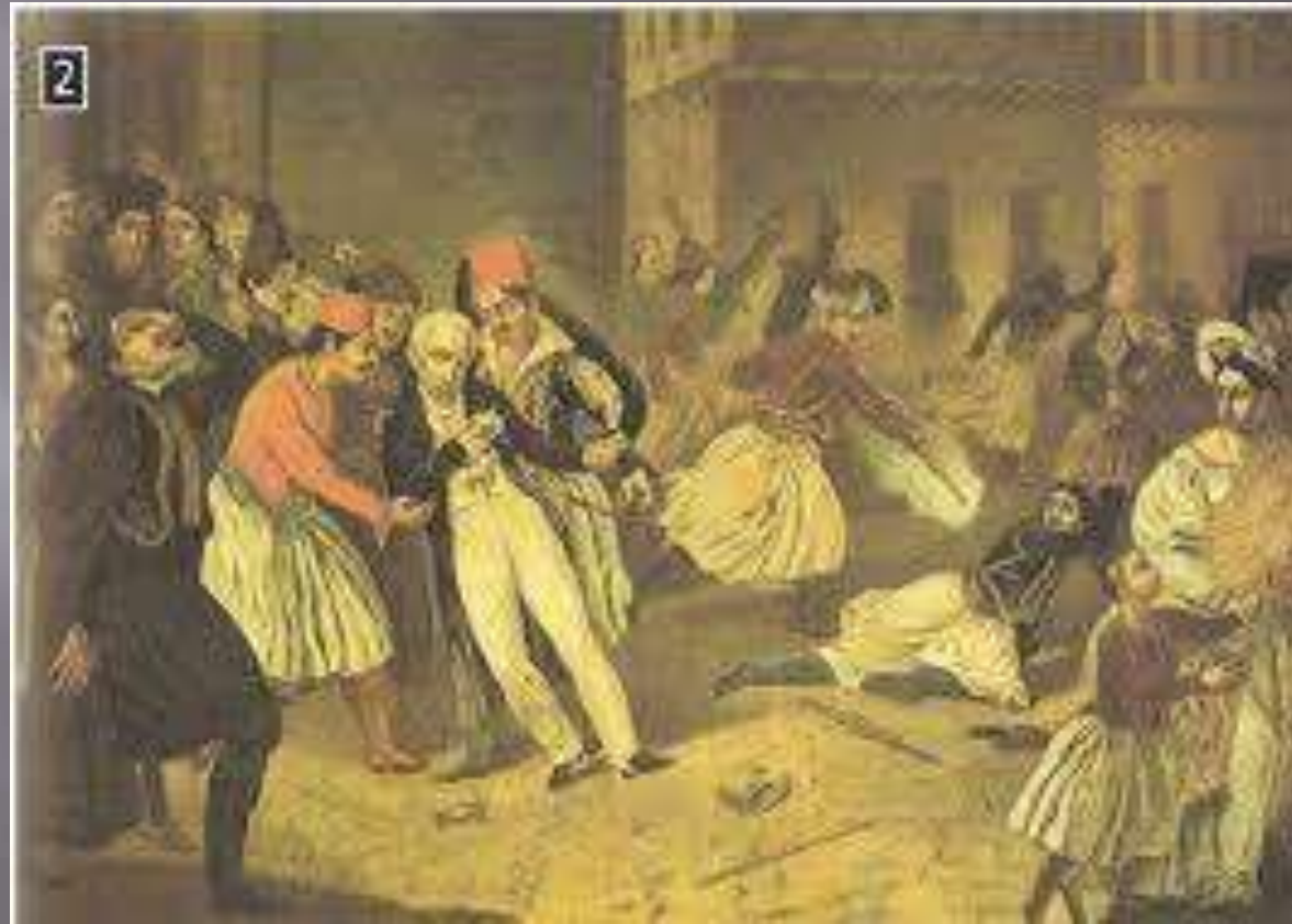
Η δολοφονία του Καποδίστρια – αγνώστου Μουσείου Μπενάκη

➤ Ακολούθησε χάος κι επικράτησε αναρχία στη χώρα.