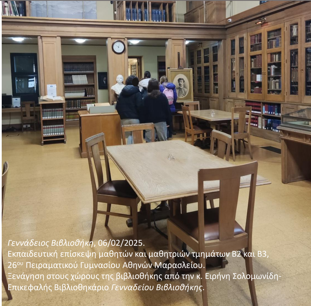
Γεννάδειος Βιβλιοθήκη, 06/02/2025. Εκπαιδευτική επίσκεψη μαθητών και μαθητριών τμημάτων Β2 και Β3, 26 ου Πειραματικού Γυμνασίου Αθηνών Μαρασλείου. Ξεναγήση στους χώρους της βιβλιοθήκης από την κ. Ειρήνη Σολομωνίδη-Επικεφαλής Βιβλιοθηκάριο Γενναδείου Βιβλιοθήκης .

Απαντήσεις αναζητήθηκαν μέσω της βιωματικής εκπαιδευτικής δραστηριότητας που αναπτύχθηκε στους χώρους της Γενναδείου Βιβλιοθήκης από την κ. Μαρία Γεωργοπούλου-Διευθύντρια Γενναδείου και την κ. Ειρήνη Σολομωνίδη-Επικεφαλής Βιβλιοθηκάριο Γενναδείου σε συνδυασμό με φύλλα εργασιών που εκπονήθηκαν από την κ. Μαρία Μαντάλα-Διευθύντρια Μαρασλείου Γυμνασίου και την κ. Αθηνά Χρόνη-Φιλολόγο Μαρασλείου Γυμνασίου, τα οποία διανεμήθηκαν στους μαθητές και μαθήτριες που συμμετείχαν.